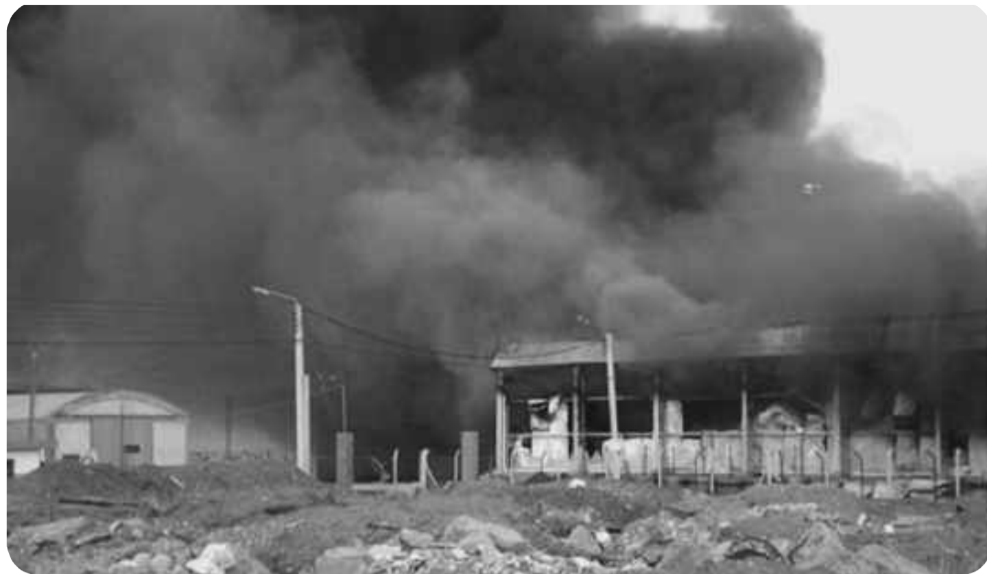
El galpón de una empresa pesquera arde tras la furia de los trabajadores marítimos

Hoy, sacando las lecciones de estas grandes luchas de la clase obrera, apuñaladas por la espalda por la izquierda reformista, preparamos los próximos combates peleando por poner en pie