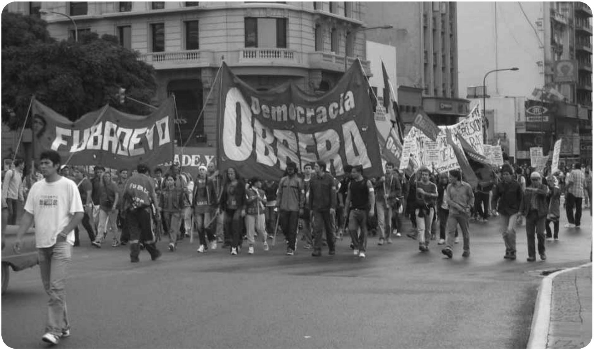
Movilización del FUBADEyO y Democracia Obrera el 1° de mayo de 2007

Llamamiento a una Conferencia Obrera Internacionalista para ponerlo en pie