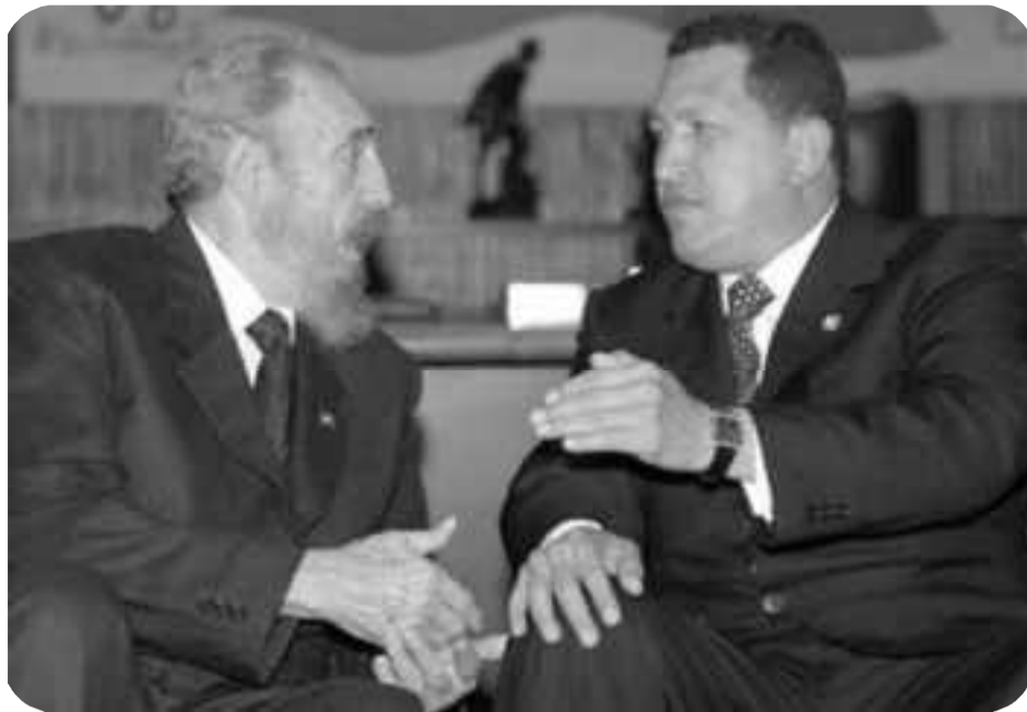
Fidel Castro junto a Chávez

Frente al imperialismo, defendemos a Cuba con los métodos de la lucha revolucionaria de clases, es decir, con la lucha revolucionaria de la clase obrera de América Latina y el mundo. Denunciamos y enfrentamos la política internacional de colaboración de clases de la burocracia castrista que, estrangulando la lucha de la clase obrera del continente y poniéndola a los pies de la burguesía, aísla aún más