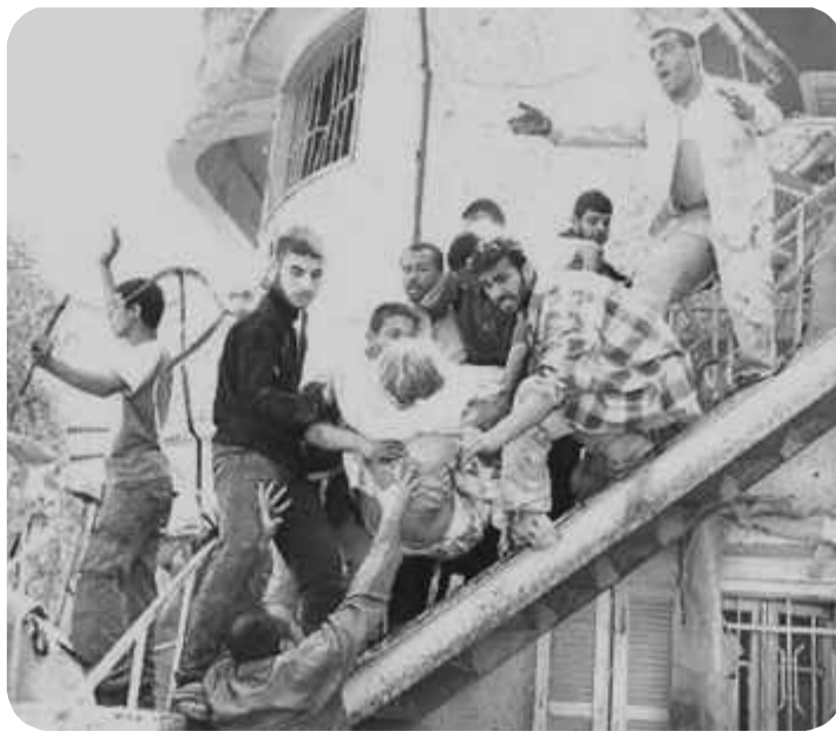
Trabajadores palestinos cargan un herido tras un ataque aéreo sionista

¡Por la coordinación de la lucha de la clase obrera del continente contra el imperialismo y los patrones nativos! ¡Por la unidad de los trabajadores latinoamericanos con la clase obrera de los Estados Unidos!