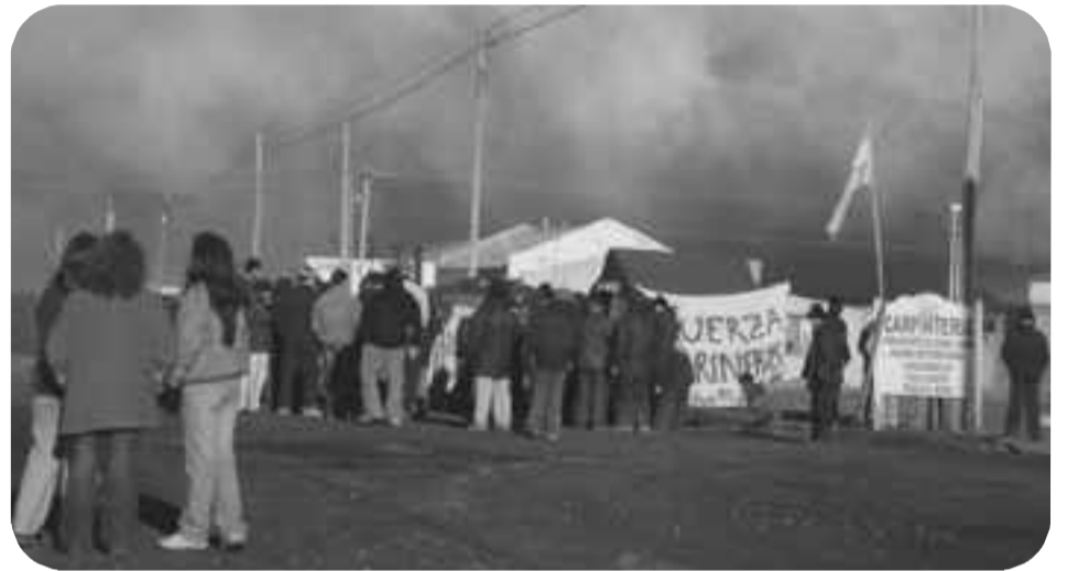
Trabajadores marítimos en Puerto Deseado

Para la gente de acá, de Puerto Deseado, nosotros ganamos en una marea $6.000, es mucha plata según ellos. Pero si la marea dura 10 diez días y el buque se llena ganamos $6.000, pero si la marea dura 45 o 60 días y no llenamos el buque ¡ganamos 2 mil pesos! ¡No nos pagan