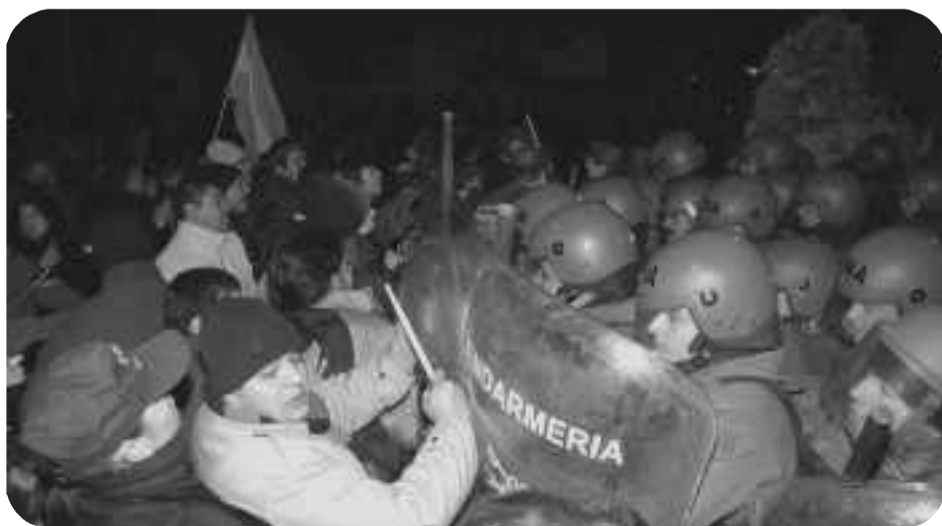
Santa Cruz: Docentes y municipales enfrentan la represión de la Gendarmería

Contra los reformistas y los colaboracionistas de todo pelaje, reafirma-