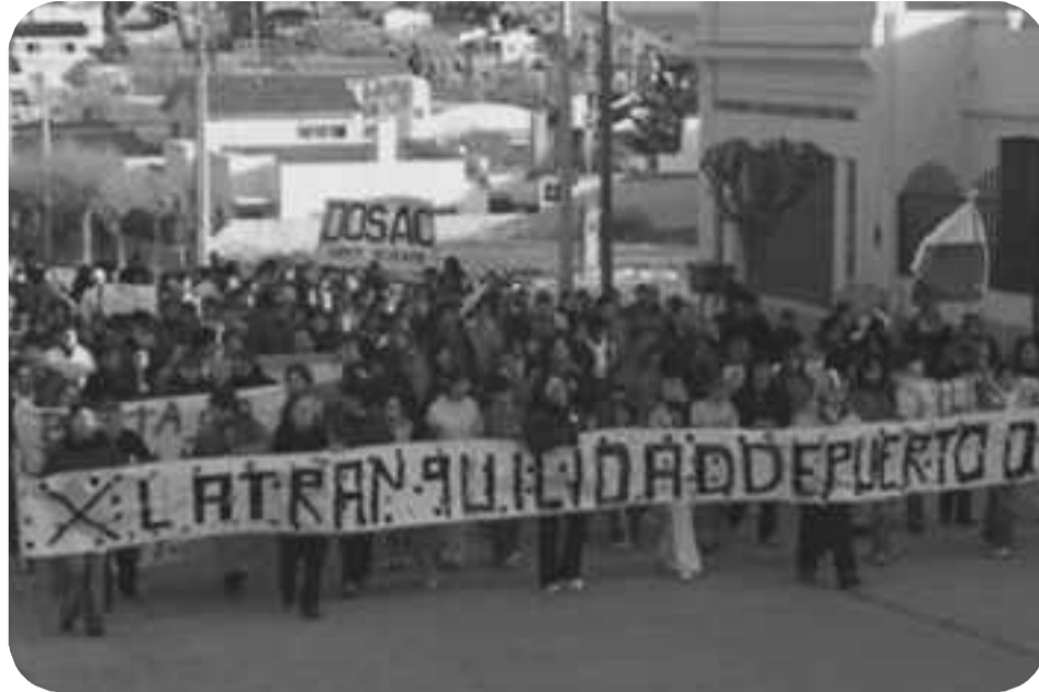
Movilización en apoyo a los trabajadores marítimos de Puerto Deseado

La muerte del policía en Las Heras fue un acto de defensa propia de los trabajadores y el pueblo cansados de tanta represión de la maldita policía asesina. Acá nos esperaban en la ruta, se llevaron el chasco porque se hizo todo acá, por suerte. Gastamos pólvora nosotros y esto va a tener un pago seguramente, un vuelto. El piquete es el arma más fuerte que tenemos, que si se llega a globalizar podemos cambiar muchas cosas, pero obviamente el gobierno -llámese municipal, provincial, nacional- que está del otro lado, esperaba que acá en Deseado haya un Carlos Fuentealba, dos o tres marineros muertos para salir a dar una solución. Gracias que no hubo muertos, sí destrozos.