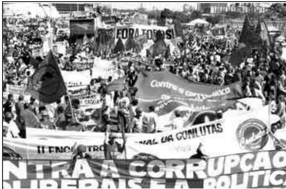
Movilización impulsada por la CONLUTAS en Brasil

Es por eso que la orientación del ELAC nada tiene que ver con las lecciones del combate que nos legara Trotsky cuando plantea: “¿Significa esto que en la era del imperialismo la existencia de sindicatos independientes es, en general, imposible? Sería básicamente erróneo plantear así esta cuestión. Lo que es imposible es la existencia de sindicatos reformistas independientes o semiindependientes. Es muy posible la existencia de sindicatos revolucionarios que no solo no sean agentes de la política imperialista sino