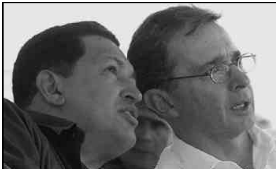
Chávez junto al asesino Uribe

Todo el “programa” del ELAC para Bolivia se reduce a plantear en su punto 15, como al pasar, “... No al intento imperialista y de la oligarquía de dividir a Bolivia ”. ¡Suficiente ilustración! Esta pequeña frase y todo el silencio que la circunda sobre la cuestión boliviana, son todo un programa. Porque si frente a Bolivia toda la tarea del proletariado latinoamericano se reduce a enfrentar al “imperialismo” y a la “oligarquía” que quieren “dividir” Bolivia... eso significa, por omisión, apoyar, aunque sea “críticamente”, al gobierno de frente popular de Morales que quiere una Bolivia “unida”... y burguesa. Es que “... No al intento imperialista y de la oligarquía de dividir a Bolivia ” es precisamente el programa del gobierno de Morales para contrarrestar la políti-