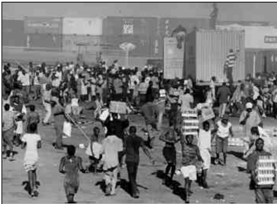
Los explotados haitianos retiran comida en Puerto Príncipe, bajo la vigilancia de las tropas gurkas de la Minustah

El ELAC defiende esta estafa a los trabajadores con la teoría-programa del “ socialismo de mercado ”, diciéndoles que se puede reformar el capitalismo putrefacto “ socializando el mercado ” mediante un supuesto “ intercambio social e igualitario ”, porque para ellos, el