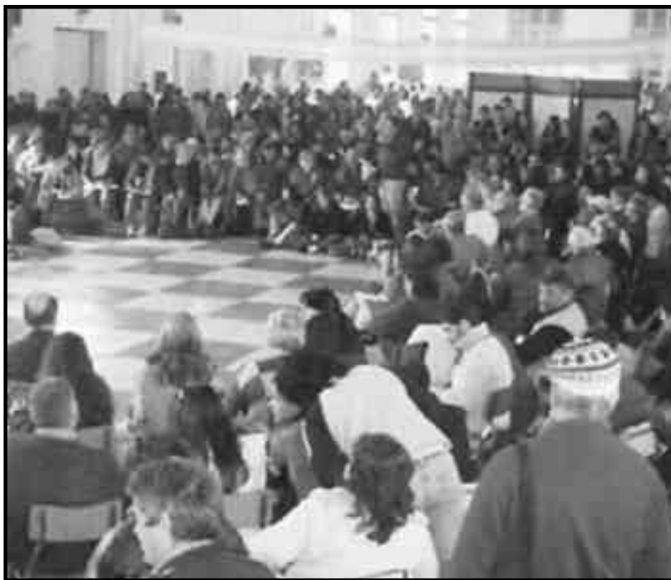
Reunión en Córdoba hacia la Constituyente Social

¿Qué es lo que hace necesario, entonces, que hoy, 7 años después de que el FRENAP pasara al basurero de la historia, se ponga en pie esta Constituyente Social con el mismo programa? Hay que decir la verdad: la consigna por "una Constituyente Social" es parte del programa de la CTA desde hace mucho tiempo, pero adquirió relevancia a partir de la disputa burguesa entre la patronal del campo -apéndice de la Bolsa de cereales de Chicago y de las grandes transnacionales cerealeras como la Cargill y la Monsanto- y la del gobierno de los Kirchner -representante de los monopos-