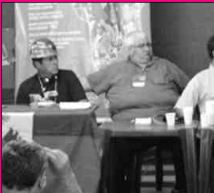
Encuentro Latinoamericano y Caribeño de Trabajadores (ELAC) en Brasil