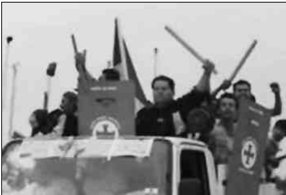
Bandas fascistas de la Media Luna, Bolivia

Por el contrario, la teoría-programa de la Revolución Permanente plantea en su Tesis 2 claramente “... Con respecto a los países de desarrollo burgués retrasado, y en particular de los coloniales y semicoloniales, la teoría de la revolución permanente significa que la resolución íntegra y efectiva de