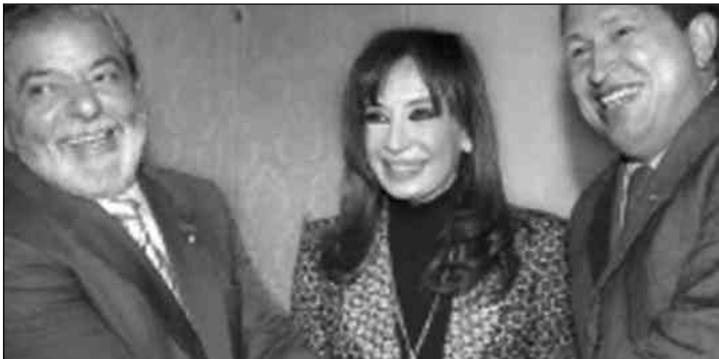
Lula, Cristina Kirchner y Hugo Chávez

¿Y de qué “paritaria social” hablan estos cacatúas de la patronal? ¿De las paritarias que dejan por fuera de toda discusión salarial y sin ninguna defensa al