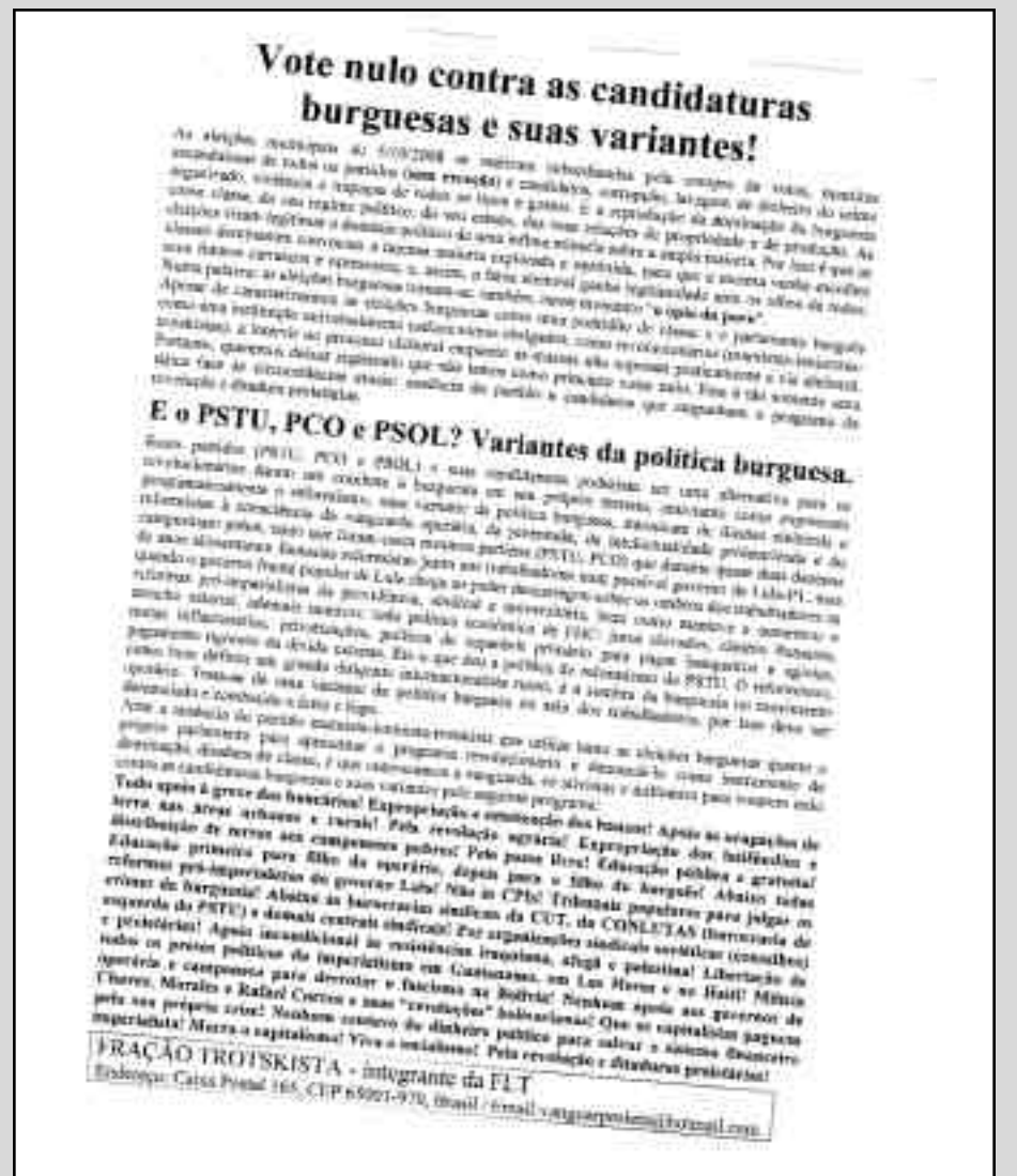
Facsimil del volante por el voto nulo de la FT de Brasil

FRACCION TROTSKISTA INTEGRANTE DE LA FLT DIRECCIÓN: CAIXA POSTAL 165, CEP 65001-970, BRASIL / EMAIL:VANGUARPOLETA@HOTMAIL.COM