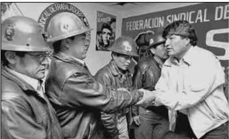
Evo Morales se estrecha la mano con los dirigentes colaboracionistas de la Federación minera

Pero por sobre todo, el ELAC fue un “raro” Encuentro de direcciones de centrales sindicales de “izquierda”, que se niegan a levantar el programa para echar a la burocracia de las organizaciones obreras, dejando a millones de trabajadores bajo el sometimiento de la burocracia pro patronal. Ni una palabra dicen en su programa de ¡Abajo la burocracia sindical! ¡Fuera las manos del Estado burgués de las organizaciones obreras! ¡Fuera el Ministerio de Traba-