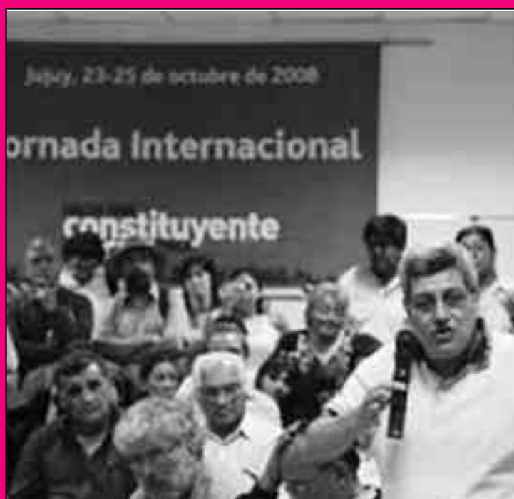
Jornada internacional de inauguración de la Constituyente Social, Argentina