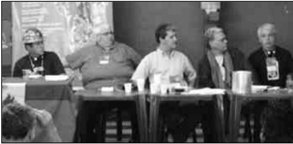
Arriba: Mesa de dirección del ELAC, con la presencia de dirigentes del sindicato minero de Huanuni en representación de la COB. Abajo: 5 de agosto de 2008, la brutal represión contra los mineros de Huanuni.

Este ELAC no fue un encuentro sindical revolucionario que se pronunciara y se organizara para luchar contra el frente popular y la política de colaboración de clases con la que se expropia y estrangula la lucha de las masas en América Latina; ni contra la sumisión a