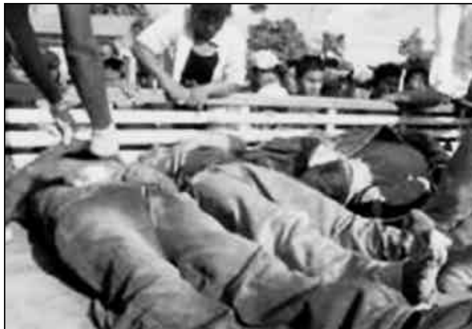
Campesinos masacrados en Pando por las hordas fascistas

Este sometimiento a Evo impide la lucha abierta de los explotados por la tierra, las fábricas, los hidrocarburos. Impide a la clase obrera ganarse a la mayoría del campesinado pobre, porque impide que el proletariado luche en las calles por la expropiación del latifundio y por la tierra para el campesino pobre, y por expropiar a los bancos pa-