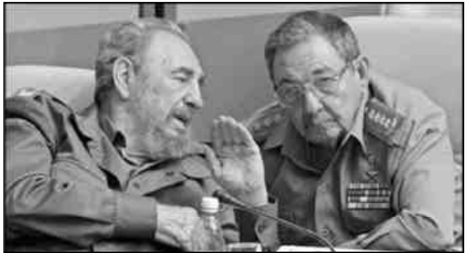
Fidel y Raúl Castro

Solamente se lucha contra los padecimientos de las masas cubanas, luchando por derrocar a la camarilla restauracionista castrista con soviets de