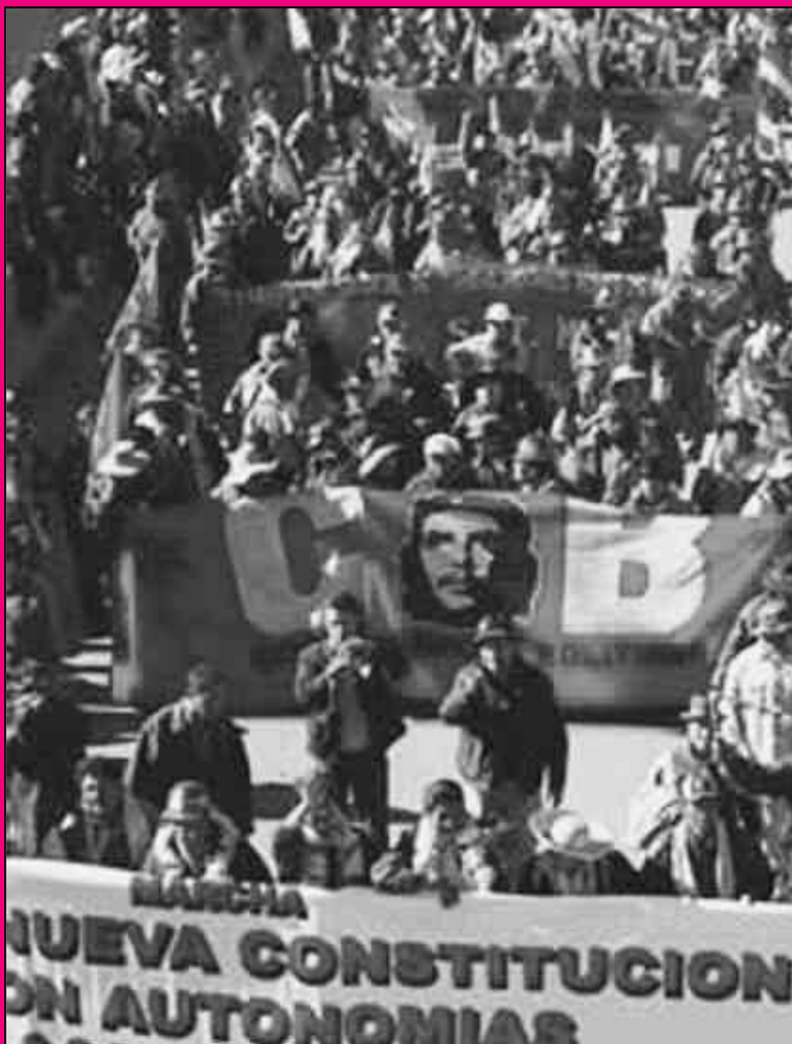
Bolivia: movilización de la COB y el movimiento campesino en apoyo al nuevo pacto contrarrevolucionario de Morales con la burguesía fascista por el referendun constitucional