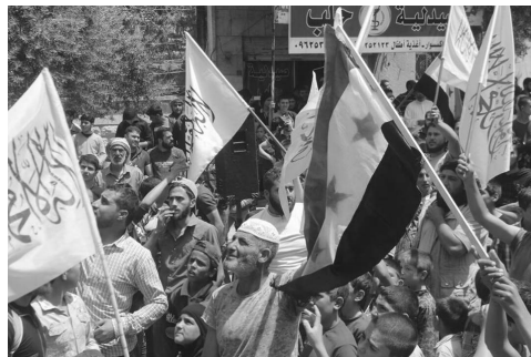
Movilización del 26 de mayo en Idlib

Estos últimos han renegado abiertamente de la lucha por la dictadura del proletariado y de la revolución socialis-