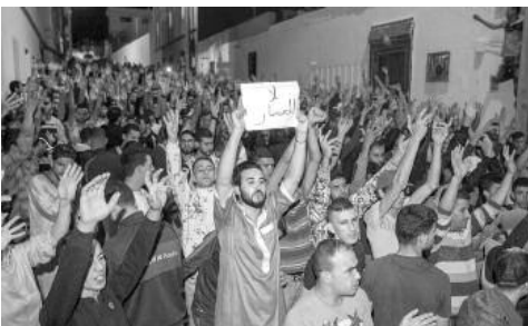
Movilización de los explotados marroquíes

Esto indica que se acabaron esos supuestos "milagros del mercado" que