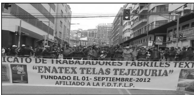
Trabajadores de ENATEX en lucha

de las manos de la burocracia colaboracionista la Central Obrera Boliviana (COB) para ponerla al servicio del conjunto de los trabajadores. En esas duras jornadas los obreros de base le