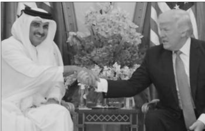
El Emir de Qatar Tamim Bin Hamad junto a Trump

Aprincipios de junio, Arabia Saudita anunció que rompía relaciones diplomáticas con Qatar. Lo mismo anunciaron Egipto, Emiratos Árabes Unidos (EAU) y Bahrein. Seguido de este anuncio, retiraron a sus embajadores, cerraron las fronteras y rompieron toda relación comercial. Devolvieron mercancía ya comprada que estaba pendiente de pago, dieron de baja todos los contratos y se negaron a seguir vendiendo, entre otras cosas, alimentos.