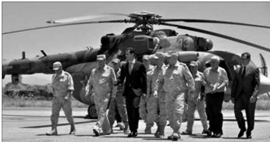
El asesino Al Assad junto a sus generales

Llamamos a que se ponga en pie una Asamblea Nacional Siria , votando delegados uno cada diez mil, de trabajadores y campesinos pobres de cada campo de refugiado, de cada ciudad rebelde y zona donde se combata y se libere contra Al Assad. Tenemos que recuperar las armas para la lucha contra Bashar y no para establecer puestos de control internos, que no tienen otro fin que el de establecer las "zonas seguras" de Astana. Los arsenales y todas las armas de la revolución deben estar a disposición y servicio de los comités de coordinación para continuar la lucha contra Bashar. ¡Cada hombre un fusil! ¡Hay que desarmar a todos los hombres de