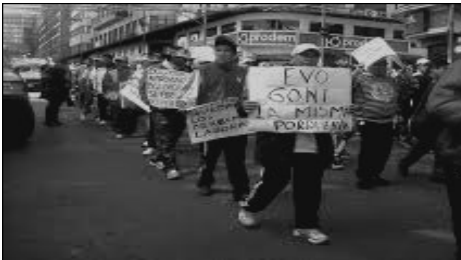
Fabriles movilizados: "Evo- Goni la misma porquería"

Liga Socialista de los Trabajadores Internacionalistas de Bolivia