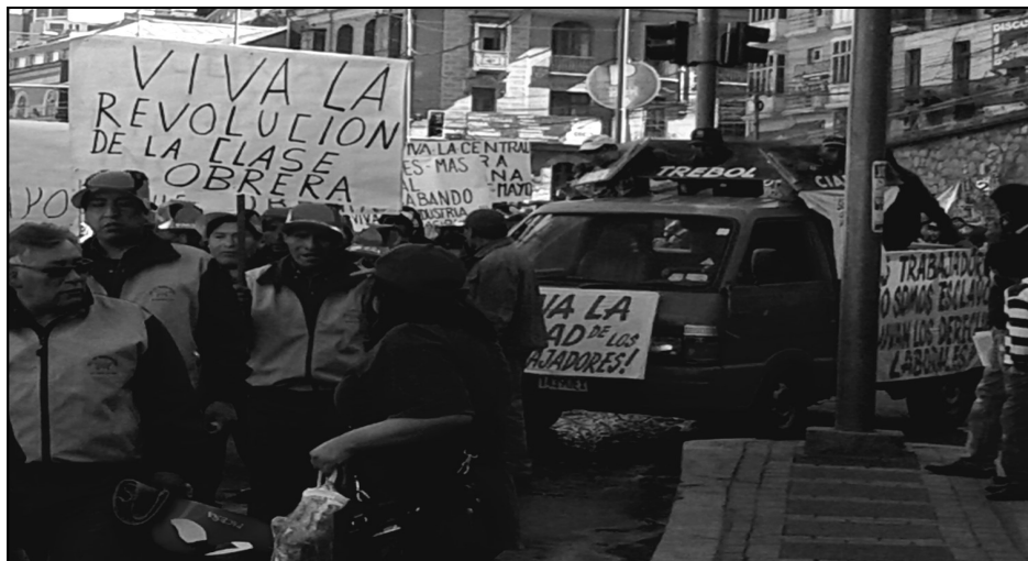
Fabriles en lucha: "Viva la revolución de la clase obrera"

Los empresarios son parte de la clase dominante parásita. Ellos son los ladrones que cada día nos explotan aumentando sus ganancias a costa de nuestro sudor, sangre y músculos, aumentando los ritmos de producción,