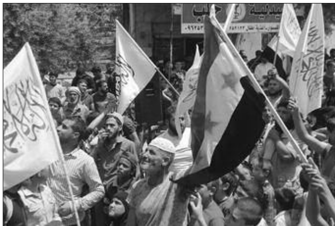
Marcha en Idlib el 26 de mayo

El ISIS provee a su vez una gran excusa a EEUU, Assad, Putin para que bombardeen a mansalva a las masas en nombre de una supuesta "lucha contra el terrorismo". ¡Ellos son los terroristas! EEUU no bombardea al ISIS, sino a civiles en Raqa, Deir ez Zor e inclusive en la ciudad iraquí de Mosul. Hay miles y miles de muertos por la aviación yanqui mientras el ISIS