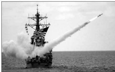
Misil lanzado por los EEUU a territorio sirio.

En EEUU, con la excusa de "enfrentar a Bush", sometieron a la clase obrera a Obama, y fue éste, en 8 años de