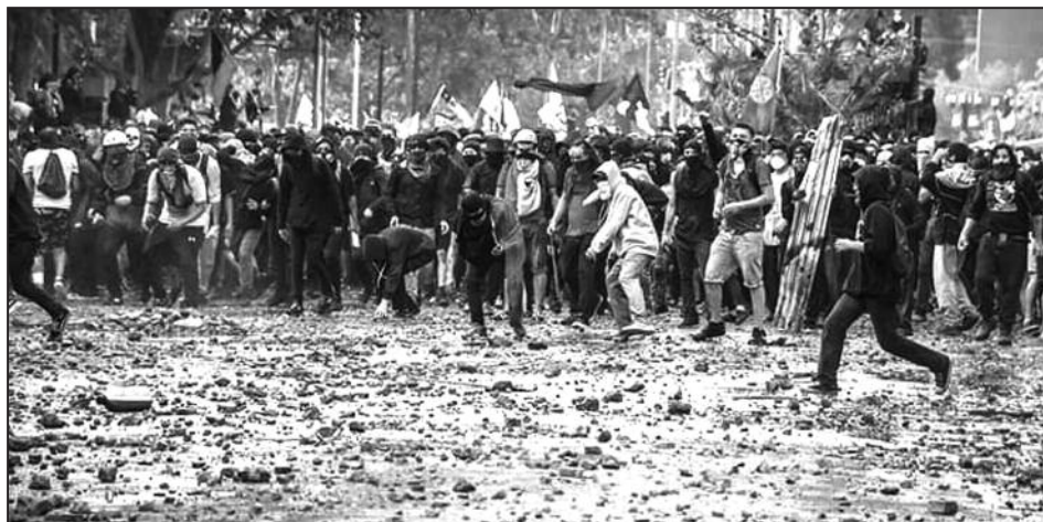
4-11-2019. Combates en el centro de Santiago

Al servicio de esto, los políticos de la Concertación, los “pacos de rojo” del PC y el Frente Amplio llaman a “Cabildos ciudadanos” junto a los mismos alcaldes y concejales que han sido pilares, voceros y sirvientes del régimen de la Constitución del '80 contra el pueblo. Quieren llevar el combate revolucionario a los pies