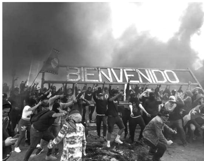
Barricada en la ciudad de Antofagasta

Hoy tenemos que recuperar La Moneda para poner allí el gobierno de los obreros, los campesinos pobres y la juventud revolucionaria de Chile. ¡Es hora de que go-