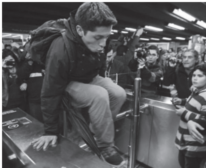
La "evasión" de los estudiantes en el metro

A 180° de las burocracias sindicales y estudiantiles, las masas comienzan a poner en pie sus organismos de autoorganización y democracia directa para pelear, como las asam-