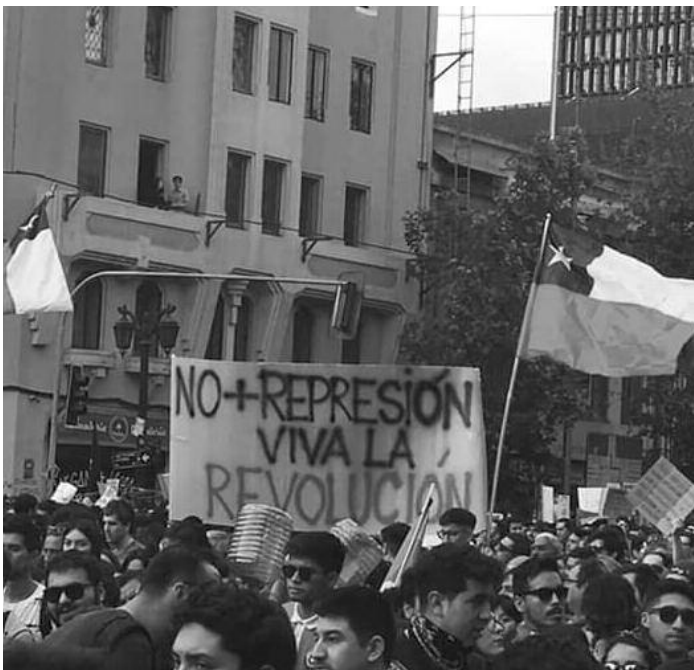
La juventud chilena a la vanguardia de la sublevación contra el régimen

Ahora el gobierno y los políticos patronales se llenan la boca hablando de pactos y diálogos solo para sacar a las masas de las calles. Quieren impedir que Piñera caiga a