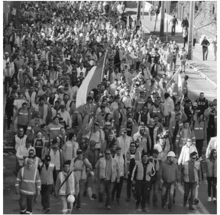
Movilización de obreros portuarios