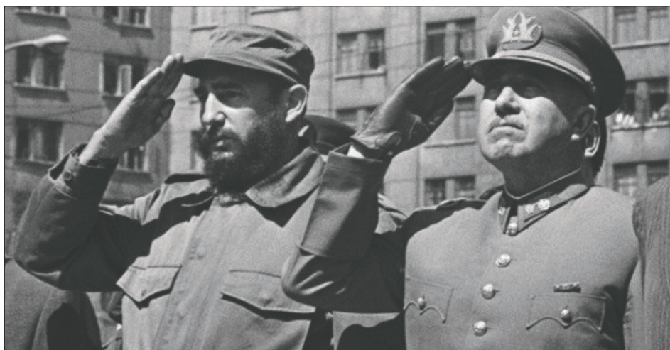
Fidel Castro junto a Pinochet durante su visita a Chile

Antes del inicio de la revolución, en 1967, el PS realizó un Congreso en Chillán y adoptó la política de "vía armada a la revolución", hablando de que la "violencia revolucionaria" era la "única vía que conduce a la toma del poder". Obviamente esta política jamás la llevó adelante el PS. ¡Cómo lo iba a hacer si en realidad su verdadera política era integrar a Pinochet al Gabinete de Seguridad Nacional del gobierno de la UP!