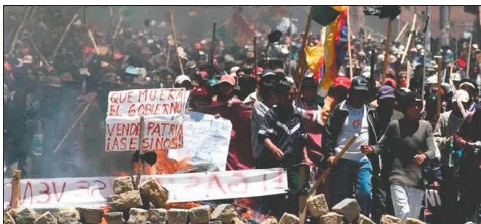
Revolución Boliviana en 2003

Sin embargo, existe otra cuestión que ha sido una verdadera escuela de marxismo revolucionario y que me llevó a alinearme definitivamente en la corriente en la que hoy milito, y es la política por poner en pie reagrupamientos revolucionarios internacionales de las fuerzas sanas del trotskismo en base al programa frente a los más candentes hechos de la lucha de clases mundial. Me hice parte de esta corriente porque desde su nacimiento, nuestra organización ha desarrollado esta pelea. Es que si hay algo que llamó mi atención para hacerme parte de esta corriente, es que se desvivía y se desvive por resolver la puesta en pie del Partido Mundial de la Revolución Socialista, la IV Internacional.