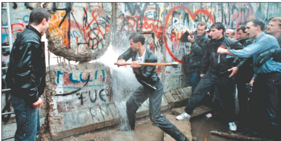
La caída del Muro de Berlín en 1989

Los compañeros me entregaban regularmente su prensa y las distintas publicaciones de férrea lucha política con-