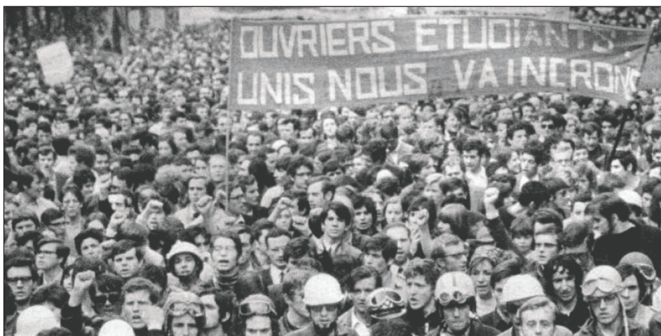
Mayo Francés en 1968

Cuando se agotó este ciclo de crecimiento económico, el imperialismo buscó pasar a la ofensiva en el mundo contra la clase obrera de Occidente e intentó restaurar el capitalismo en los estados obreros. El ascenso revolucionario del '68-'74 que se vivió en los países imperialistas, en el mundo colonial y semicolonial y también en los estados obreros con los procesos de revolución política que se dan en Checoslovaquia (la Primavera de Praga), en Ucrania y en Polonia, fue la respuesta de las masas a la ofensiva imperialista. El Mayo francés, el “Otoño caliente” italiano, la revolución de