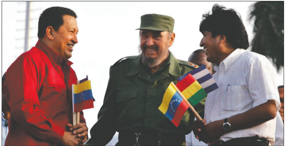
Hugo Chávez, Fidel Castro y Evo Morales