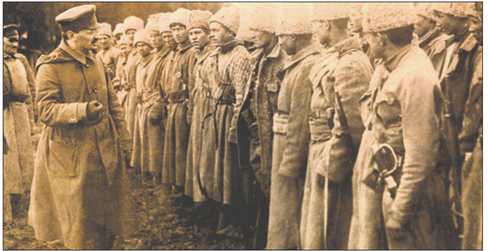
León Trotsky, fundador del Ejército Rojo y la IV Internacional

Este curso centrista de los “trotskistas”, de adaptaciones y capitulaciones, tuvo su máxima expresión en el '89 dando un salto de cantidad en calidad. Fue entonces cuando terminaron de “cruzar el Rubicón” y pasaron a ser enemigos de la revolución socialista, sostenedores del sistema capitalista imperialista. Pero esto no lo hizo el trotskismo, cuyo programa y estrategia pasaron la prueba de la lucha de clases. Esto no lo hizo la IV Internacional, sino el oportunismo que se apoderó de su dirección, que abandonó y revisó su programa, convirtiéndose así en un eslabón más de las cadenas que sometieron al proletariado a la burguesía.