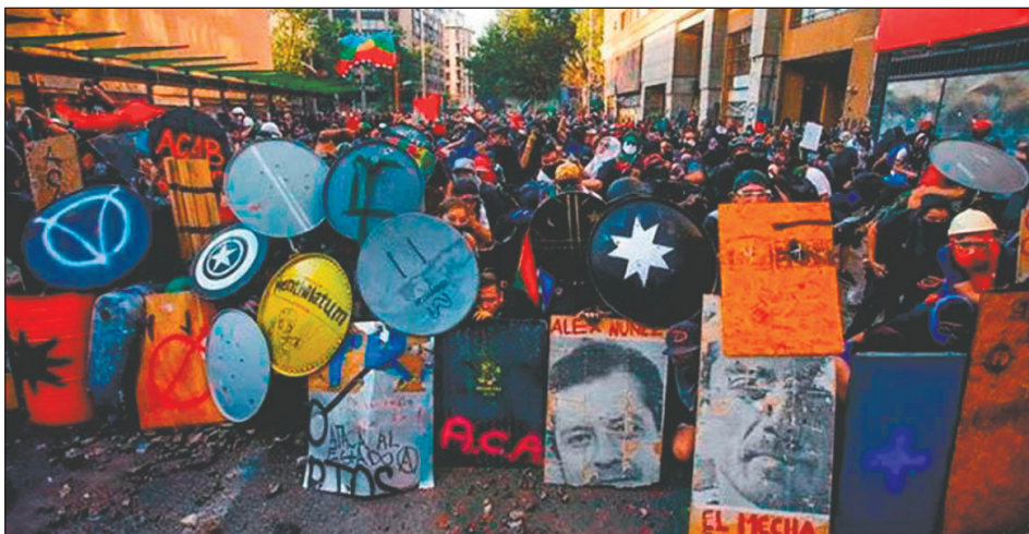
La juventud de la “primera línea” en Santiago

El objetivo de este trabajo intenta ser un aporte a esa nueva generación de la clase obrera y la juventud rebelde, para colaborar y ayudar a esta generación revolucionaria para que la tercera revolución chilena triunfe, como un eslabón de la revolución latinoamericana. Los trotskistas de la FLTI tenemos puestos todos nuestros esfuerzos en esta batalla por recuperar la IV Internacional y como parte de ella poder poner en pie la dirección revolucionaria que la clase obrera y los explotados necesitan para vencer, sacándose de encima al stalinismo y sus continuadores los renegados del trotskismo, para de una buena vez por todas echar abajo al maldito régimen pinochetista.