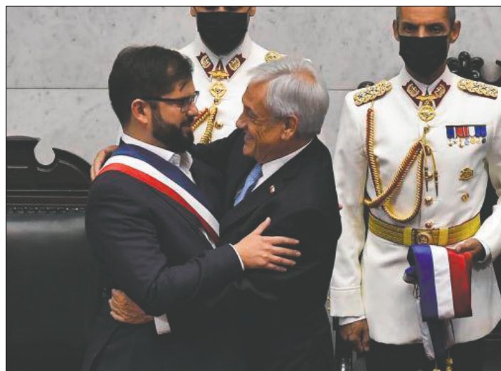
Marzo de 2022: Boric sucede a Piñera en la presidencia de Chile

Hoy, a 3 años del inicio de ese enorme combate revolucionario que conmovió Chile a partir del 18 de octubre de 2019, se demuestra con toda agudeza la vigencia de las lecciones que refleja el camarada Ramiro en este trabajo. Es que hoy más que nunca se trata de redoblar el combate contra las trampas que monta el imperialismo y la burguesía en todo el continente contra las luchas revolucionarias de masas, que son sostenidas por el stalinismo y también los renegados del trotskismo que no solo apoyan al gobierno de Boric,