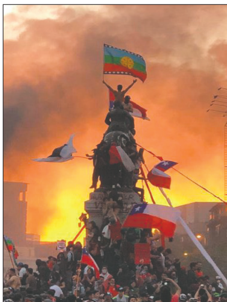
Plaza de la Dignidad en 2019

Los acontecimientos de octubre en Chile reflejaron también la crisis del capi-