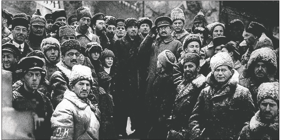
Lenin y Trotsky

Yo llegué al trotskismo en mi trayectoria de lucha por la revolución internacional, en duras batallas teóricas, en choques programáticos y en las luchas políticas entre las corrientes y direcciones de las distintas organizaciones obreras que integré. Después de triunfos y amargas derrotas de nuestra clase, de jalones revolucionarios y de traiciones del reformismo, comprendí la justeza del programa de la IV Internacional.