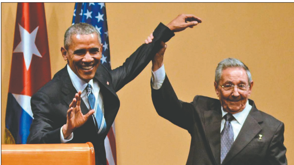
Marzo de 2016: Raúl Castro en Cuba junto a Obama, entonces presidente de EEUU