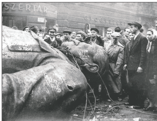
Revolución política en Hungría en 1956: los obreros derrumban la estatua de Stalin

En América Latina, los PC se encontraban sosteniendo a los gobiernos antiobreros y agentes directos de EEUU, como es el caso de la propia dictadura de Batista en Cuba. Por ello el triunfo de la revolución cubana provocó una enorme crisis en el stalinismo: encontró a los PC apoyando directamente a sus verdugos y por esto el enorme proceso de radicalización de ma-