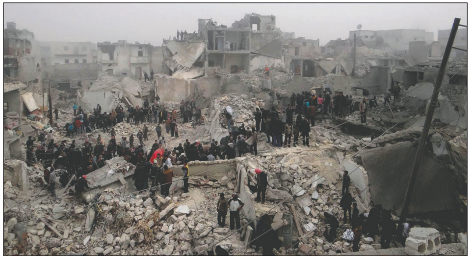
Masacre en Siria

Millones de explotados que huían de esta masacre en 2015, lograron llegar a Europa y romper el cerco de la revolución siria, demostrándole a las masas del mundo la cruda realidad. Pero ninguna de las organizaciones que en el “viejo continente” se hacen llamar “revolucionarias”, “socialistas” y hasta “trotskistas” acudió a la cita. ¿Quién de ellas llamó a movilizar a la clase obrera europea? ¿Quién dijo que la clase obrera del Magreb y Medio Oriente es una misma clase con el proletariado europeo y, por ello, también es una misma lucha? Las direcciones social-imperialistas hicieron la “vista gorda” ante la revolución y la contrarrevolución en Medio Oriente, ante sus 600 mil muertos y millones de desplazados. En su lugar, se dedicaron a sostener las políticas de bonapartización de los estados europeos después de los autoatentados en Francia, Bélgica, etc., diciendo que el “enemigo es el ISIS”. Esa fue la excusa perfecta que han encontrado para dejar que Al-Assad, comandado por todas las potencias imperialistas, continúe masacrando a los explotados.