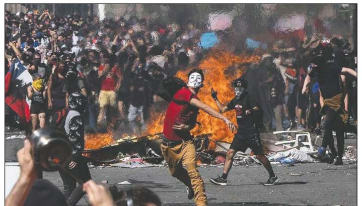
Combate revolucionario de masas en Chile en 2019