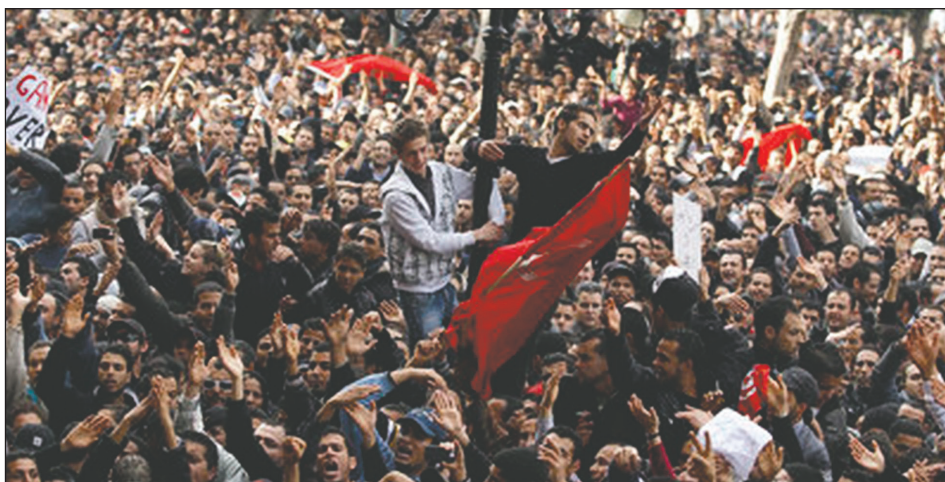
Revolución en Túnez en 2011

Aquel fue un momento de inflexión. Reforma o revolución seleccionan las filas de los revolucionarios. Mientras establecíamos relaciones con lo más avanzado de la vanguardia revolucionaria de Libia, con jóvenes internacionalistas, obreros y obreras revolucionarios que empuñaron las armas para derrocar a Khadafi, la WIVL de Sudáfrica levantaba posiciones liquidacionistas. Con un sectarismo y obrerismo desenfrenado renunciaron a la lucha por la alianza obrera y campesina -punto trascendental del programa para los sucesos que se estaban desarrollando en esa región- y terminaron a los pies de la burguesía khadafista. Por este punto y después de una