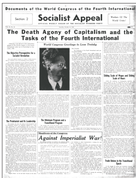
Facsímil del periódico Socialist Appeal (vocero del SWP de EEUU) publicando en 1938 el Programa de Transición de fundación de la IV Internacional

Para comprender la importancia de la tarea estratégica de refundar la IV internacional, yo he tenido que atravesar un largo proceso de lucha de clases y de lucha de partidos. Este proceso no ha sido fácil, más bien fue muy difícil y muy complejo, como lo he relatado anteriormente en sus aspectos más fundamentales. Nada de ello fue una conquista personal ni individual, sino que es conquista de la corriente en la que actualmente milito que desde su ruptura