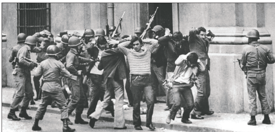
Represión del ejército genocida durante la dictadura de Pinochet

Durante los primeros años de la dictadura de Pinochet, la política de "apertrechamiento militar" fue la más importante del MIR. Pero no fue una política revoluciona-