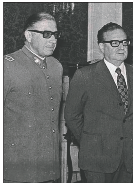
Allende y Pinochet tras la formación del Gabinete de Seguridad Nacional

Es decir, el imperialismo y la burguesía se prepararon antes de decidirse a lanzar el zarpazo. La UP les preparó el camino. El desenlace fue el golpe sangriento del 11 de septiembre de 1973. Yo modestamente participé de toda esta lucha, hasta ese mismo día.