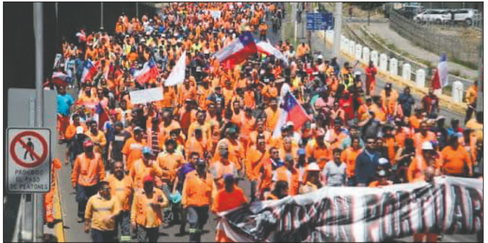
2019: paro portuario durante jornada de Huelga General Revolucionaria en Chile

Pudieron avanzar con la trampa del plebiscito con las burocracias sindicales de la Mesa de Unidad Social (en manos del PC y el Frente Amplio) separando a la clase obrera de los demás sectores que entraron al combate. Impidieron la huelga general revolucionaria y así sostuvieron a Piñera y permitieron que avance en la trampa de todos los partidos del régimen y la izquierda reformista, con los renegados del trotskismo también apoyándola, para sacar a las masas de las calles. Así venían desmovilizando y traicionando y llegó la pandemia que fue aprovechada por Piñera para sacar a los militares y seguir atacando al movimiento obrero y los explotados. Pero las masas no se han rendido. No está dicha la última palabra.