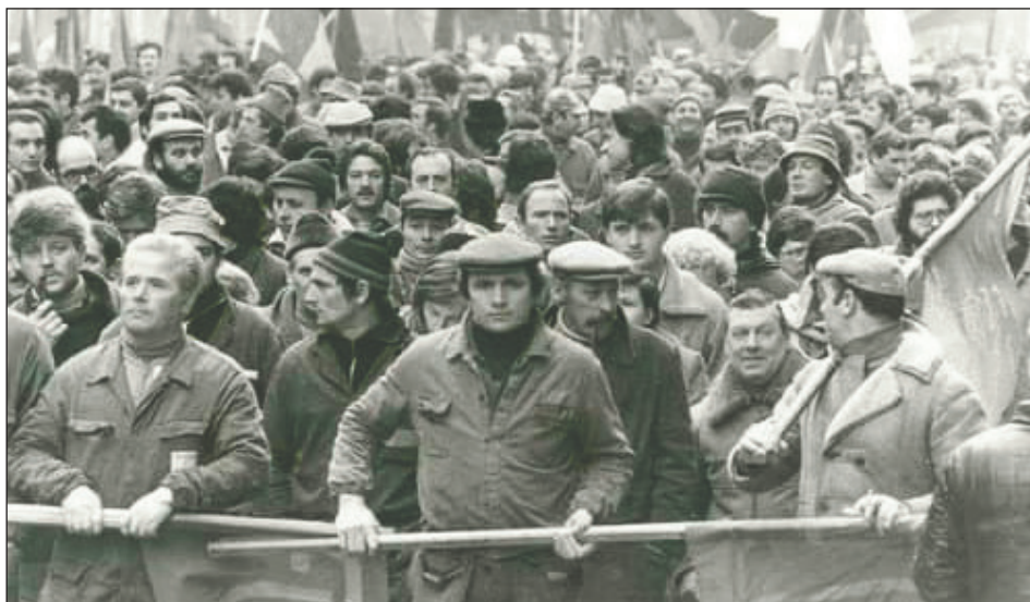
Manifestación de los obreros de los Cordones Industriales

Dentro de los Cordones Industriales no existía distinción de partidos ni de colores políticos. Los obreros éramos