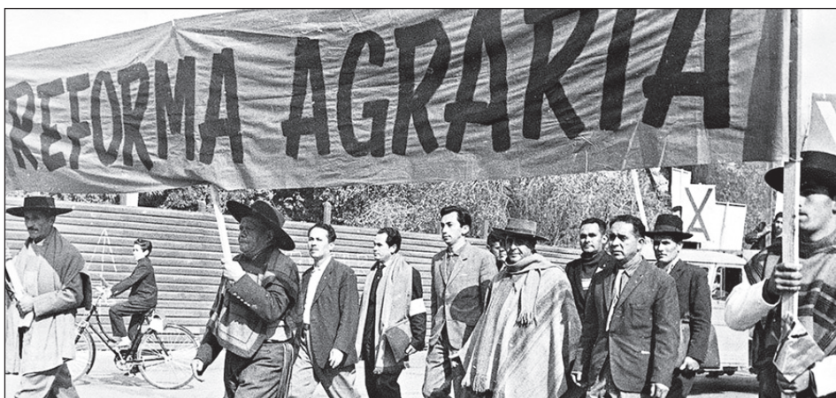
Movilización de obreros agrícolas en Chile en la década del '60

En ese contexto yo empecé a realizar un trabajo político más permanente y sistemático desde las filas del maoísmo. Mi papel consistía en hacer agitación y propaganda. Repartíamos volantes denunciando la súper-explotación de los trabajadores agrícolas. A su vez tomábamos contacto con los compañeros que recién comenzaban a interesarse por la organización sindical. No siempre resultaba bien. En una oportunidad, un campesino "amarillo" -así llamamos en Chile a los amigos del patrón y a los traidores-, nos entregó a la policía. Estuvimos presos una noche y un día en la comisaría y