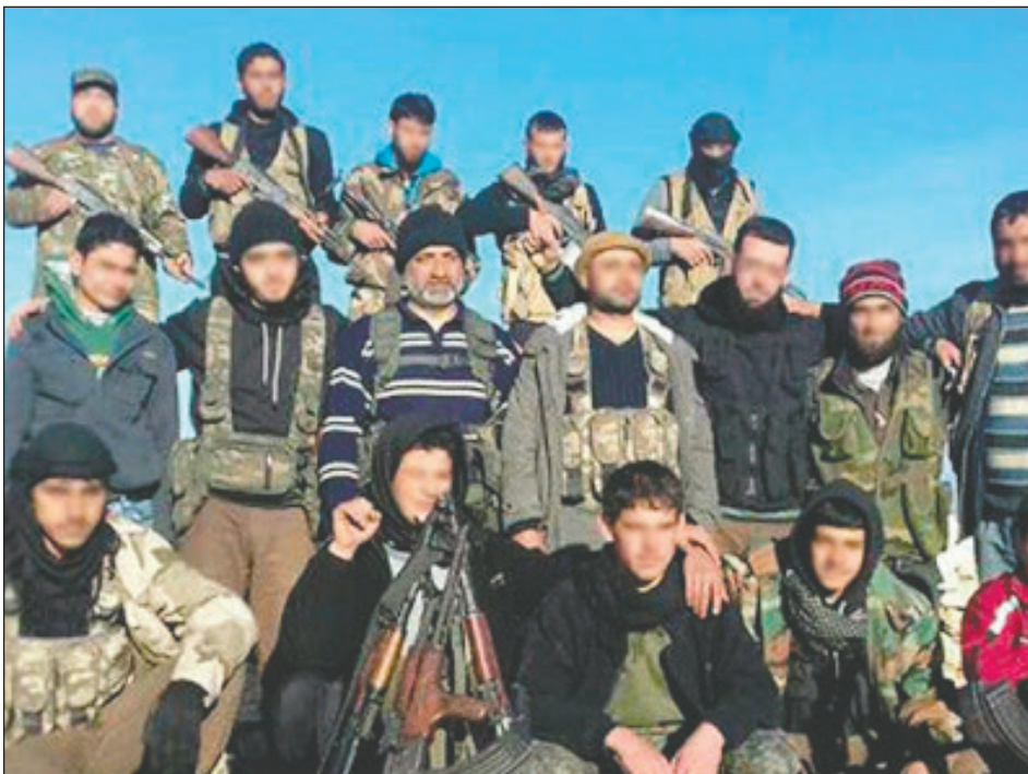
Brigada León Sedov de Siria

La tarea de todos los trotskistas internacionalistas del mundo es recuperar la IV Internacional para refundarla, para que la clase obrera tenga una dirección revolucionaria mundial que la conduzca a la toma del poder, para impedir las catástrofes que aún soporta el proletariado mundial y se profundizan día a día por la falta de una dirección internacional. La crisis de dirección es lo que ha impedido el triunfo de la revolución, de la toma del poder y su coordinación y centralización internacional, y ello lo paga el proletariado con guerras, masacres y penurias inauditas. En este combate apasionante por dotar a la clase obrera de la dirección que se merece me he alistado hace 14 años y por él, seguiré luchando hasta el último día de mi vida.