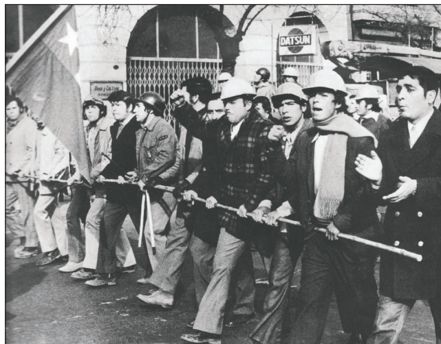
Los obreros de los heroicos Cordones Industriales

En Chile se aplicó la política de "vía pacífica al socialismo" como parte de la política de "coexistencia pacífica" del stalinismo. El castrismo obviamente fue su principal abanderado y el encargado de garantizar la aplicación de esta política. Por ello, bajo su programa de impedir el triunfo de "nuevas Cuba", es que vino Fidel Castro en persona a Chile. Usurpando la enorme autoridad y prestigio del combate de las masas cubanas, se dedicó a pregonar la "vía pacífica al socialismo" con el gobierno burgués de Allende, el PS y el PC, para impedir el triunfo de la revolución.