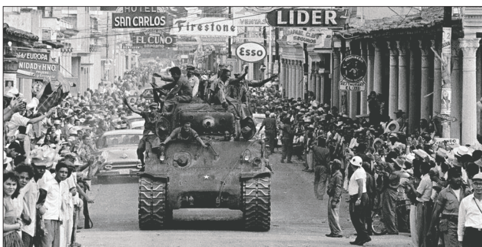
Triunfo de la revolución cubana en 1959

cias de los patrones las padecí en carne propia cuando empecé a trabajar en el campo y caló más profundo en mí la magra situación de los trabajadores. Entonces comprendí, todavía de forma instintiva pero clara, que el patrón no era un amigo. Yo sufría los golpes del capital y empezaba a ver que era esa clase la que me sometía a esas terribles condiciones. Más tarde comprendería que el burgués era nuestro enemigo y que nuestros intereses son irreconciliables.