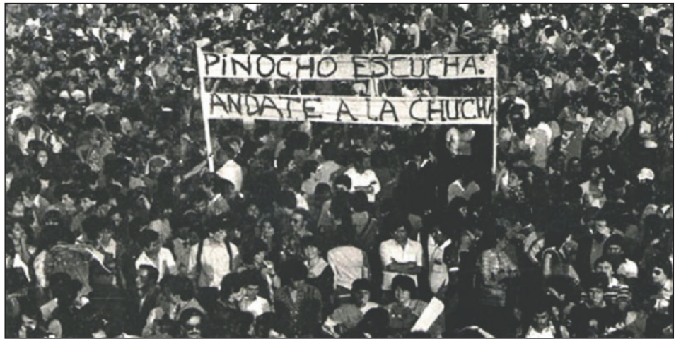
Jornada de lucha contra la dictadura de Pinochet

Mientras tanto, el PC se encargó de dividir las filas obreras, con su "ala izquier-