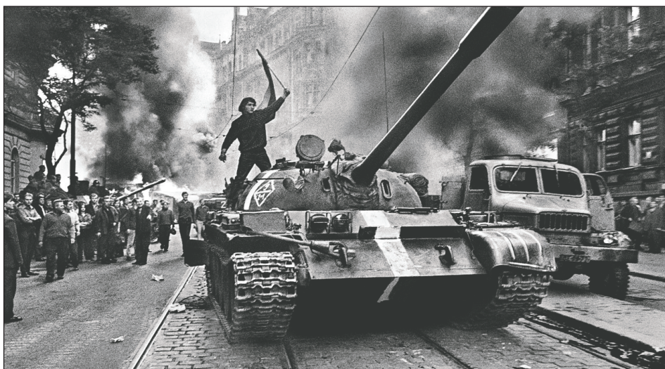
El Ejército Rojo invade Checoslovaquia para aplastar la revolución política (1968)

Por ello el rol del castrismo fue decisivo y determinante para estrangular este ascenso revolucionario generalizado. Fidel Castro y el "Che" Guevara fueron las grandes figuras de masas en Europa y la burocracia de Moscú supo muy bien cómo utilizarlos para abortar los procesos revolucionarios. Mientras tanto, el castrismo impedía el triunfo de las revoluciones en África y apoyaba las masacres del Ejército Rojo como contra la "Primavera de Praga".