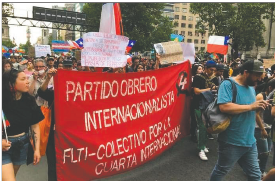
Bandera del POI-CI en la movilización por La Alameda el 25/10/2019, durante la sublevación revolucionaria de masas

Allí conoció a distintos grupos que se reclamaban del trotskismo en el exterior. Militó un tiempo en la Liga Comunista mandelista y luego terminó entrando a militar a la LIT. Al regresar a Chile, tiempo después se unió al PTS. Al calor de la revolución Argentina, Palestina y Boliviana, rompió con el PTS y finalmente en el año 2003 comenzó a combatir en nuestras filas, orgulloso de haber entrado en lo que él siempre definía como "trotskismo principista". El camarada pasó décadas buscando un camino revolucionario, una organización revolucionaria. Peleó por sus convicciones como lo hace un revolucionario intachable, aunque se equivoque. Cuando se convenció del programa de la IV Internacional de 1938 y de la necesidad de conquistar una dirección revolucionaria internacional para derrotar a las direcciones traidoras, no dejó de pelear por ello ni por un segundo. "El trotskismo me salvó la vida", siempre nos decía. Porque para él haber encontrado un programa y una corriente revolucionaria por la cual dar la vida, era todo.