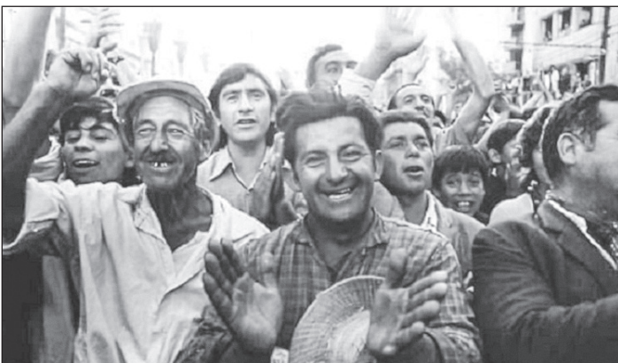
1970: los campesinos luchan por una verdadera reforma agraria

por responsabilidad de las corrientes reformistas y revisionistas en el marxismo y décadas de adaptación y postración de los ex-trotskistas al stalinismo