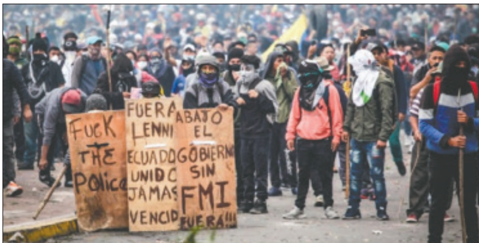
Sublevación revolucionaria en Ecuador en 2019

talismo. Las masas tuvieron que salir a las calles a luchar porque no les queda otra alternativa, porque no tienen... El imperialismo le tira a las masas toda su crisis y la respuesta de los trabajadores y los explotados fue ganar las calles porque ya la cesantía, el hambre, los problemas de vivienda, de salud, son insostenibles para la clase obrera. Entonces, tal como cuando yo me vinculé al trotskismo, existe hoy en día la misma situación. Hoy los trabajadores necesitan y está más vigente que nunca la pelea por la refundación de la IV Internacional.