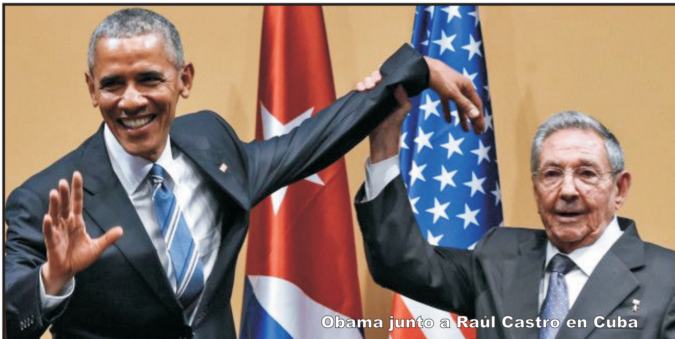
Obama junto a Raúl Castro en Cuba