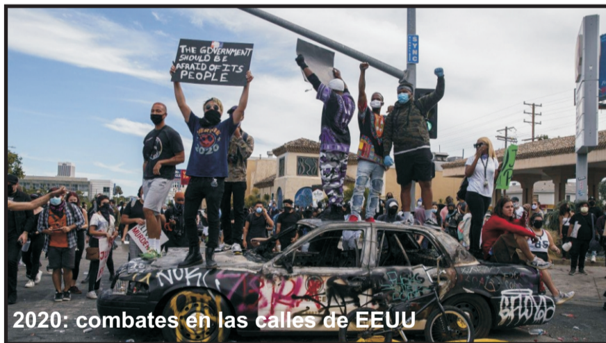
2020: combates en las calles de EEUU

¡Allí están los aliados de los explotados cubanos para impedir que se asiente la restauración capitalista!