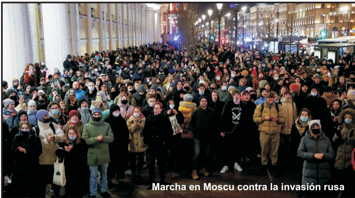
Marcha en Moscú contra la invasión rusa

Lo que impide una gran acción de la clase obrera de toda Europa, abrir los frentes en Rusia y en el Glacis europeo y que vuelva a ingresar el proletariado norteamericano para enfrentar a los piratas de Wall Street y de la OTAN, como hicieron contra Trump, son las direcciones social-imperialistas, las burocracias de los sindicatos y el stalinismo. La irrupción de la clase obrera europea es una cuestión de vida o muerte en primer lugar para la clase obrera ucraniana. Es que más y más la izquierda reformista, los sindicatos y organizaciones obreras del mundo que están bajo la dirección del stalinismo y el castrismo que entregó la revolución cubana, apoyan a Putin, su invasión y masacre en Ucrania, y más y más empujan a las masas ucranianas a las brasas ardientes del Maastricht imperialista y de la OTAN.