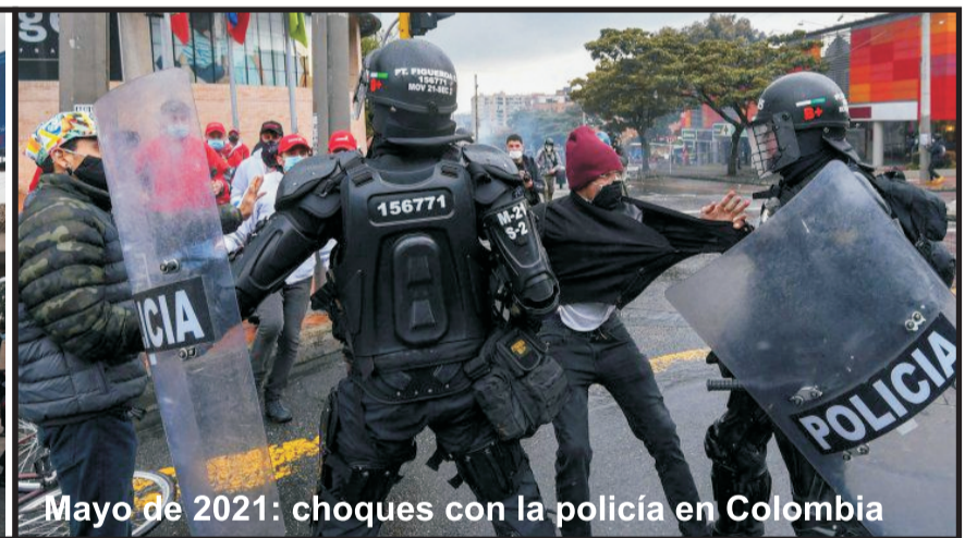
Mayo de 2021: choques con la policía en Colombia