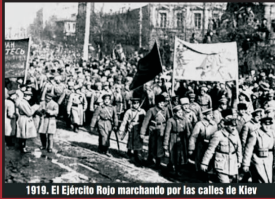
1919. El Ejército Rojo marchando por las calles de Kiev

Ucrania, desde 2014, es una nación partida, ocupada y colonizada por el imperialismo y su sicario Putin. Pero ahora es también una nación bombardeada e invadida.