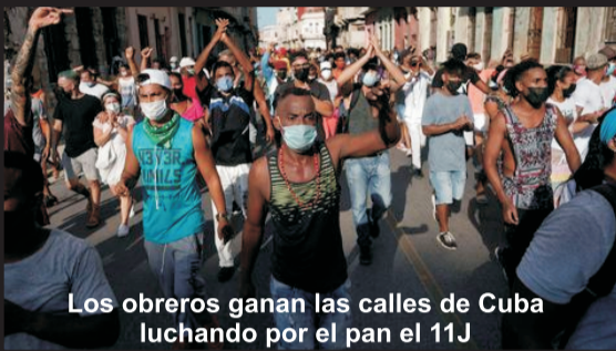
Los obreros ganan las calles de Cuba luchando por el pan el 11J

¡Abajo las condenas a los jóvenes y obreros juzgados por el 11J! ¡Absolución inmediata de todos los condenados! ¡Libertad incondicional a los más de 700 presos por luchar!