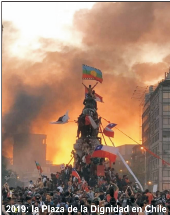
2019: la Plaza de la Dignidad en Chile

Para conquistar condiciones de vida y vivienda dignas, para recuperar la salud y la educación, hay que volver a expropiar a las transnacionales y a la nueva burguesía del PC. ¡Que los Castro, Díaz Canel, sus funcionarios y los generales empresarios