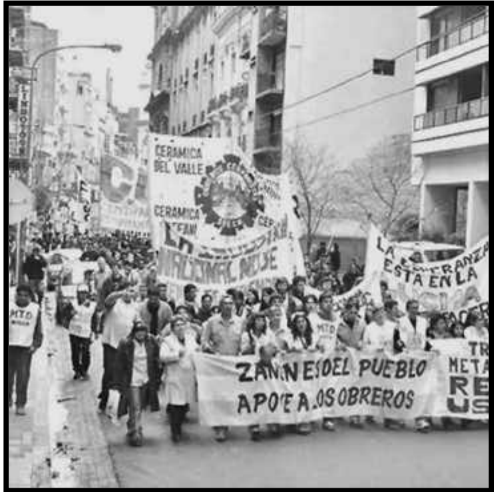
Movilización de fábricas recuperadas

La demanda mínima que puede conquistar una enorme solidaridad con los trabajadores del subterráneo no puede ser sólo que ellos quieren un plus de aguinaldo, que con justicia merecen, como todos los trabajadores argentinos. El camino para que reciban el apoyo de los usuarios, que son trabajadores, no puede ser otro que plantear que su lucha por el aguinaldo es parte de la lucha contra la carestía de la