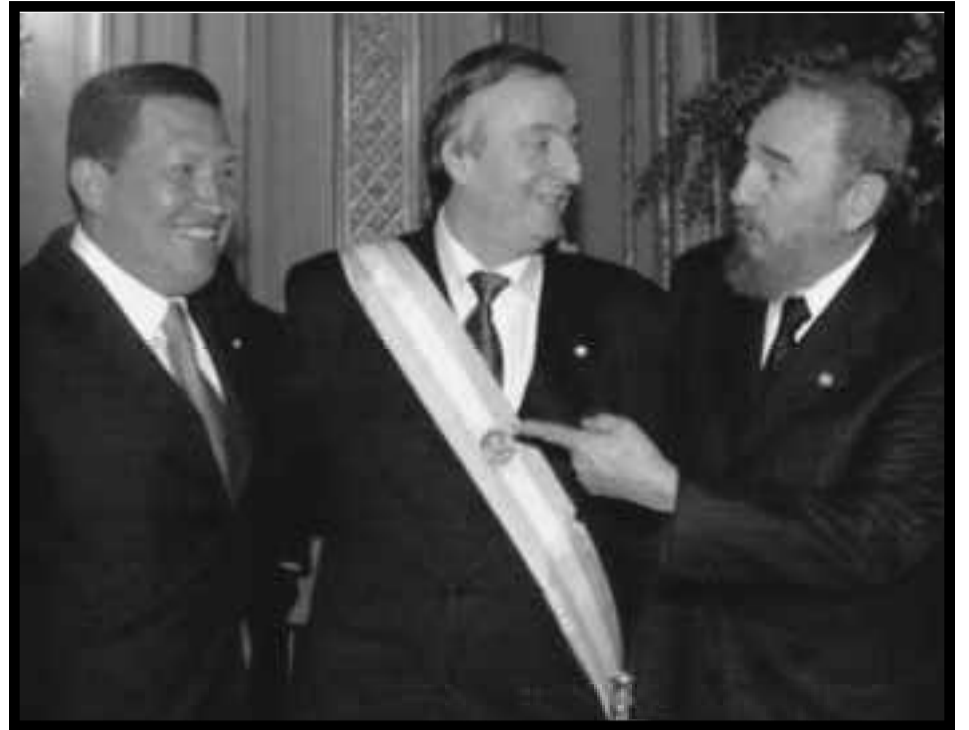
Chávez y Fidel Castro rodean a Kirchner en el día de su asunción presidencial

¡Basta de mentirle a los trabajadores! Fue esta izquierda reformista la que -cuando no quedó un solo movimiento piquetero cortando rutas, una sola huelga fuera del control del Ministerio de Trabajo y de los "sacrosantos" estatutos de los sindicatos estatizados, cuando los hambrientos que se tomaban los supermercados para comer terminaron como obreros esclavos y en negro trabajando por $800 al mes, como le sucede al 70% de la clase obrera argentina- se encargó muy bien de que nunca más truene la consigna de "¡que se vayan todos, que no quede ni uno solo!", ni mucho menos que se abra el camino revolucionario del 2001.