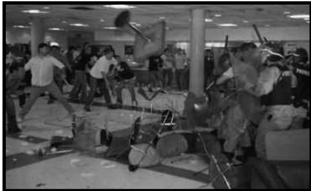
Matones de la burocracia del SOMU apoyados por la Prefectura atacan a trabajadores del Casino

Esto deja una gran enseñanza para la aguerida vanguardia obrera: con esta dirección -que está bajo la disciplina de Chávez, Morales, la Repsol, la Totalfina, los patronos "bolivarianos" como Techint, los ministros de trabajo como Tomada (comandante en jefe de los pistoleros de la burocracia sindical)- no se puede ya pelear ni triunfar. Un nuevo partido obrero revolucionario de la clase obrera merece ser puesto en pie, que luche por la única y verdadera revolución que saque de la prostración a los explotados que es la revolución obrera y socialista a nivel continental contra esa farsa de "revolución bolivariana" que lo único que ha hecho es que se fortalezca la reacción y se establezcan los gobiernos y regímenes cipayos de América Latina.