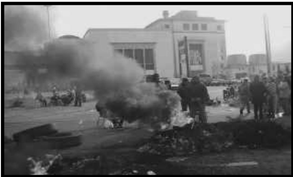
Piquete de obreros del SOIP en el Puerto de Mar del Plata

Que los dirigentes de los sindicatos VUELVAN A TRABAJAR DESPUÉS DE UN