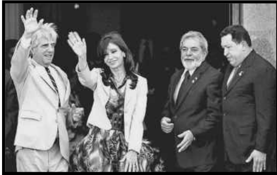
Cristina Kirchner junto a Chávez, Lula y Tabaré Vázquez en la última reunión del MERCOSUR

¡QUE SE VAYAN TODOS, QUE NO QUEDE NI UNO SOLO!