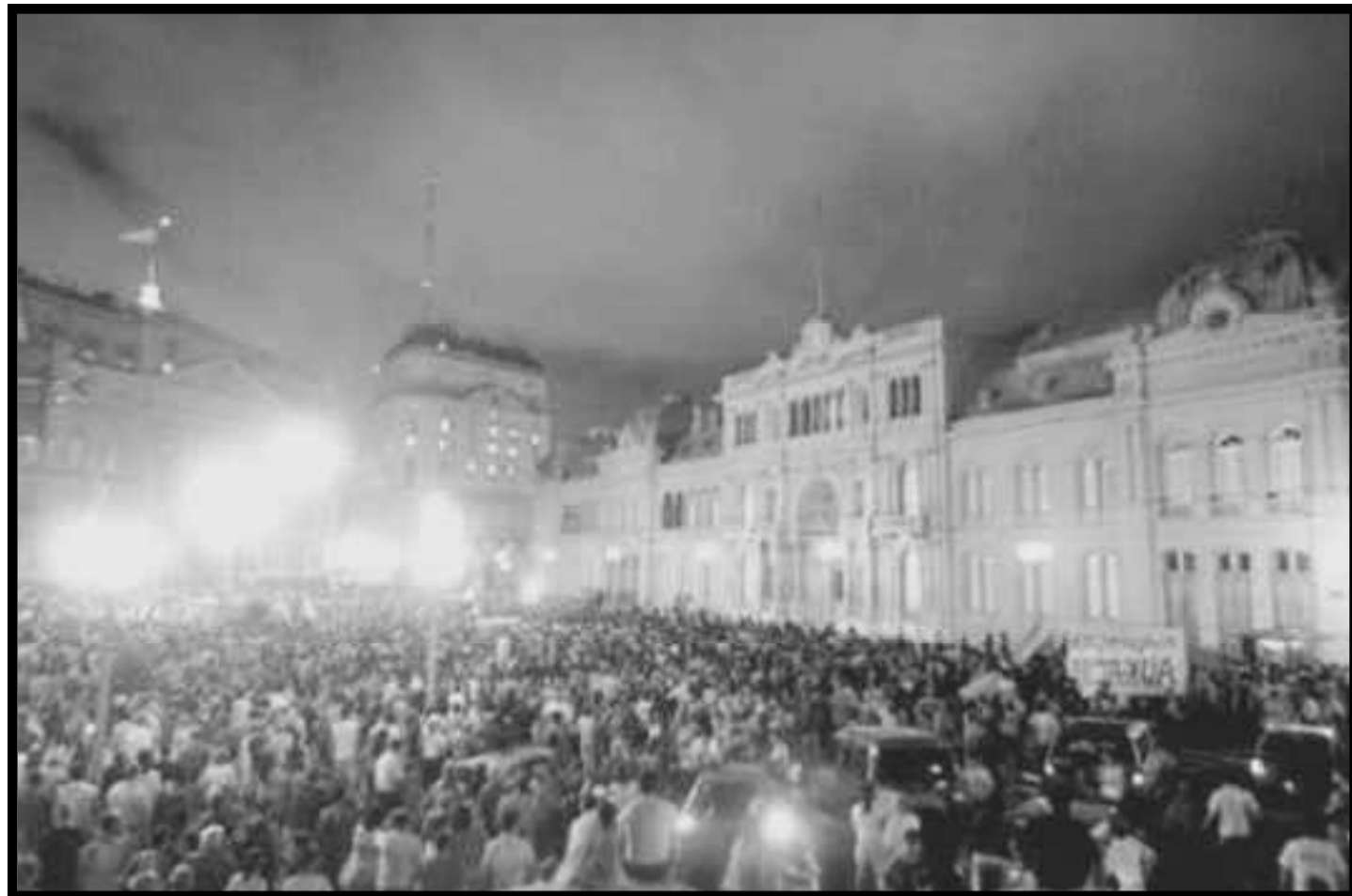
Cacerolazo en Plaza de Mayo el 19 de Diciembre de 2001

Hay que decir la verdad: fue esa pérfida política de llamar a confiar en los burgueses "progresistas" y "antiimperialistas", como Chávez, Morales, Lula y los Palacios o los Correa de Ecuador o los Kirchner, la que sacó a las masas de las calles. Organizaron "Contracumbres", como en Mar del Plata en octubre de 2005, bajo la disciplina del comandante Chávez, detrás del cual se encolumnaron todos los restos del stalinismo criollo y todos los renegados del trotskismo -que crítica o acriticamente lo apoyaron- para sostener al gobierno de los Kirchner. Fue Fidel Castro el que vino a decirles a las masas revolucionarias del 2001, en actos multitudinarios en Buenos Aires y en Córdoba, que había que producir, porque después el gobierno "patriota" y "antiimperialista" de Kirchner iba a "repartir la riqueza" una