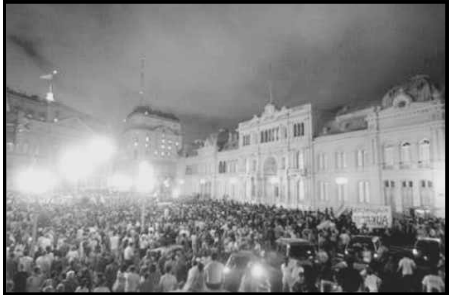
Cacerolazo en Plaza de Mayo el 19 de Diciembre de 2001

Hay que decir la verdad: fue esa pérfida política de llamar a confiar en los burgueses "progresistas" y "antiimperialistas", como Chávez, Morales, Lula y los Palacios o los Correa de Ecuador o los Kirchner, la que sacó a las masas de las calles. Organizaron "Contracumbres", como en Mar del Plata en octubre de 2005, bajo la disciplina del comandante Chávez, detrás del cual se encolumnaron todos los restos del stalinismo criollo y todos los renegados del trotskismo -que crítica o acriticamente lo apoyaron- para sostener al gobierno de los Kirchner. Fue Fidel Castro el que vino a decirles a las masas revolucionarias del 2001, en actos multitudinarios en Buenos Aires y en Córdoba, que había que producir, porque después el gobierno "patriota" y "antiimperialista" de Kirchner iba a "repartir la riqueza" una