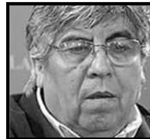
Moyano y Cri

Los revolucionarios estamos a favor de aprovechar todo fallo judicial o ley del Parlamento que sean favorables a los trabajadores, pero jamás fomentamos la más mínima ilusión en que serán los jueces patronales o la cueva de bandidos del Congreso los que resolverán las demandas de los trabajadores. Porque en todo caso, los fallos favorables solo vendrán como subproducto de las luchas heroicas, cuando los trabajadores le pongamos el pie en el pecho a los capitalistas.