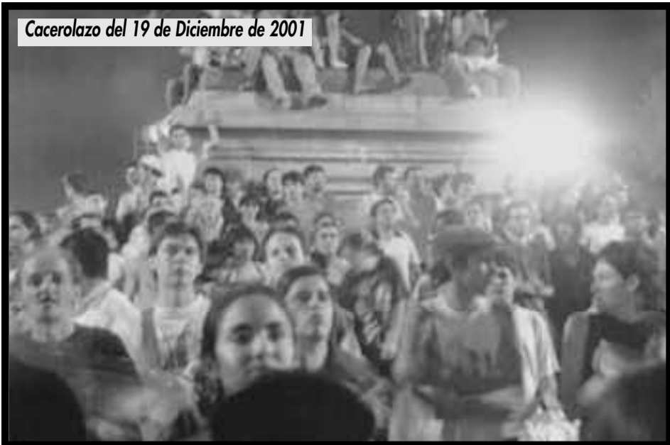
Cacerolazo del 19 de Diciembre de 2001