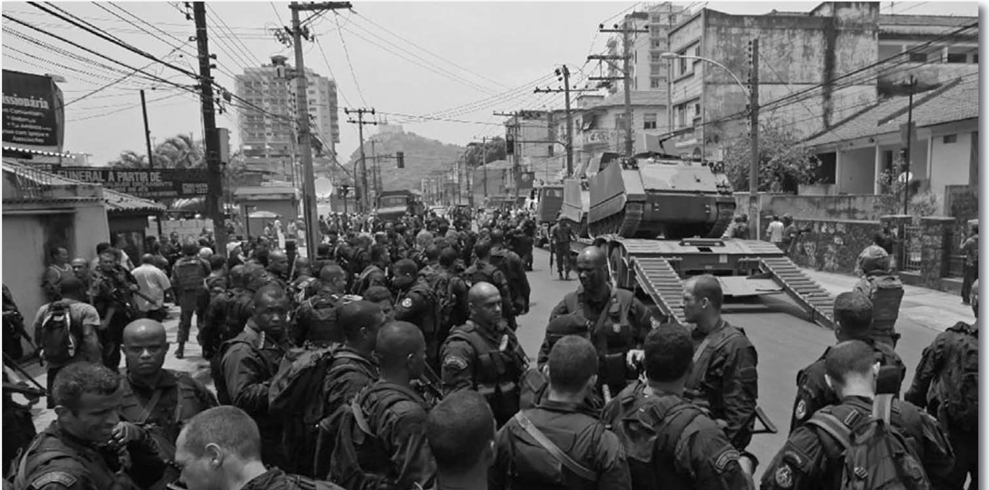
Desembarco de las tropas de ocupación del gobierno de Lula

Desde el día 22 de noviembre los morros y las favelas de Río de Janeiro sufren una ocupación militar por miembros de la policía civil, policía militar, ejército, marina y aeronáutica, lo que configura un verdadero estado de sitio sobre el sector más pobre y superexplotado del proletariado carioca.