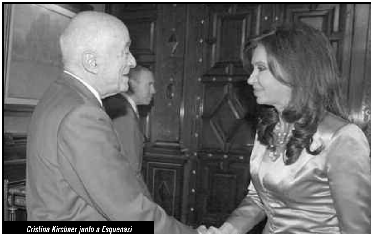
Cristina Kirchner junto a Esquenazi

Para este combate, los principales aliados del proletariado latinoamericano se han puesto de pie y son los obreros y jóvenes que en el corazón de la bestia imperialista yanqui cercan Wall Street, ese “1% de parásitos” al que hay que expropiar.