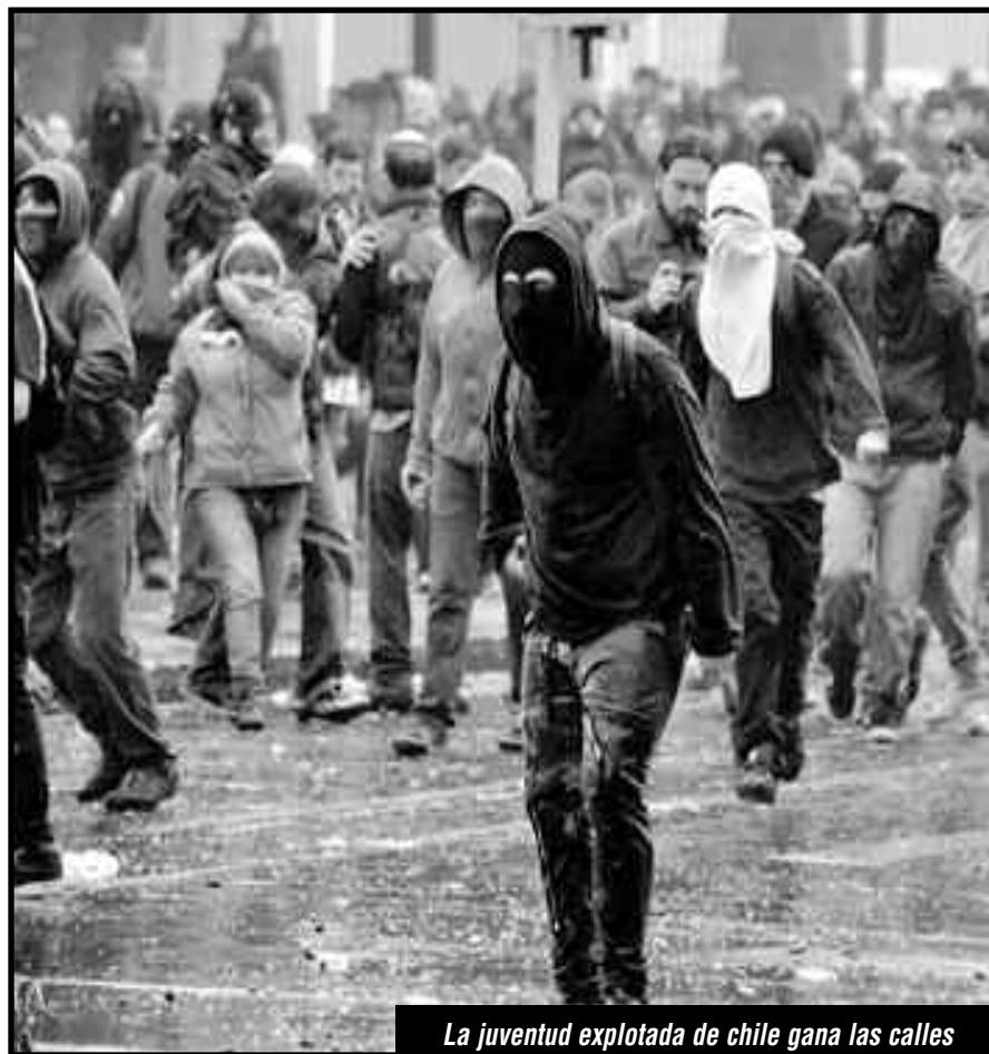
La juventud explotada de Chile gana las calles

pesinos, ni el pan a los obreros, y ha entregado todos los recursos naturales y riquezas a la voracidad de los imperialistas mientras avanzan en la restauración capitalista en Cuba, y someten a las organizaciones obreras y de los explotados al carniceo imperialista Obama y a las burguesías nativas. La única clase que puede romper con el imperialismo porque no tiene intereses que la aten a éste, es la clase obrera acaudillando a los oprimidos del continente para acabar con el domino imperialista. Como los estudiantes en el Mayo Francés que iban a buscar a la clase obrera para pelear juntos por la revolución, como lo hacen hoy los estudiantes chilenos, lo que unifica a las luchas estudiantiles y de la juventud del continente es la lucha por la Revolución Socialista. Para pelear por ella los jóvenes trotskistas de Democracia Obrera luchamos por refundar la IV Internacional para que la juventud revolucionaria del continente tenga la dirección que necesita y se merece. ¡Por la Revolución Socialista Mundial!