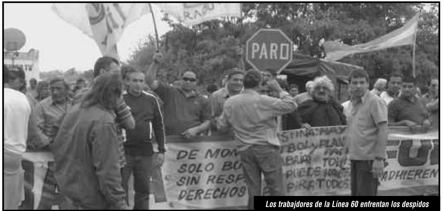
Los trabajadores de la Línea 60 enfrentan los despidos

Hoy a más de un mes de la heroica lucha que llevaron adelante los trabajadores de la Línea 60, hay cuatro compañeros despedidos, 11 trabajadores que deberían estar en tareas pasivas siguen trabajando como antes