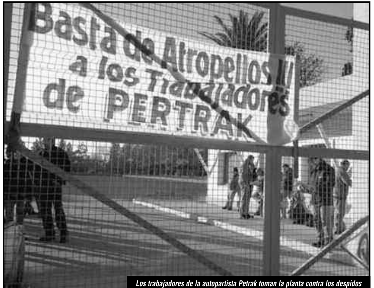
Los trabajadores de la autopartista Petrak toman la planta contra los despidos

Los trabajadores de la salud provincial y municipal vienen de meses de lucha por aumento de salario y mejoras en las condiciones laborales. Los trabajadores de Montich cortaron la ruta para enfrentar los despidos. Los trabajadores de la UTA, cuando la patronal se negó a pagar el aumento salarial, pararon todo el transporte durante tres días y desacataron la conciliación obligatoria, desconociendo así la "ilegalidad" decretada por el Ministerio de Trabajo. En la industria alimenticia los obreros de Arcor vienen luchando con paros y movilizaciones por aumento salarial a los que se suman hoy nuevamente los docentes provinciales y los municipales.