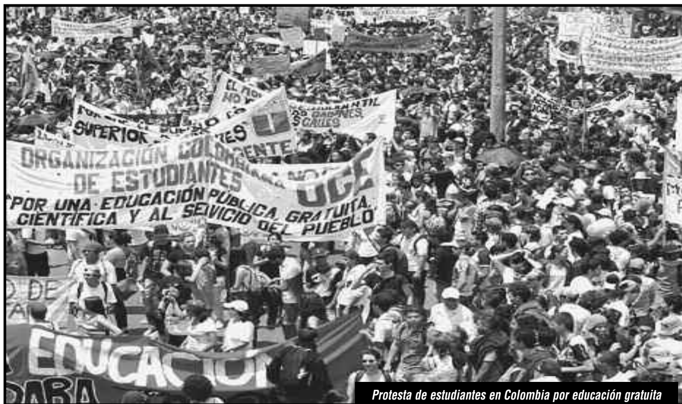
Protesta de estudiantes en Colombia por educación gratuita

PARA ACABAR CON LOS RECORTES PRESUPUESTARIOS, LOS ARANCELES, LA EDUCACIÓN ELITISTA EN LAS UNIVERSIDADES, LAS PASANTÍAS ESCLAVISTAS... como comienzan a hacerlo los estudiantes canadienses, colombianos y bolivianos, hay que generalizar a todo el continente la ejemplar lucha de la juventud chilena