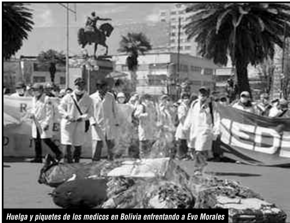
Huelga y piquetes de los médicos en Bolivia enfrentando a Evo Morales

“Renacionalización del cobre sin pago y bajo control de los obreros” y contra el gobierno pro imperialista de Piñera, para conquistar el salario y por una educación libre y gratuita. Que para avanzar en su combate han tenido que enfrentar a los “pacos de rojo” del PC que sostiene al gobierno de Piñera y su régimen pinochetista. Que, pese a al accionar de las direcciones reformistas de todo pelaje, se han movilizado en estos días, más de