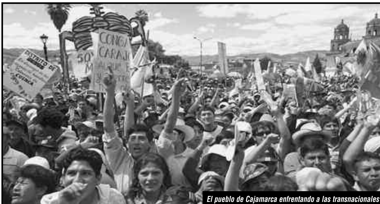
El pueblo de Cajamarca enfrentando a las transnacionales