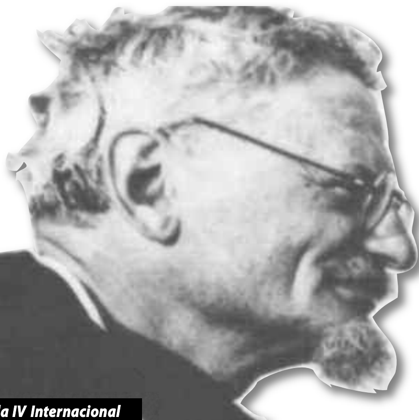
León Trotsky, fundador de la IV Internacional