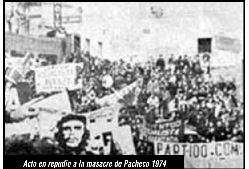
Acto en repudio a la masacre de Pacheco 1974

Así le abrieron el camino a la contrarrevolución. En México, en la ciudad de Tlatelolco, miles de estudiantes eran asesinados; en Chile el chagal Pinochet masacraba a lo mejor de la vanguardia revolucionaria. Esto permitió el avance de la contrarrevolución en Argentina, con Perón organizando las bandas fascistas de la Triple A, junto a López Rega y la burocracia sindical en el Ministerio de Acción Social, que se encargaban de perseguir y asesinar a los obreros y jóvenes revolucionarios; como a los compañeros del PST que fueron