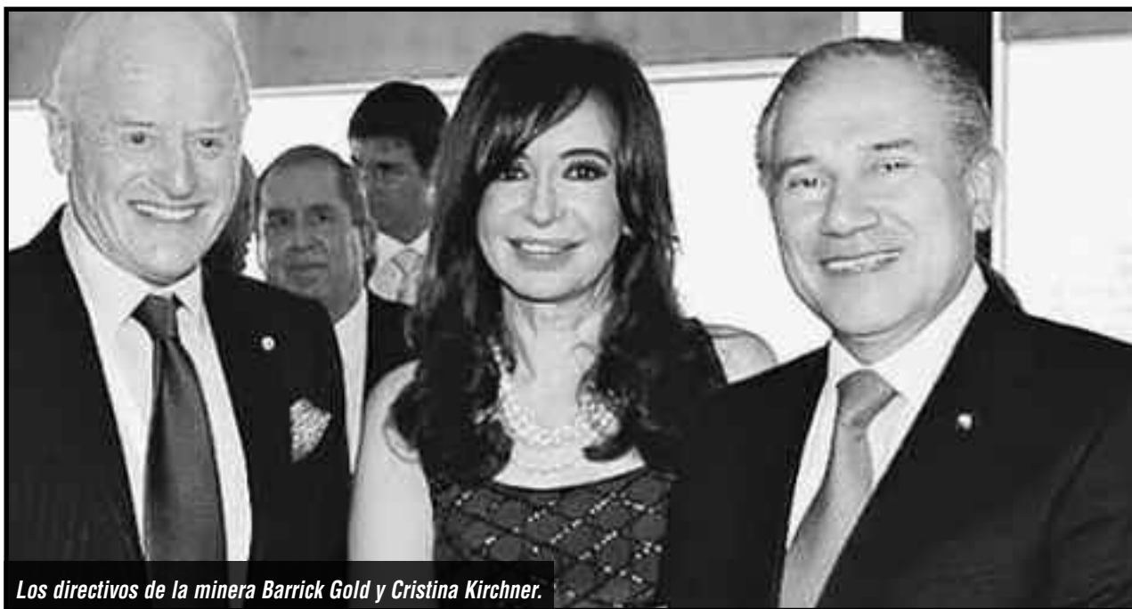
Los directivos de la minera Barrick Gold y Cristina Kirchner.

La Argentina de los Kirchner y las transnacionales: