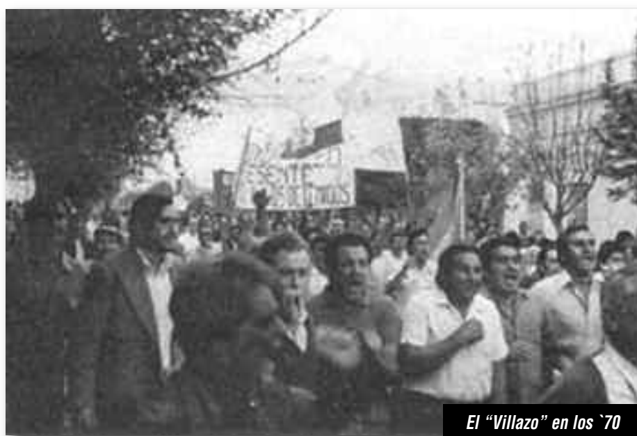
El "Villazo" en los '70

Esta actitud conciliadora con la podrida burocracia sindical que tienen los dirigentes de la "Verde y Negra", nada tiene que ver con la tradición del "Villazo" donde los obreros planteaban con absoluta claridad que: "Los trabajadores necesitan de la organización y la unidad, necesitan organismos representativos de los intereses de las bases para poder luchar (...) Esta lucha choca con