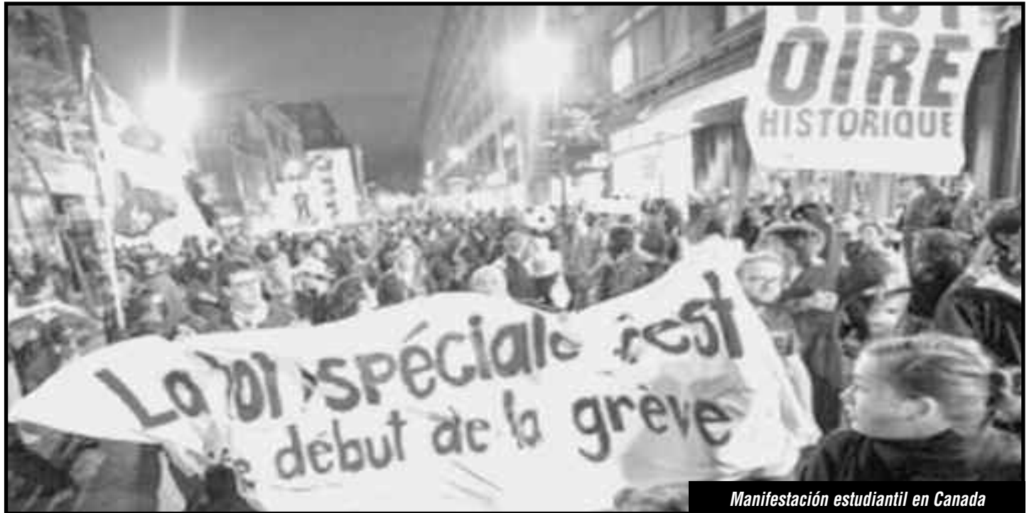
Manifestación estudiantil en Canada

Ford, Cargill, Bayer, Exxon, BH Billinton, la Banca Morgan, Kraft, etc., y demás monopolios imperialistas utilizan a las burguesías nativas -sus socios menores en la superexplotación y el