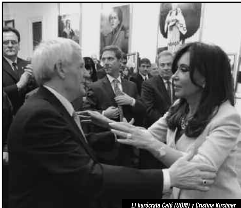
El burócrata Caló (UOM) y Cristina Kirchner