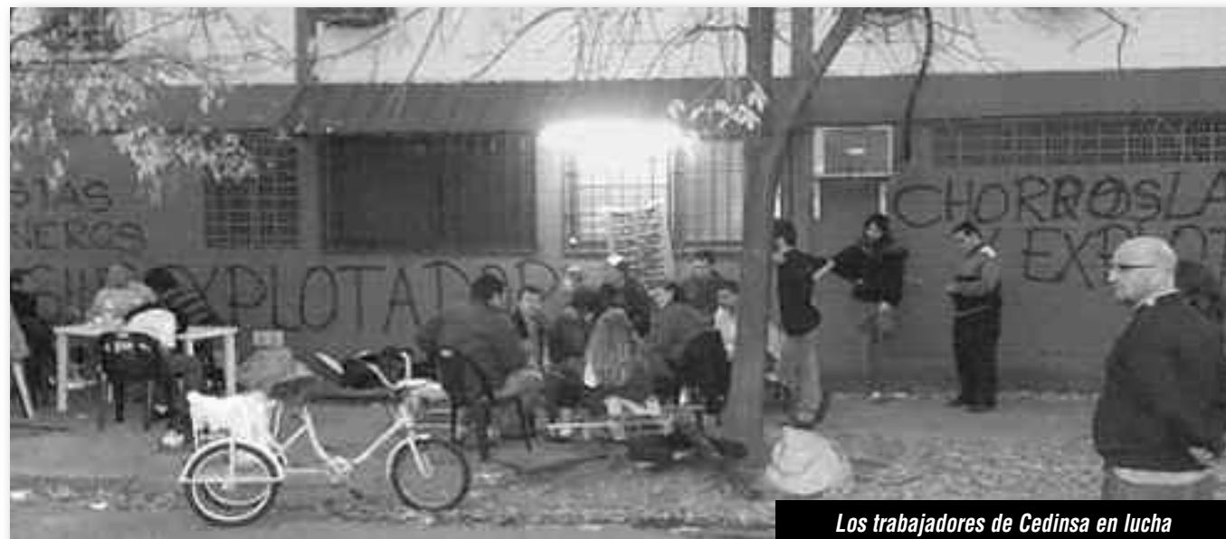
Los trabajadores de Cedinsa en lucha