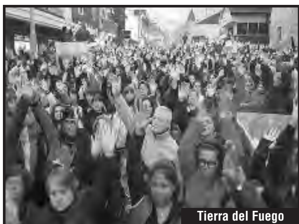
Tierra del Fuego