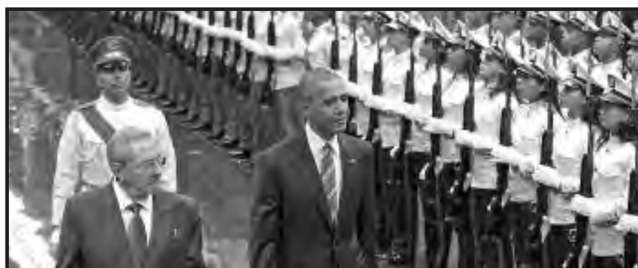
Raúl Castro y Obama en Cuba

El PO allí argumentaba: "El anuncio del restablecimiento de las relaciones entre Estados Unidos y Cuba, y el inicio de conversaciones para acabar con el bloqueo económico a la isla, constituye una victoria demorada e indudable de la Revolución Cubana" .