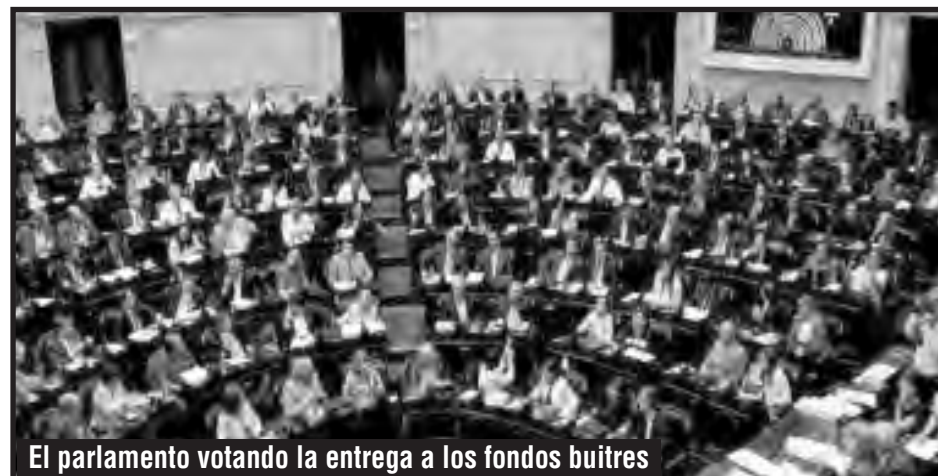
El parlamento votando la entrega a los fondos buitres

Desgraciadamente esa denuncia no fue acompañada del llamado a desarrollar una lucha extra parlamentaria de masas, convocando a la clase obrera a desarrollar su más amplia unidad poniendo en pie asambleas de base en los lugares de trabajo y