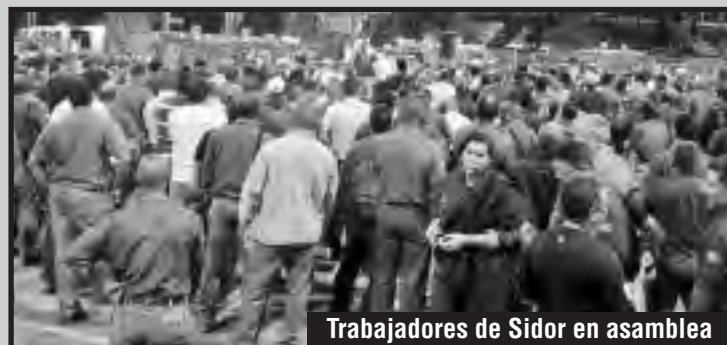
Trabajadores de Sidor en asamblea

en dicho país. Así actúa Maduro y las burguesías nativas cuando pierden el control de la clase obrera por parte de la burocracia sindical enquistada al frente de los sindicatos estatizados. Y así actuará cada vez que lo crea necesario y de forma sistemática si la situación lo amerita, es decir, si la lucha de los trabajadores de SIDOR se profundiza y se expande al conjunto del movimiento obrero venezolano. Y si esto no le fuese suficiente en aras de terminar con la lucha de los trabajadores, no dudará en seguir utilizando a las fuerzas represivas, como lo viene de hacer. No obstante el gobierno demuestra su carácter de clase implementando todas las medidas económicas antes mencionadas y con su represión, y hoy mismo viajó a