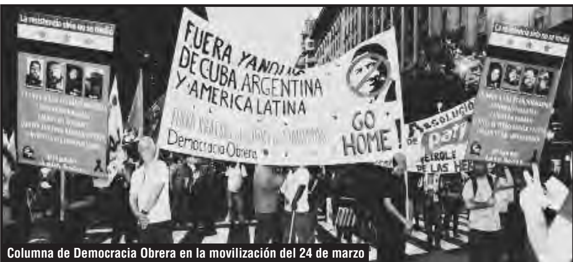
Columna de Democracia Obrera en la movilización del 24 de marzo