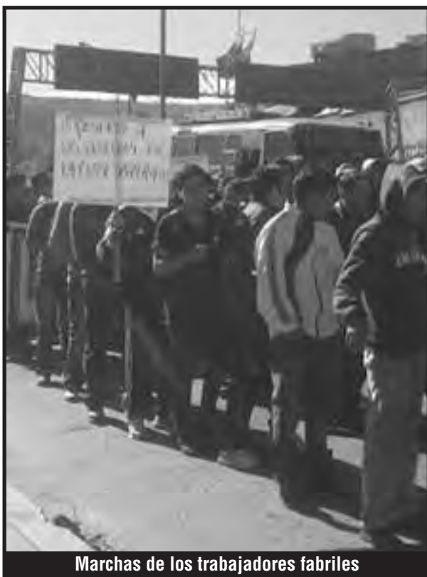
Marchas de los trabajadores fabriles

DE LA LIGA SOCIALISTA DE TRABAJADORES INTERNACIONALISTAS DE BOLIVIA