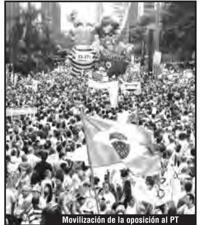
Movilización de la oposición al PT

tar trabajo para todos repartiendo las horas de trabajo entre todas las manos disponibles. Podremos conquistar infraestructura digna para salud, educación, caminos, hidroeléctricas y petroquímicas. Así estará al alcance de la mano la vivienda digna. ¡Salario mínimo vital y móvil de R$5.000 para todos ya!