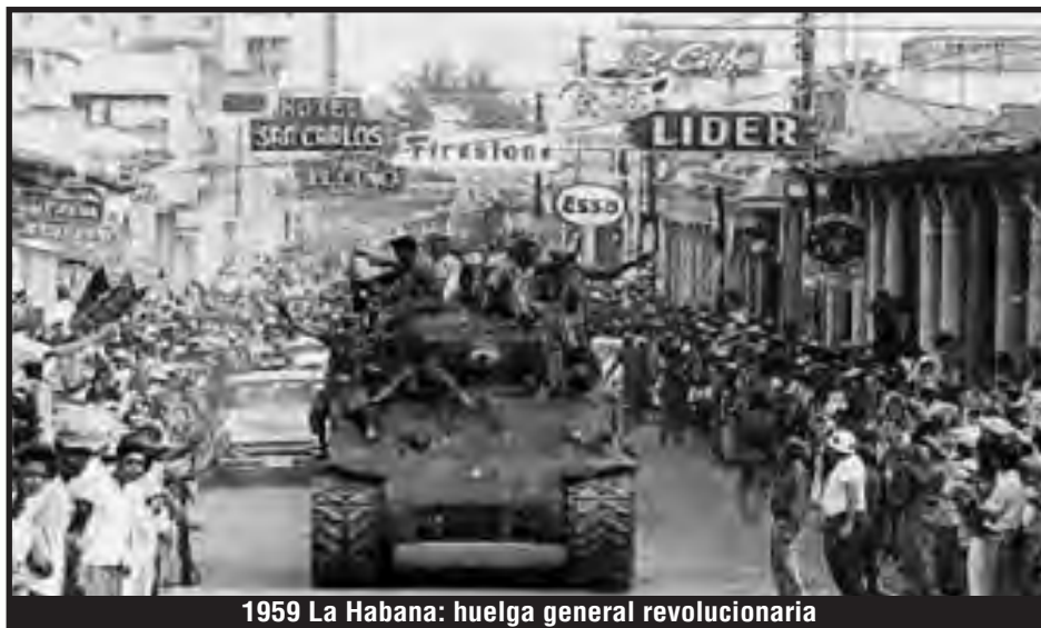
1959 La Habana: huelga general revolucionaria

Sin embargo, del brazo de Obama viajaron alrededor de 400 jefes de las transnacionales más importantes de los EEUU.