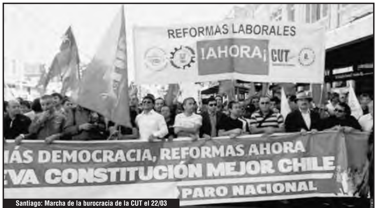
Santiago: Marcha de la burocracia de la CUT el 22/03

¡La "reforma laboral" de la Bachelet y el régimen cívico-militar, que apoya la burocracia de la CUT, es una ley pinochetista antihuelga y de explotación toyotista del movimiento obrero! Estamos ante una "reforma" del Código Laboral realizada a los moldes del Tratado del Transpacífico (TPP) y de las necesidades del imperialismo yanqui que está convirtiendo a todo nuestro continente en una verdadera maquila de obreros esclavos. ¡Qué vayan los burócratas de la CUT a trabajar