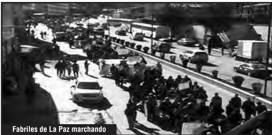
Fabriles de La Paz marchando

Trabajador de Polar: La justicia sabemos que en todo el país está incorrecta, hay una retardación de la justicia para los obreros, los obreros somos los que peor sufrimos, los asalariados, los mineros, los mineros están en malas condiciones... los dirigentes de los mineros se prestan a lado del estado, a lado del gobierno, están velando su interés político, automáticamente se han apegado en favor del gobierno, entonces por ese lado los trabajadores sentimos que no tenemos dirigentes, los dirigentes de la COB que han asumido la dirección siempre se han puesto al lado del gobierno avalando las políticas del estado.