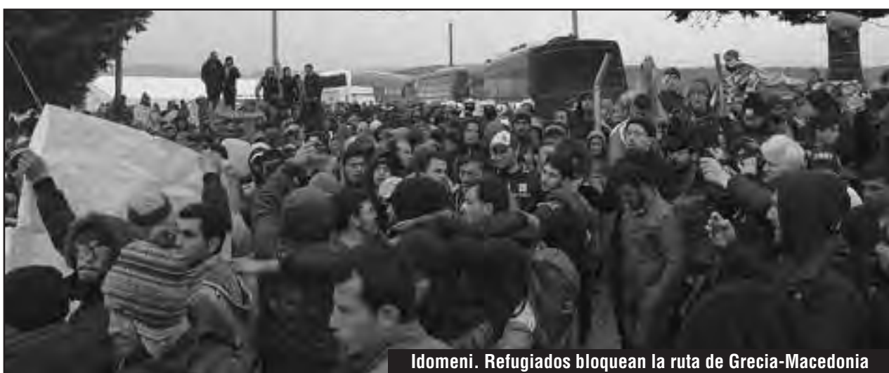
Idomeni. Refugiados bloquean la ruta de Grecia-Macedonia

Los refugiados que llegaron a Europa posterior-