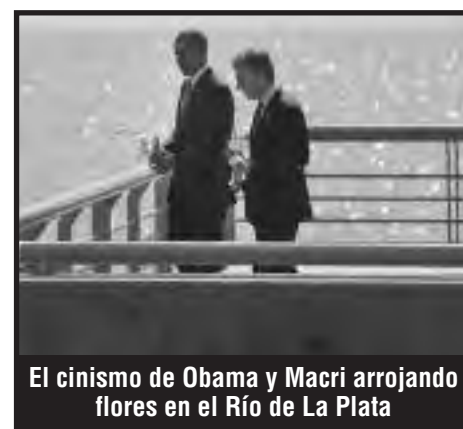
El cinismo de Obama y Macri arrojando flores en el Río de La Plata