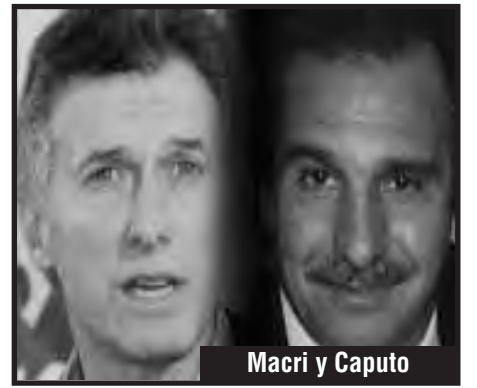
Macri y Caputo

En cada lucha por la demanda más mínima que saque a los explotados al combate, hay que decirles la verdad: que hay que luchar todos los días por una revolución socialista victoriosa. Hay que explicarles a los trabajadores que solamente luchando por todo, conseguiremos lo más mínimo, y que lo perderemos si no terminamos de arrinconar a este sistema capitalista, a sus