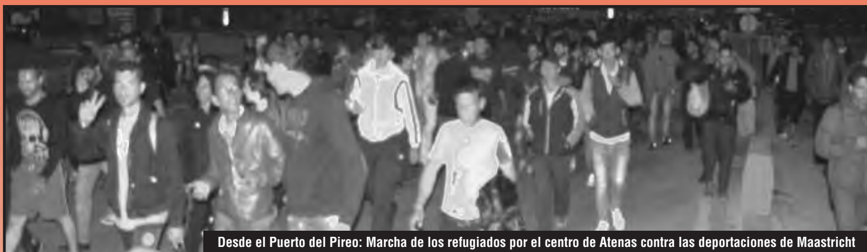
Desde el Puerto del Pireo: Marcha de los refugiados por el centro de Atenas contra las deportaciones de Maastricht

El gobierno griego de Syriza reprime y encarcela a los refugiados La juventud rebelde toma las calles en su defensa y conquista su libertad al grito de