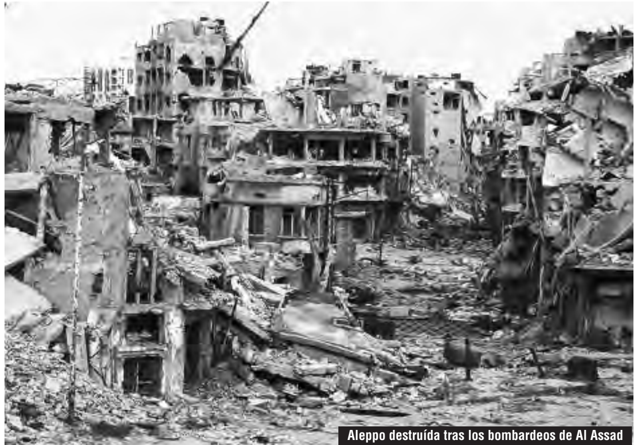
Aleppo destruída tras los bombardeos de Al Assad

Las potencias imperialistas tanto yankies como europeas, han encatrado "el enemigo perfecto" que les sirve para infundir miedo a su interior y así lo