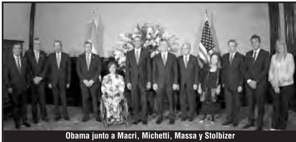
Obama junto a Macri, Michetti, Massa y Stolbizer

Lamentablemente la clase obrera no pudo derrotar esta política cipaya de la burguesía argentina. La burocracia sindical lo impidió. Y los diputados del FIT,