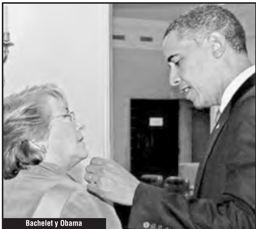
Bachelet y Obama

PARTIDO OBRERO INTERNACIONALISTA – CUARTA INTERNACIONAL ADHERENTE AL COLECTIVO POR LA REFUNDACIÓN DE LA IV INTERNACIONAL