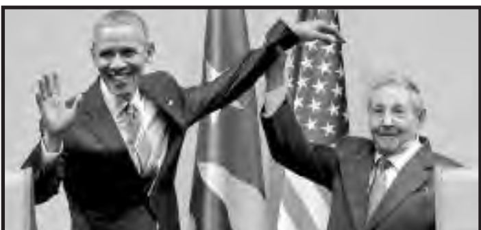
Raúl Castro dándole la bienvenida a Obama

En Argentina, los burócratas sindicales han asistido a la cena de gala ofrecida a la comitiva de Obama y los representantes de las trasnacionales que saquean el mundo y aquellas corrientes de izquierda como las que integran el FIT, que influyen a los sectores más combativos de la clase obrera, los explotados y la juventud se negaron a conquistar las condiciones para imponer un plan de lucha contra la llegada de Obama. Se limitaron a llamar a una movilización el día 23 a la embajada yanqui y sólo enviaron pequeñas delegaciones. Y el 24 de marzo, a 40 años del golpe militar videlista, realizaron una movilización y acto conmemorativo en la Plaza de Mayo, a los pies de una política de "frente democrático" en busca de políticos patrona-