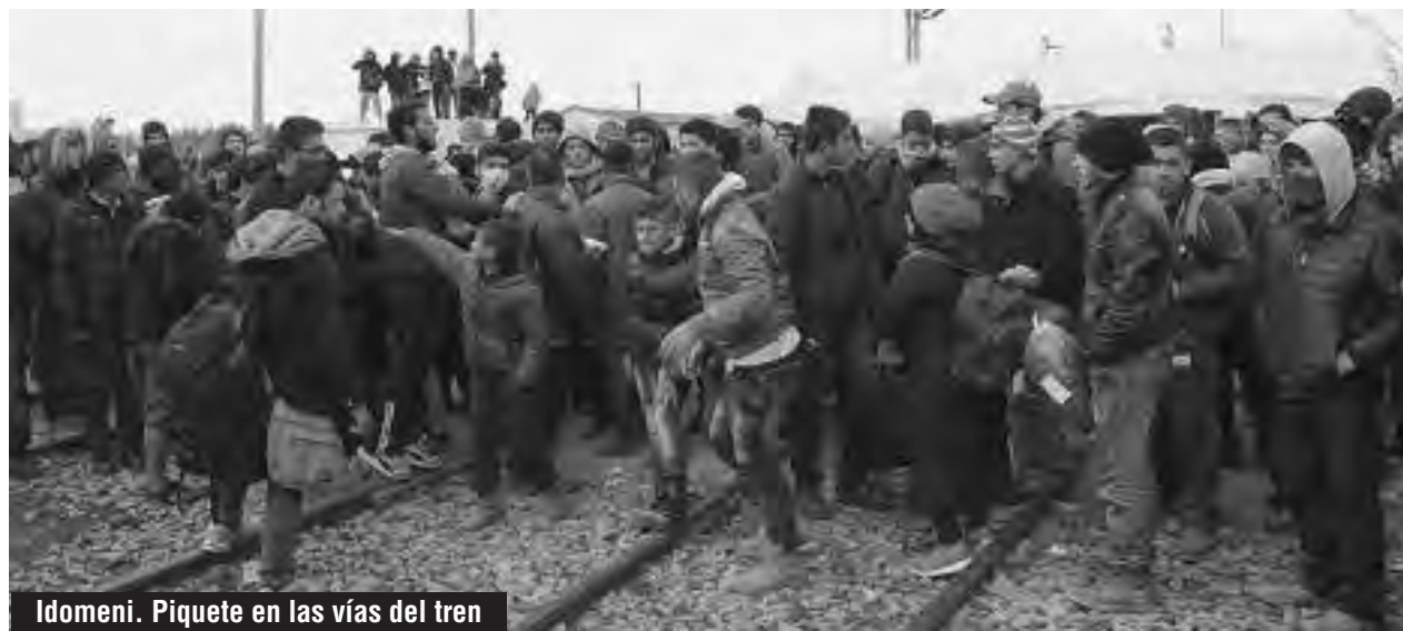
Idomeni. Piquete en las vías del tren

En esa zona fronteriza, en el campo de Idomeni, donde hoy se encuentran 14.000 refugiados, el gobierno también está llevando a cabo un plan de evacuación. Lo mismo está realizando en el puerto de Pireos en Atenas, donde 5.000 refugiados se encuentran ocupando varias terminales abandonadas y han montado carpas en el predio portuario. Syriza pretende llevar a quienes se encuentran ahí a distintos "campos de refugiados" bajo custodia militar, en donde estarán en las mismas condiciones que los campos de concentración de las islas griegas. Por ahora, la policía y el gobierno dicen que las puertas de dichos campos están abiertas para que los refugiados entren y