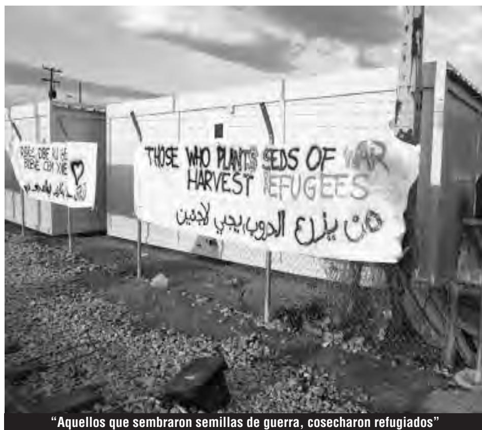
“Aquellos que sembraron semillas de guerra, cosecharon refugiados”

futuro de los refugiados en Grecia, y los explotados del Magreb y Medio Oriente está estrechamente ligado a las acciones de la clase obrera europea, que si no irrumpe de inmediato, sufrirá las mismas consecuencias que estos mismos parias, pues la UE y el