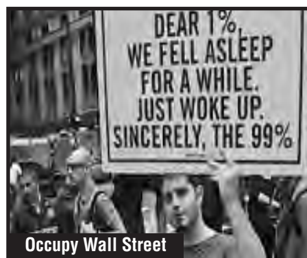
Occupy Wall Street

¿Se horrorizan por los vueltos de la Rosadita? Si el HSBC tocó una tecla "enter" de una computadora y limpió 12.000 millones de dólares de todo el dinero en negro de 2.000 parásitos de la City de Londres, Nueva York y Alemania en un día. El HSBC los blanqueó en sus cuentas. ¿Qué declaró la justicia norteamericana frente a esto? Que no se puede hacer nada, porque si no se caerían todos los bancos. Porque todos los grandes bancos son lavadores de dinero, estafadores