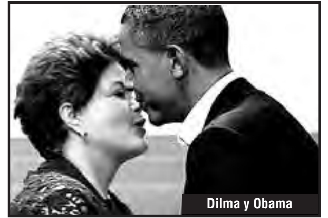
Dilma y Obama

Así conquistaremos un plan de obras públicas al servicio del pueblo brasileiro. Podremos conquis-