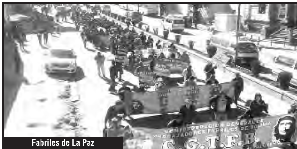
Fabriles de La Paz

En Huanuni, este proceso importante se fue cerrando bajo las diatribas del estatuto burocrático y las elecciones sindicales donde salió victoriosa la lista verde (Organización Revolucionaria de Obreros - ORO). No paso ni un día, a comienzos de la presente gestión, desde la asunción del nuevo sindicato de Huanuni - embellecido por el POR de "antioficialista" (Masas 2430, "XXXII congreso de la FSTMB")- y se entregó en cuerpo y alma al gobierno de las transnacionales de Morales, hasta el punto de entregarle a Morales 350.000