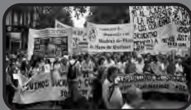
La bandera de la Red Internacional en la marcha a 40 años del golpe militar en Argentina

¡Por la destrucción del estado sionista-fascista de Israel!