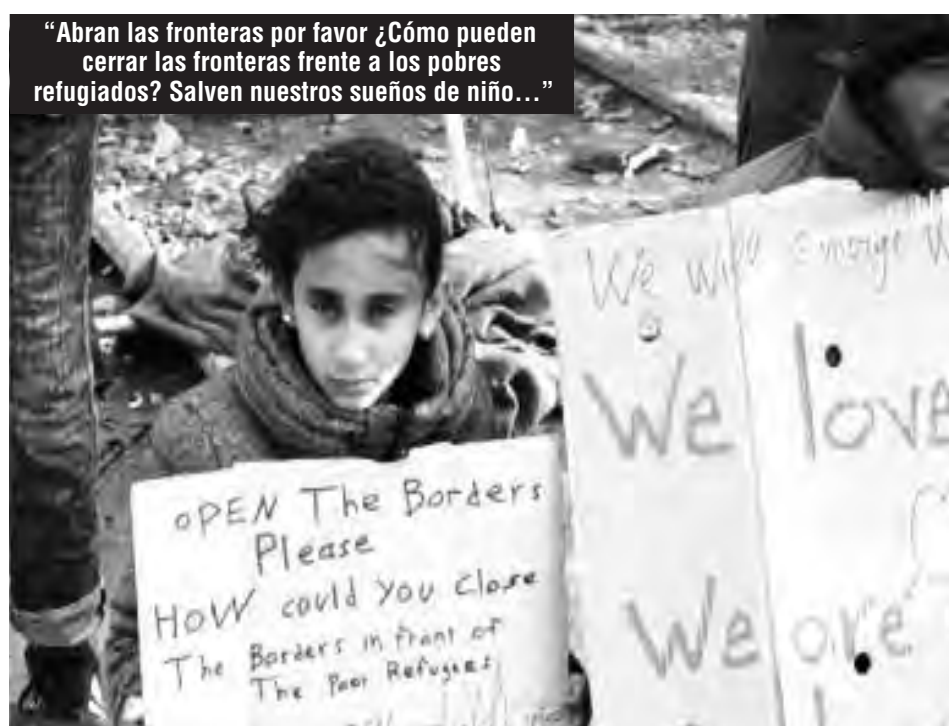
"Abran las fronteras por favor ¿Cómo pueden cerrar las fronteras frente a los pobres refugiados? Salven nuestros sueños de niño..."

A los dos días de este hecho los refugiados que estaban cortando las vías en Idomeni llamaron abiertamente a una asamblea para juntar fuerzas. La idea era ver qué cantidad de gente asistía a esta y considerar la alternativa de irrumpir en la frontera con una marcha de diez mil refugiados para poder abrirla y así continuar su camino, sabiendo que hay 14000 en todo el campamento y 6000 más en los alrededores. El llamado a asistir a esta asamblea estaba también