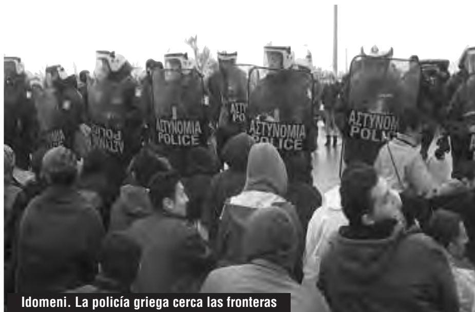
Idomeni. La policía griega cerca las fronteras

Con la voz entrecortada, en expresiones de desesperación, agitando sus brazos en el aire, ellos expresaron que escaparon de la guerra contrarrevolucionaria en Siria, donde sus casas fueron destruidas por las bombas de barriles de Bashar y sus vecinos asesinados por los bombardeos rusos de Putin. Tuvieron que irse de su hogar y dejar su tierra no porque hayan querido, sino porque ya no podían vivir bajo semejante masacre y destrucción. Pero incluso afirmaban que antes de la guerra, Siria, con salarios muy bajos, con pocas oportunidades de trabajo, con una creciente carestía de la vida y ninguna posibilidad de libertad de expresión ante una terrible dictadura totalitaria, se había convertido en un