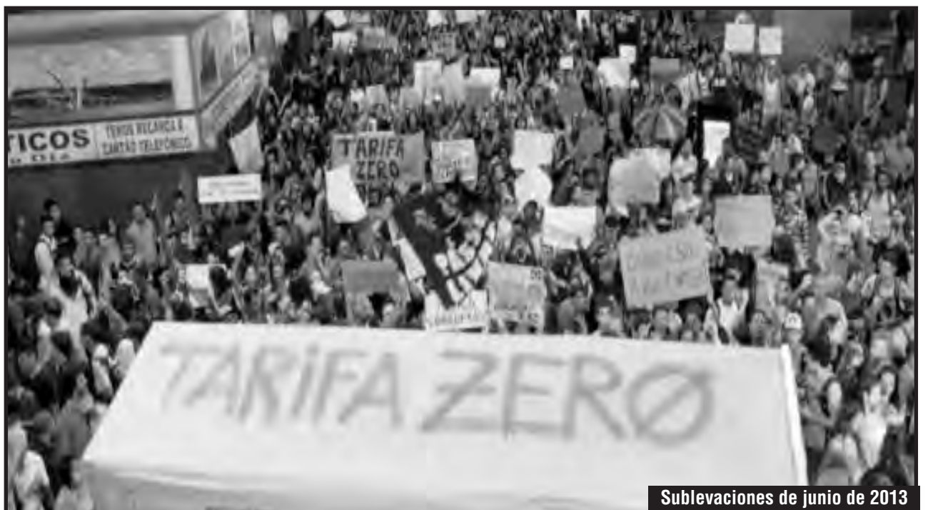
Sublevaciones de junio de 2013

Es que en última instancia es el imperialismo que quiere garantizar el pago de cada centavo de la deuda externa y de los miles de millones de dólares que entran en el país con la especulación financiera y poner al proletariado brasileiro a producir en condiciones de maquiladora peor que en China, con despidos en masa y tercerización generalizada, condición necesaria para que se invierta en infraestruc-