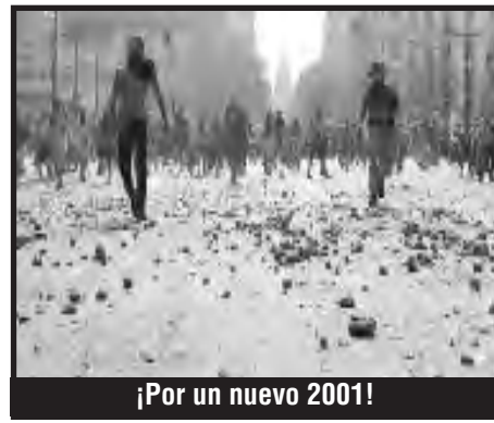
¡Por un nuevo 2001!

El control obrero consiste en aclarar cuáles son las ganancias y gastos de la sociedad en su conjunto. Permitiría desmascarar el robo de los capitalistas y a su vez demostrarle a la sociedad el derroche espantoso del trabajo humano, que no se emplea en la producción porque un puñado de parásitos se la pasa robándole al pueblo.