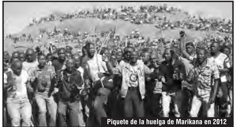
Piquete de la huelga de Marikana en 2012

Una Asamblea Nacional Constituyente libre y soberana que rompa con el imperialismo y recupere la tierra de las manos de las transnacionales para que los explotados coman dignamente.