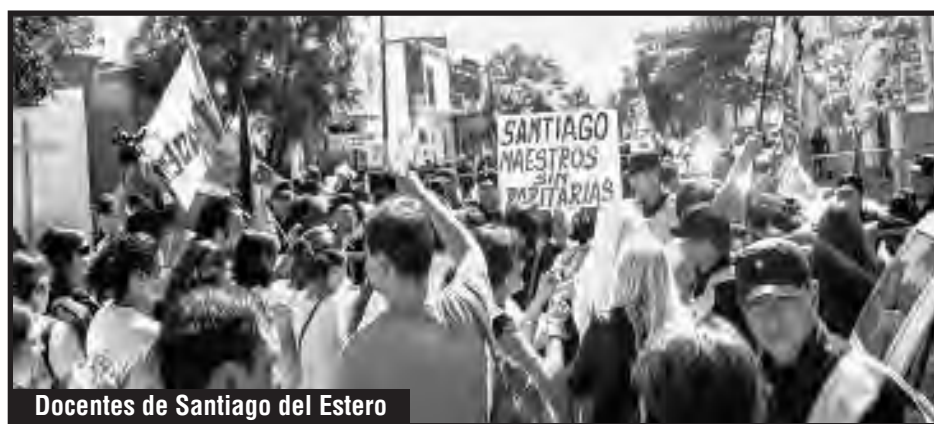
Docentes de Santiago del Estero

A esta pelea la están aislando, como a la de los docentes y estatales de Tierra del Fuego, que tienen docentes y camioneros condenados por la lucha del 2013, que junto a estatales y obreros industriales cortan Ruta 3, con asambleas por escuelas, acampes en la Legislatura y casa de