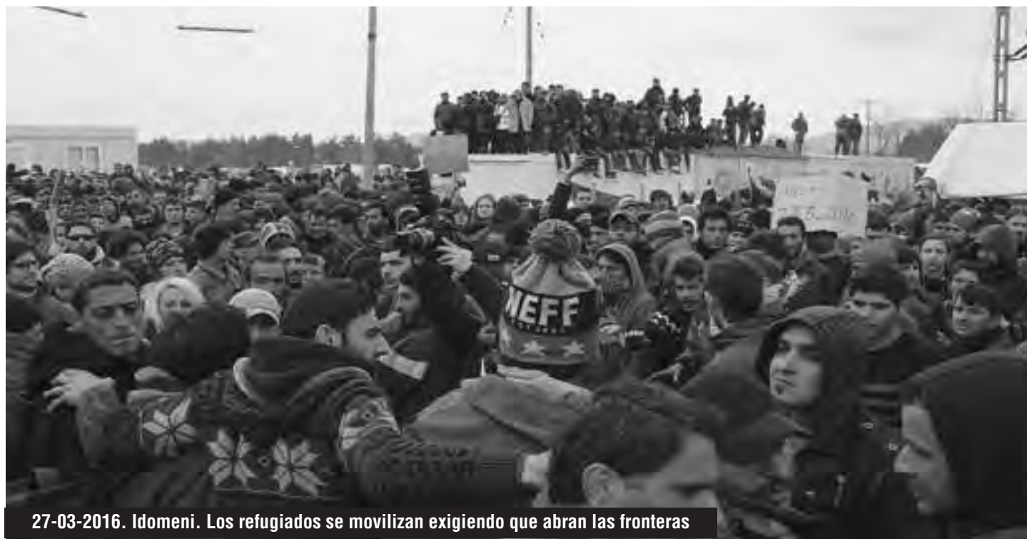
27-03-2016. Idomeni. Los refugiados se movilizan exigiendo que abran las fronteras

Si estas todavía no se han hecho masivas aún es porque el gobierno sabe que no tiene la suficiente base social como para hacerlo. Trabajadores y jóvenes griegos les llevan agua, comida, provee de atención médica.