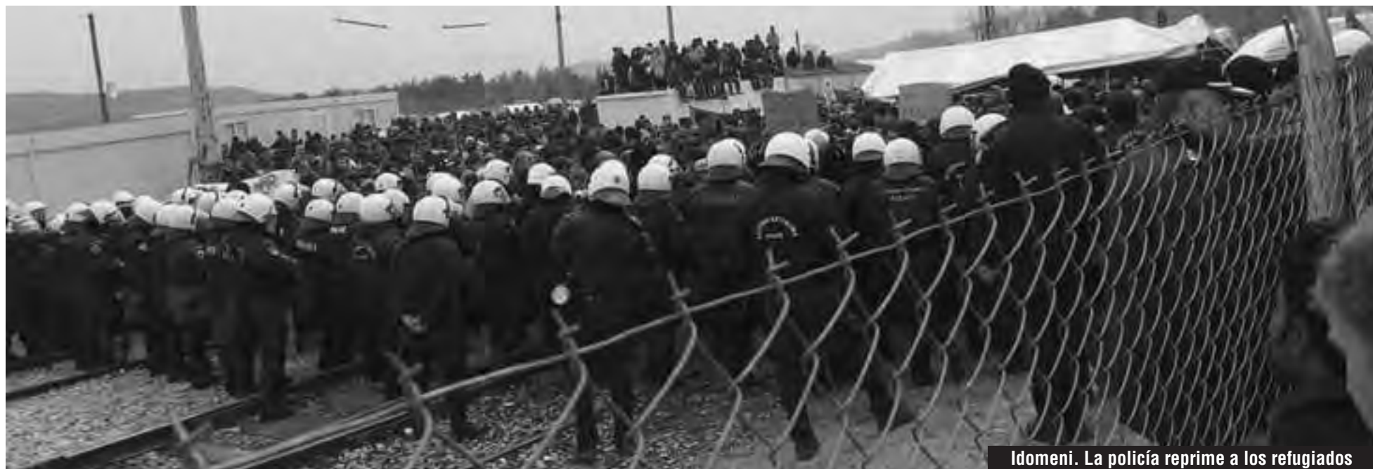
Idomeni. La policía reprime a los refugiados