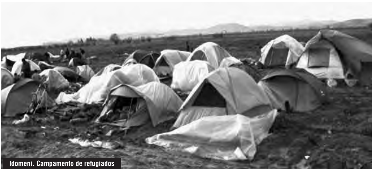
Idomeni. Campamento de refugiados

En cuanto a los refugiados que se encontraban dentro de los "puntos calientes" previamente, estos fueron a los llamados "campos de detención" (cárceles), como el de Corinto, en donde esperan la deportación a sus países, siempre y cuando sean de Pakistán, Afganistán, Marruecos, Argelia, y cualquiera que no sea ni de Siria ni de Irak.