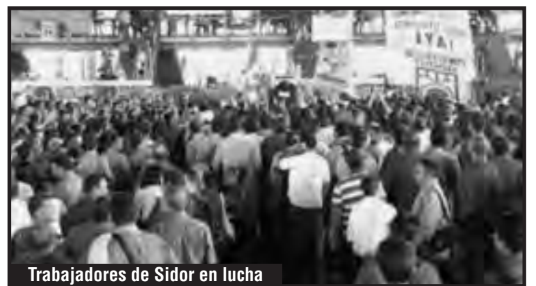
Trabajadores de Sidor en lucha

La meta de producción en toneladas métricas de acero bruto para 2015 fue fijada en un 23% de la capacidad total instalada y dicha meta se cumplió un 19%. Desde agosto de 2015 se presentó una caída abrupta de la producción, llegando a cero toneladas en diciembre, manteniéndose así en lo que va de 2016 (cero toneladas).