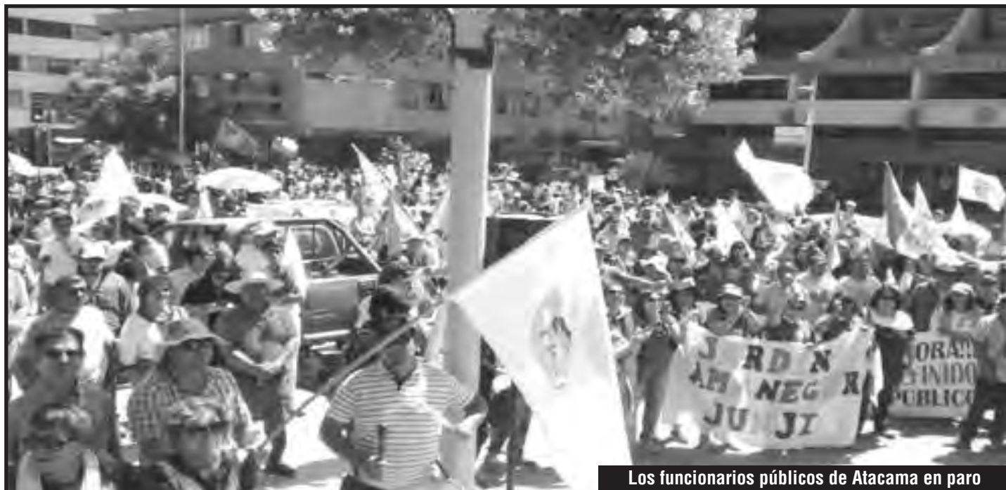
Los funcionarios públicos de Atacama en paro

Por otro lado, en un comunicado del 24/3 la Unión Portuaria, diversos sindicatos mineros y más de 60 organizaciones han llamado también a rechazar la “reforma laboral” del gobierno, planteando: “Desconoceremos la reforma laboral que surja de este parlamento, anunciando desde ya el inicio de un proceso legislativo social y sindical de cara