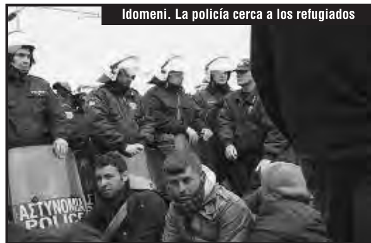
Idomeni. La policía cerca a los refugiados

todos los inmigrantes en todo Grecia a unirse a nosotros en la protesta el lunes 28/03/2016 a las 16hs. en Tesalónica; nos reuniremos en Orfanotrofio. También llamamos a los movimientos solidarios para estar con nosotros y ayudarnos a construir un futuro mejor para todos nosotros.