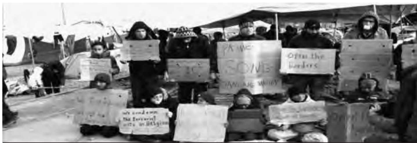
"Nuestros sueños, nuestras esperanzas y nuestra vida, se están muriendo ahora. Ayudennos." "Europa ¿ustedes quieren que sus hijos vivan la situación que están viviendo los nuestros ahora?" "Estamos muriendo lentamente aquí. Salvennos. Tenemos derecho a vivir. No cierren las fronteras frente a los refugiados."

Sin embargo no tuvo el efecto que ellos esperaban. Si bien fue una corta y efímera noticia que pudo leerse en los medios más importantes, fue totalmente opacada por los supuestos ataques terroristas sucedidos en Bélgica. Estas son maniobras de los estados imperialistas para persuadir a su propia clase obrera de que los refugiados traerán consigo "bárbaros terroristas sedientos de sangre", cuando en realidad son los burgueses y los mismos estados los terroristas.