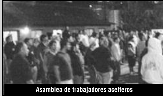
Asamblea de trabajadores aceiteros

En 2009, luego de haber conseguido la reincorporación de 8 trabajadores en la empre-