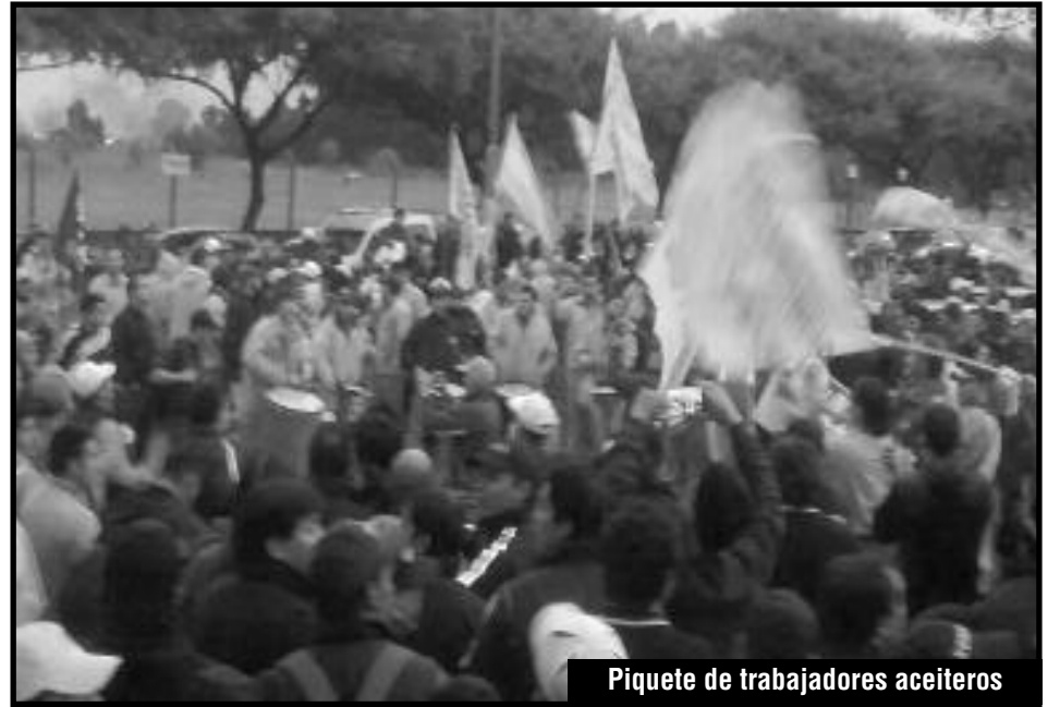
Piquete de trabajadores aceiteros