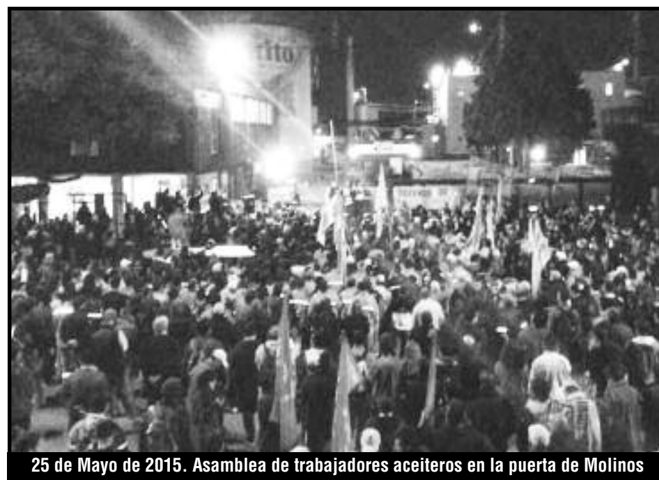
25 de Mayo de 2015. Asamblea de trabajadores aceiteros en la puerta de Molinos

Cuando todavía la victoria no estaba asegurada y la patronal y el gobierno sumaban fuerzas con los traidores de la burocracia sindical, fue el momento más dramático de esa lucha. Era el momento en que los trabajadores aceiteros necesitaban todo el apoyo activo de las organizaciones obreras. Era innegable que la patronal concentraba con el gobierno todas sus fuerzas para derrotarlos, más allá de que unos se hicieran los "buenos" y otros los "malos". Estos duros combates que aún faltaban los tuvieron que dar los trabajadores aceiteros "solos", pero seguidos con una gran simpatía por todo el movimiento obrero.