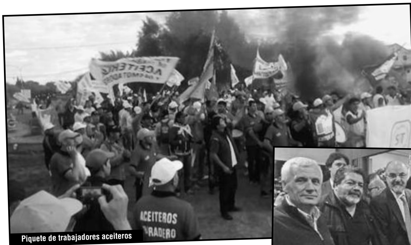
Piquete de trabajadores aceiteros