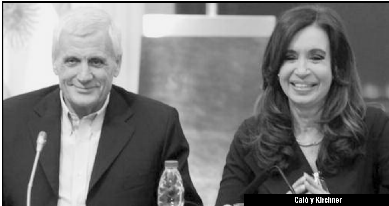
Caló y Kirchner

H oy, el gobierno quiere "contener la inflación" para que no se le desborde. Con esta excusa impuso el tope salarial. Ya le pagó 6500 millones de dólares a la Repsol, vació las cajas del ANSES, paga miles de millones de dólares a los banqueros del corralito del 2001 y del "plan canje" que hicieron los Kirchner en el 2005.