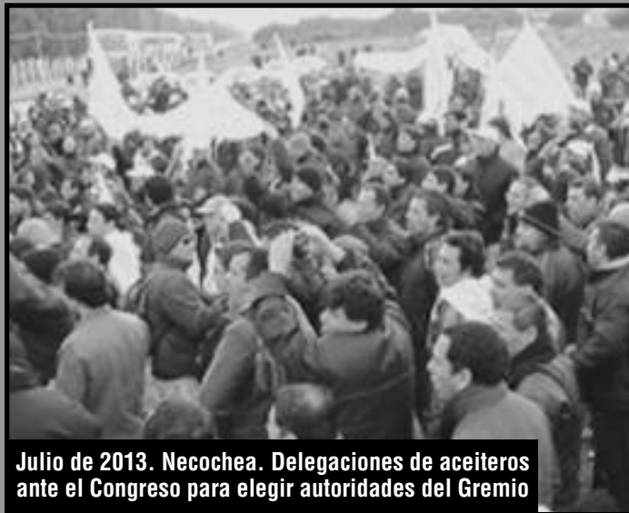
Julio de 2013. Necochea. Delegaciones de aceiteros ante el Congreso para elegir autoridades del Gremio

En tanto los trabajadores aceiteros se encontraban en el medio de una enorme huelga nacional como hace tiempo no se veía, Caló en una verdadera puñalada por la espalda, en un pacto con el gobierno, firma el acuerdo salarial por el 27% de aumento del gremio de los metalúrgicos. Esto fue un verdadero apoyo de Caló-Kristina a la patronal sojera para despejarle el camino y reventar la huelga. La segunda pata del apoyo era la de Moyano y compañía que había llamado a un paro general para un lejano 9 de junio.