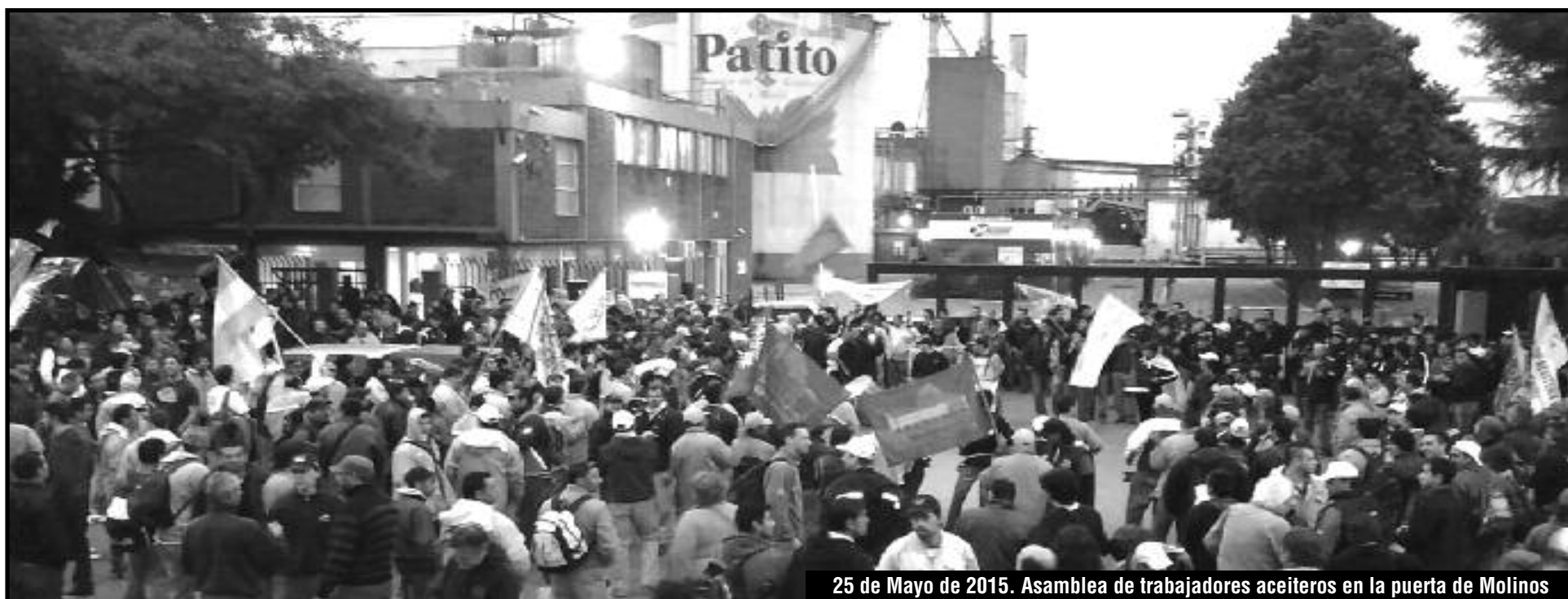
25 de Mayo de 2015. Asamblea de trabajadores aceiteros en la puerta de Molinos

LOS ACEITEROS ABRIERON UNA GRIETA... AHORA: