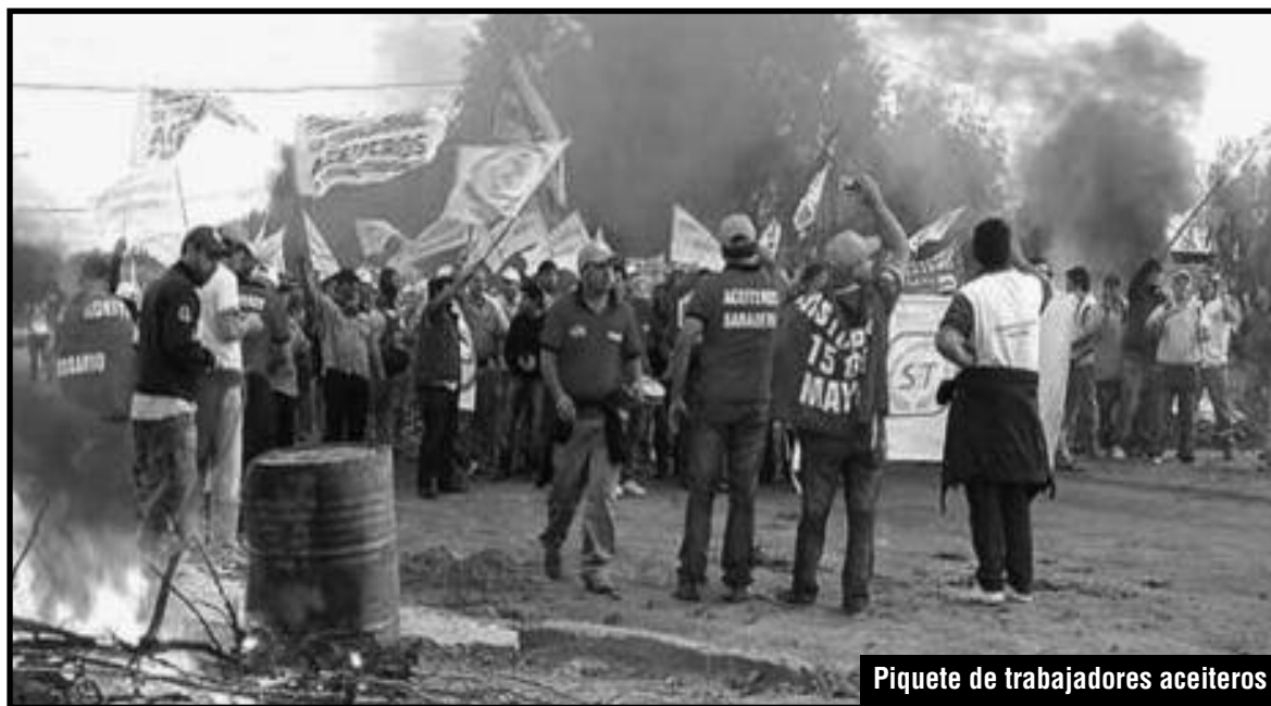
Piquete de trabajadores aceiteros

Pero la patronal y el gobierno no se quedarán tranquilos. Se relamen sus heridas y volverán por lo suyo. Los trabajadores aceiteros tienen, a nuestro entender, un enorme desafío hacia adelante para mantener sus conquistas o ir por más. Su llamado a coordinar junto a todos los trabajadores en lucha, y preparar sus próximos combates, se torna una tarea decisiva del momento.