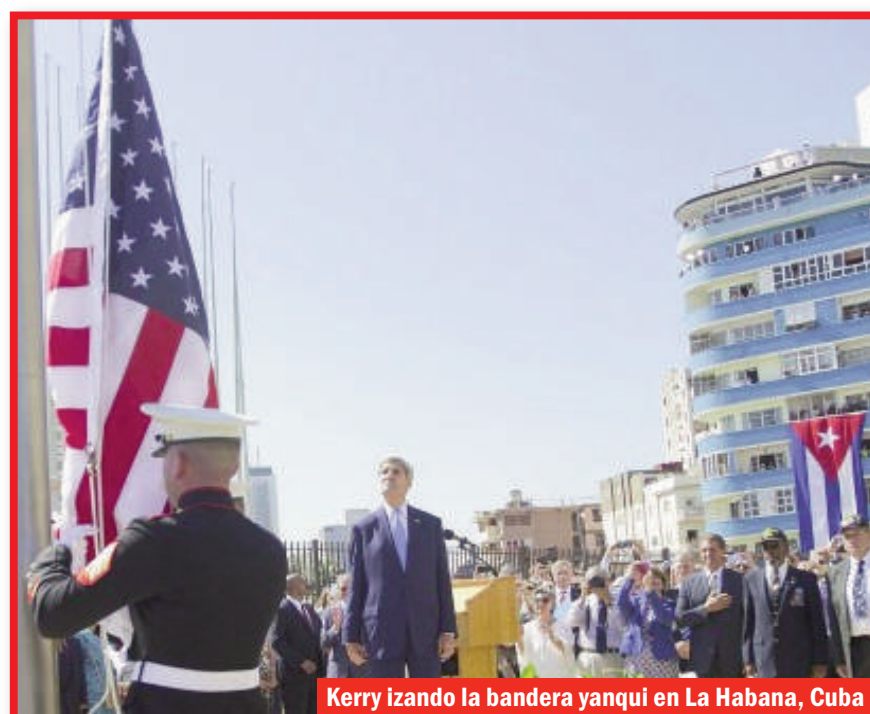
Kerry izando la bandera yanqui en La Habana, Cuba