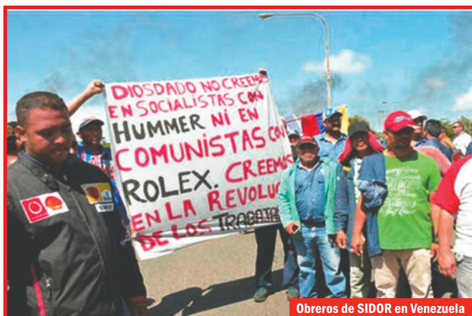
Obreros de SIDOR en Venezuela

Un rodeo para expropiar las revoluciones latinoamericanas, entregar Cuba al capitalismo e imponer el “ALCA de Bush” bajo el mando de Obama