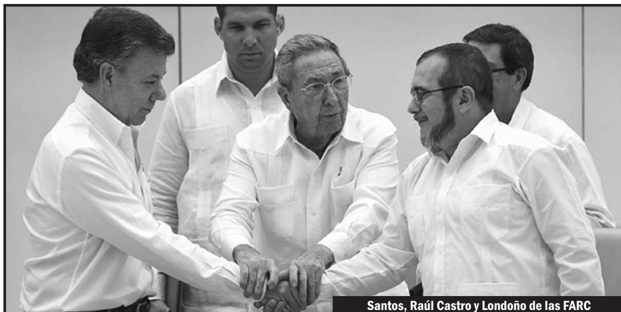
Santos, Raúl Castro y Londoño de las FARC

Las perspectivas económicas en el nuevo año le presentan un reto a las organizaciones obreras y a todos aquellos que afirman defender sus intereses. Todo ello teniendo como telón de fondo la profunda crisis que se avecina como parte de un proceso antecedido por la continua alza del dólar, la caída o desplome de los precios del petróleo y las materias primas y la relocalización de empresas multinacionales como: Adams, Bayer, Michelin, Mazada, General Motor, Kraff, etc, como parte del plan de el Transpacífico. Hoy, trabajadores como los de Peldar, General Motor, Curtiembre Titán, Goodyear, están abandonados a su suerte porque las burocracias de las centrales obreras poco les importa y la utilizan como escarmiento para el conjunto de los trabajadores maniatándolos con lo que podría