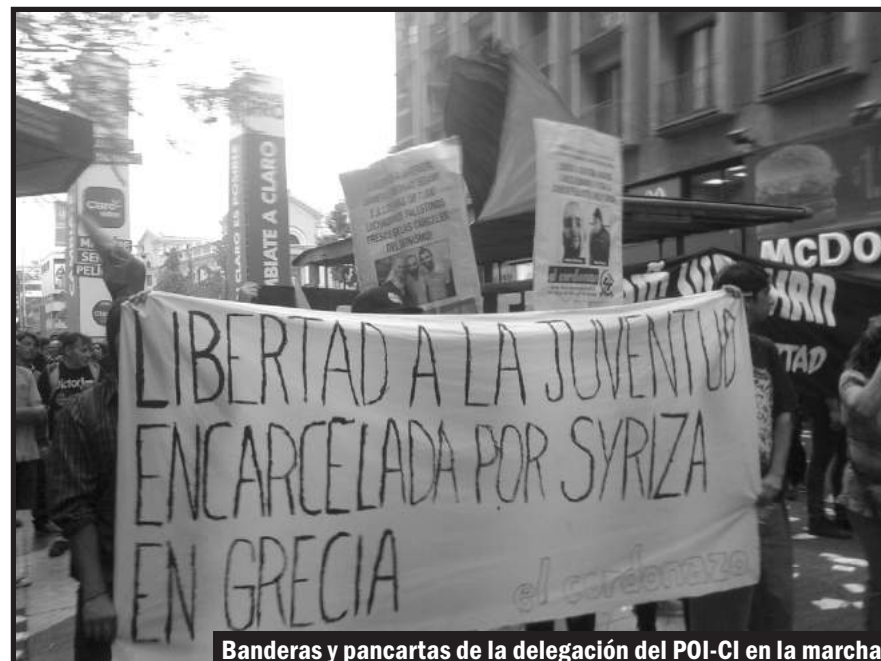
Banderas y pancartas de la delegación del POI-CI en la marcha