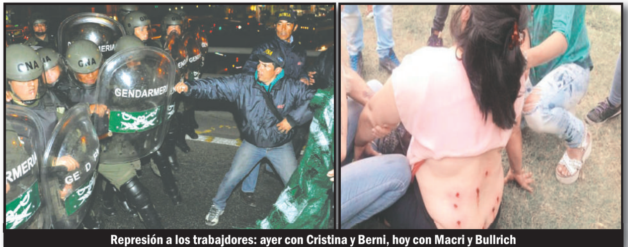
Represión a los trabajadores: ayer con Cristina y Berni, hoy con Macri y Bullrich