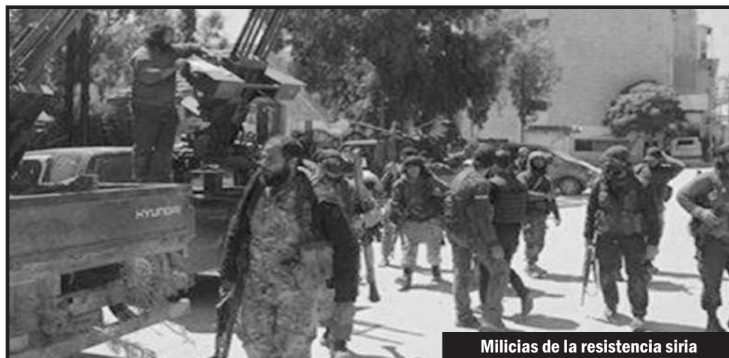
Milicias de la resistencia siria