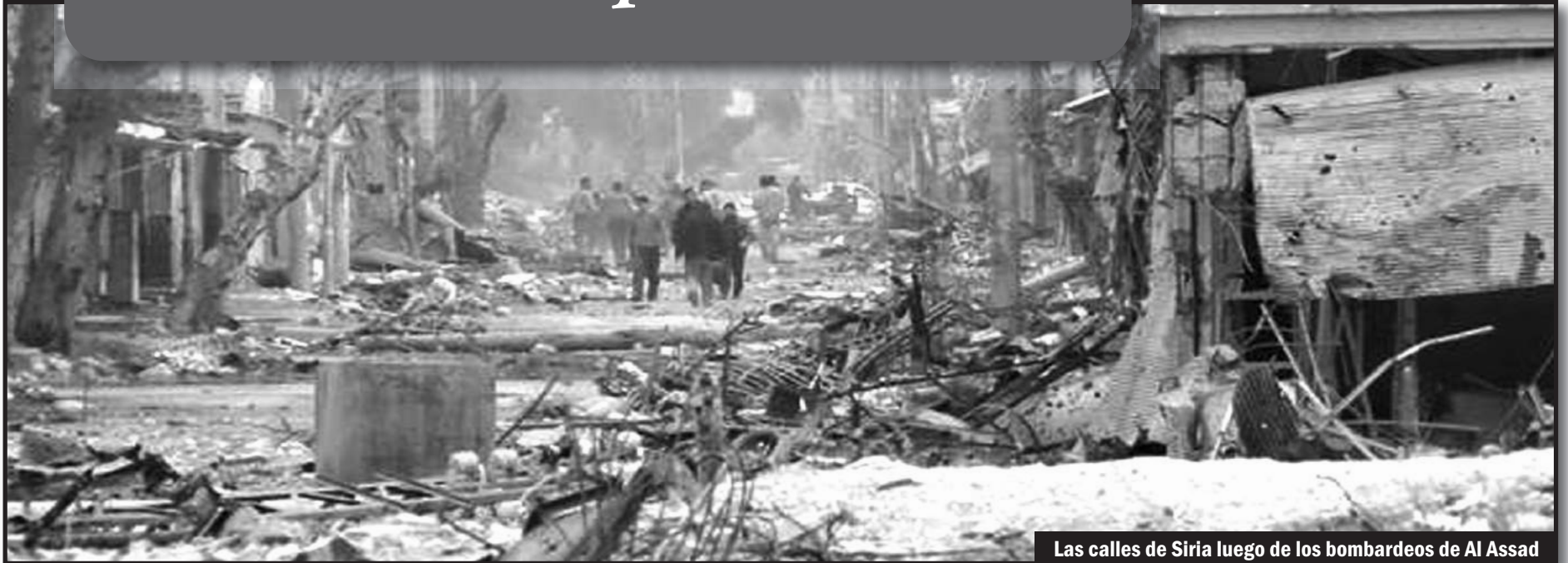
Las calles de Siria luego de los bombardeos de Al Assad

Mientras el frío azota, el hambre golpea, la contrarrevolución avanza... pero la llama de la revolución vive en las trincheras.