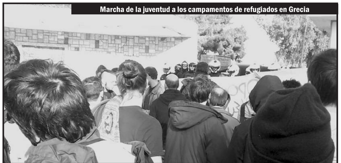
Marcha de la juventud a los campamentos de refugiados en Grecia

Hay que expropiar a todas las petroleras imperialistas que comandan esta masacre y saquean los pueblos del Magreb y Medio Oriente. Ellas son las que los dejan en esta situación desesperante de tener que huir de su tierra para buscar trabajo en