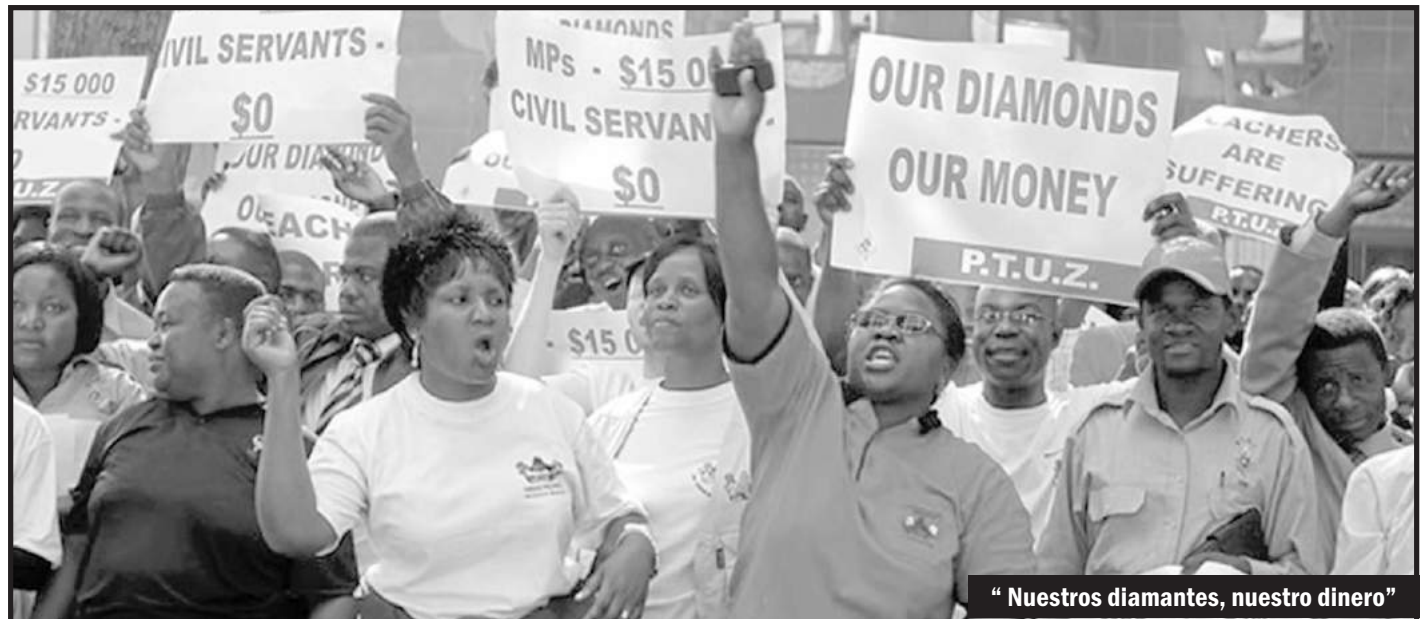
“Nuestros diamantes, nuestro dinero”

Los docentes, junto con los trabajadores de la salud y los azucareros, ga-