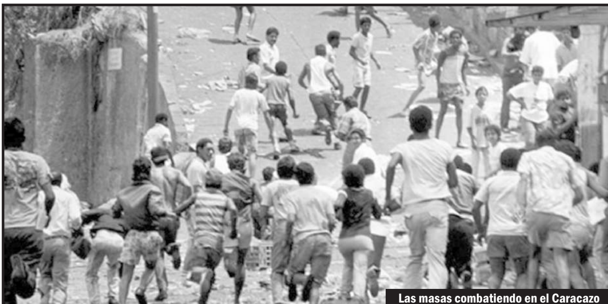
Las masas combatiendo en el Caracazo

Los bolivarianos demostraron ser tan sólo un rodeo que expropió la revolución obrera y campesina para terminar redoblando las cadenas de sometimiento de la nación al imperialismo. Ahora, luego de que Wall Street usó a gusto al chavismo, viene la otra pandilla burguesa para profundizar más el saqueo y el sometimiento. De