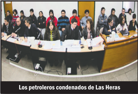
Los petroleros condenados de Las Heras