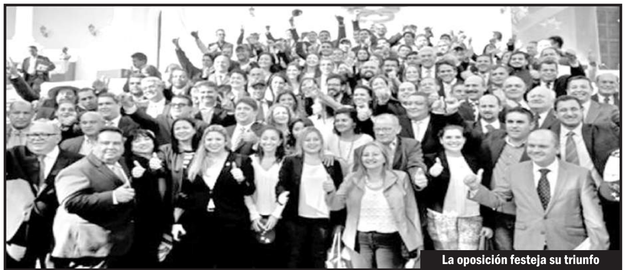
La oposición festeja su triunfo

La izquierda lacaya de los bolivarianos sostuvo al chavismo desde un inicio, vistiéndolo de “progresista” y llamando a los trabajadores a “presionarlo para que avance al socialismo”. Se la pasaron hablando durante años del “carácter antiimperialista” del gobierno de Chávez. Jamás enfrentaron la entrega chavista al imperialismo con la deuda externa, y ocultaron que éste compartía con los grandes bancos imperialistas la renta petrolera. Le juntaron millones de votos en las elecciones y sostuvieron sus referen-