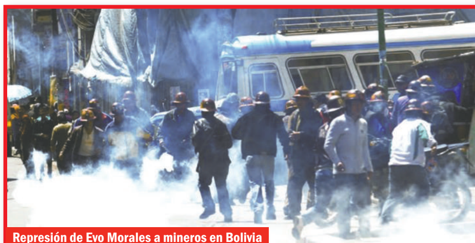
Represión de Evo Morales a mineros en Bolivia