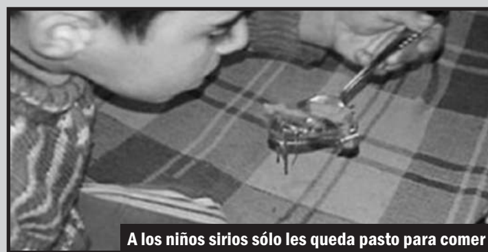
A los niños sirios sólo les queda pasto para comer

El ESL solo pacta sus intereses y deja a las masas libradas al hambre, la mi-