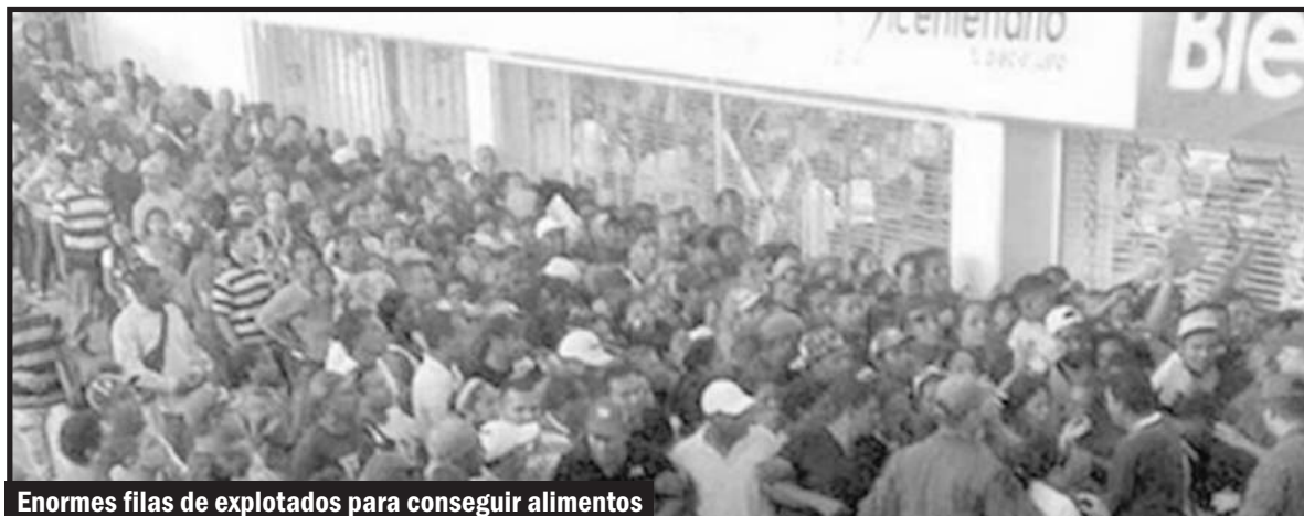
Enormes filas de explotados para conseguir alimentos