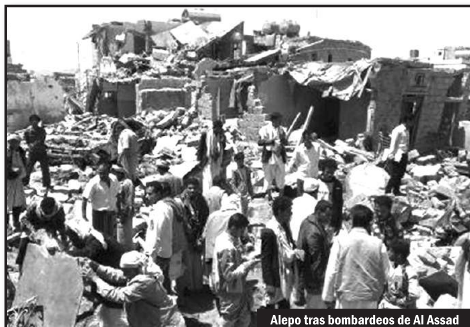
Alepo tras bombardeos de Al Assad