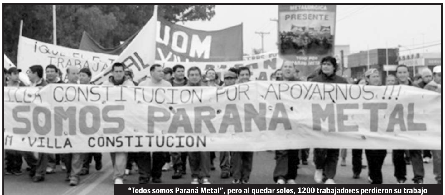
"Todos somos Paraná Metal", pero al quedar solos, 1200 trabajadores perdieron su trabajo

Durante años, nos hicieron creer que nada se podía hacer para evitar el cierre de la fábrica. Que no quedaba otro cami-