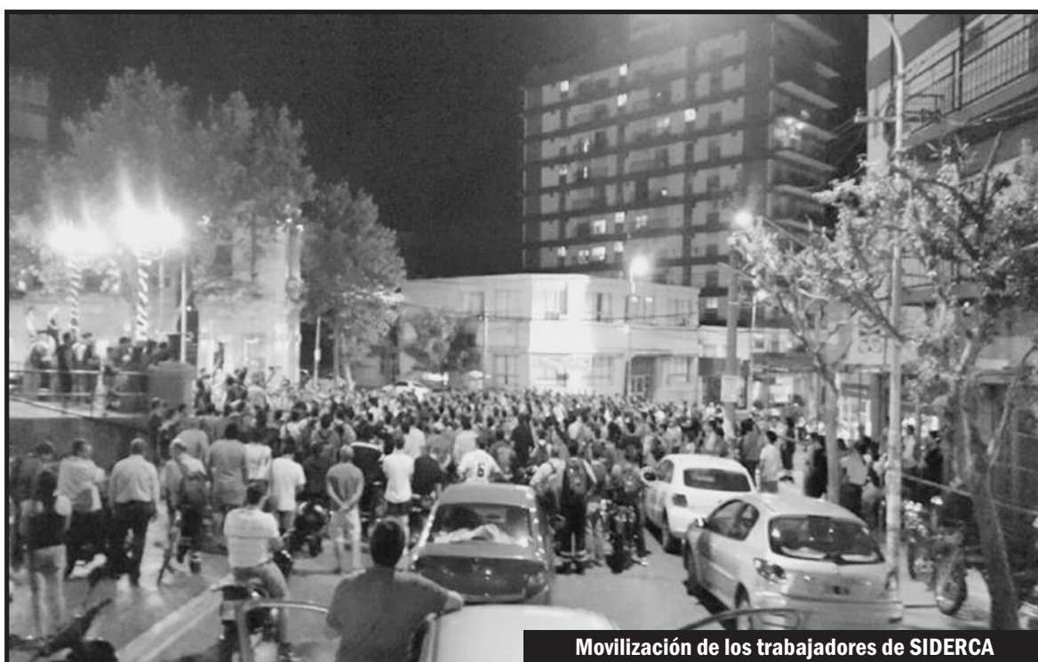
Movilización de los trabajadores de SIDERCA

Lo que demuestra que estos últimos años entre todas las empresa del Grupo Techint de las cuales Siderca solo es una, se llevaron la plata a paladas. Es por eso que