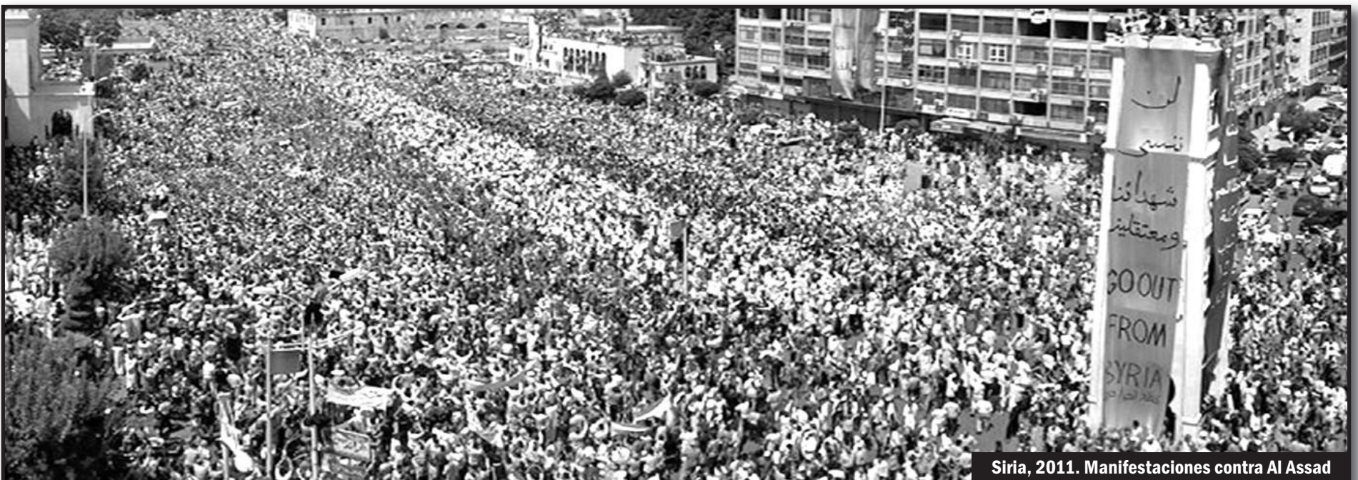
Siria, 2011. Manifestaciones contra Al Assad

E n noviembre en Viena y en diciembre en Arabia Saudita y Nueva York se realizaron Conferencias bajo el mando de Obama para terminar de cerrar el capítulo de la revolución siria. En estas participaron, como en Arabia Saudita, generales del ESL que no nos representan y que van allí a entregar nuestra heroica revolución. Ellos son los "caballos de Troya" indispensables para entregarla desde adentro.