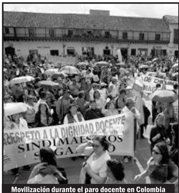
Movilización durante el paro docente en Colombia

La clase obrera colombiana, latinoamericana y mundial ha logrado otro aprendizaje -al precio de mucha sangre derramada, de persecución, encarcelamiento y humillaciones-, merced a la traición y actos viles de entrega de la pseudoizquierda y los renegados del trotskismo y el estalinismo que direccionados desde La Habana contienen las luchas para favorecer los intereses del imperialismo. Cuando el castrismo posibilita que la bandera yankee flamee de nuevo en La Habana, hay un mensaje muy claro, esa gran revolución socialista fue entregada de nuevo al capital transnacional, la gran traición a la clase obrera latinoamericana y mundial. Los bolivarianos, el FSM y otras instituciones del imperialismo, tendrán que rendir cuentas a los trabajadores del mundo, por su cobardía y servilismo atándole las manos a la clase obrera para que no sea posible defenderse del látigo de los explotadores.