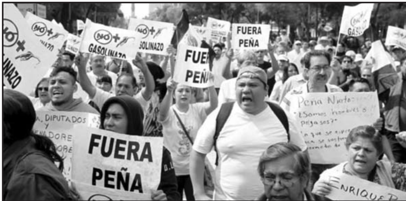
Miles de explotados en las calles enfrentando el gasolinazo

¡Queremos todo! Trump quiere que Ford y Toyota se vayan a Estados Unidos, ¡Sí, fuera gringos de México!