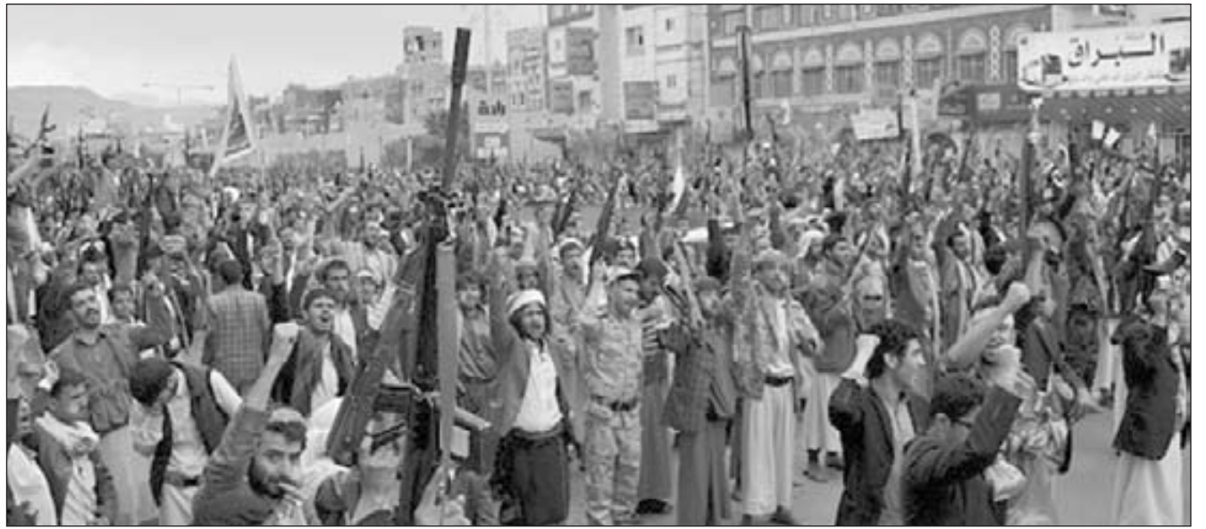
Sublevación de las masas de Yemen en 2014

Llamamos a la clase obrera turca, hoy bajo la bota de Erdogan, a levantarse por la apertura de fronteras, a imponer la retirada de las tropas turcas de Siria y a unificar el combate en Siria y Turquía por igual trabajo a igual salario. Millones de obreros sirios son trabajadores esclavos en Turquía, como lo es el pueblo kurdo y la amplia mayoría de la clase obrera turca. Allí están los batallones más importantes de la clase obrera para combatir por el pan y la libertad, derrotando al asesino Bashar y Putin, que están en un pacto con Erdogan.