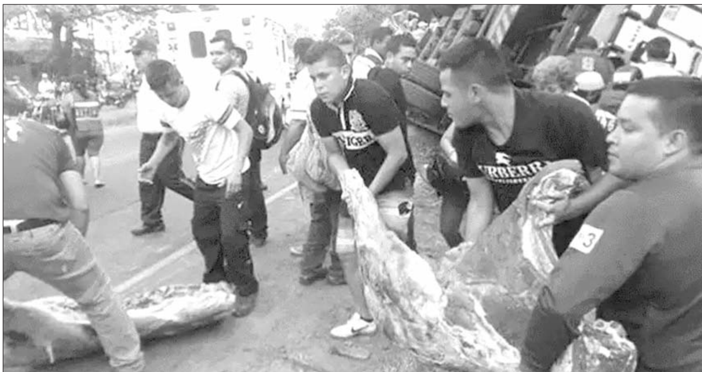
Los trabajadores y el pueblo pobre desesperados saquean los camiones de alimentos

¡FUERA MADURO, LA MUD Y EL FMI! ¡PASO A UN NUEVO CARACAZO!