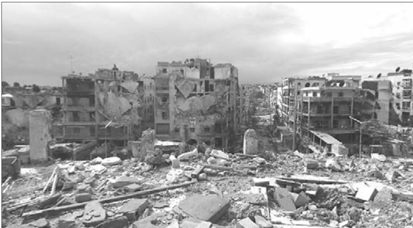
Alepo bombardeada y destruída por Al Assad y Putin

Ya en los primeros meses de 2016 Rusia y EEUU hicieron una farsa de "alto al fuego" para bombardear a mansalva Alepo y todas las zonas rebeldes. Esta masacre fue tan brutal que hasta bombardearon el campo de refugiados de Sarmada, desatando la furia de todos nosotros, pues no podíamos ni siquiera ser refugiados en nuestra propia tierra.