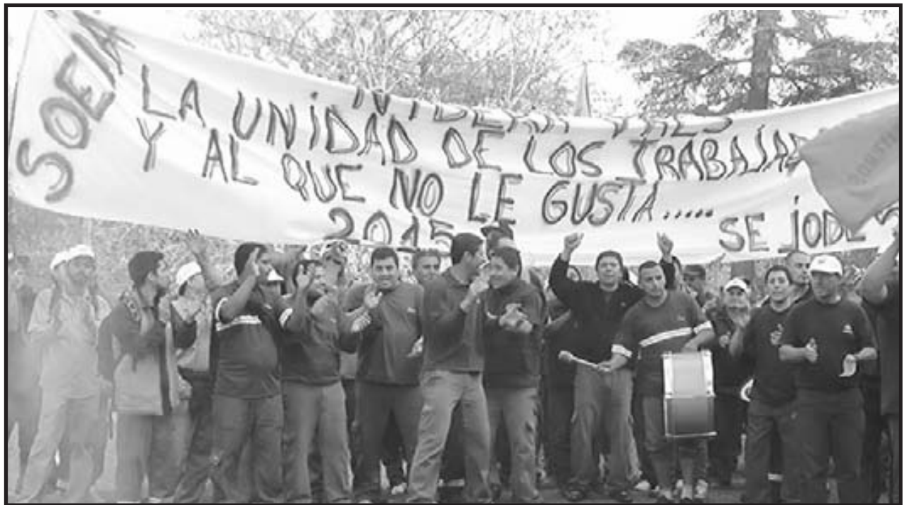
2015. La lucha de los trabajadores aceiteros rompe el techo de CFK y Kiciloff al grito de "Unidad de los trabajadores al que no le gusta se jode"

Ningún sector de la clase obrera podrá salvarse de la catástrofe que tiene preparada el gobierno y las transnacionales para nuestro futuro inmediato. Necesitamos este Encuentro Obrero para discutir un programa que unifique nuestras demandas y preparar las condiciones de la victoria y derrotar en las calles el ataque de Macri y el imperialismo. La burocracia sindical nos quiere arrodillar, los trabajadores debemos ponernos en pie de lucha y enfrentar a Macri como lo hacen los trabajadores y campesinos mexicanos contra Peña Nieto.