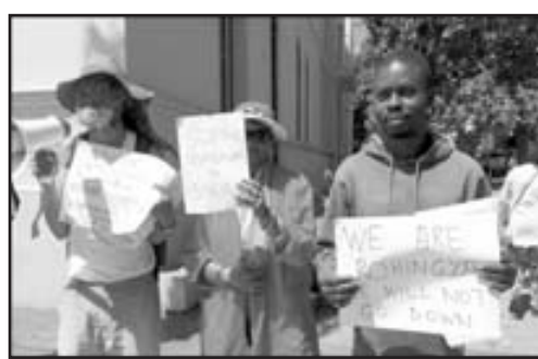
"Paremos la masacre en Siria" "Somos Rohingya. No caeremos"