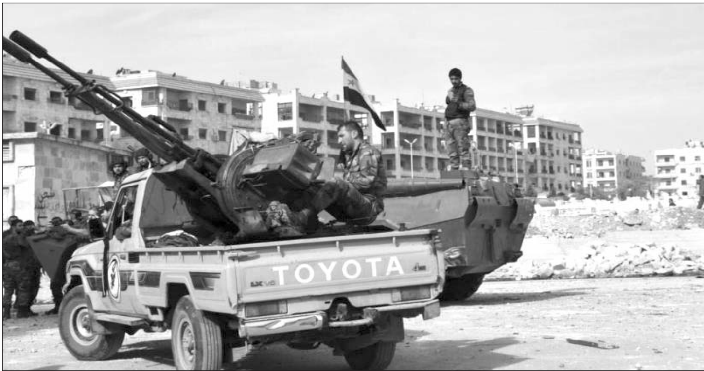
Tropas del ejército mercenario de Al Assad entrando a Aleppo

La actual contraofensiva contrarrevolucionaria por recuperar Aleppo por parte del régimen genocida de Al Assad junto a las tropas de Putin, los ayatollahs iraníes y Hezbollah, que ha dejado nuevos miles de masacrados y tierra arrasada en todas las ciudades en manos de las masas rebeldes, ha puesto al descubierto el siniestro rol de aquellas corrientes que en nombre de la “neutralidad” sostienen la masacre de Bashar Al Assad. Tal es el caso de la dirección del PTS y el Nuevo MAS, que han dicho que los bandos en pugna en la guerra civil siria son reaccionarios y que es indistinto para el destino de las masas y los explotados quién se imponga en la batalla de Aleppo.