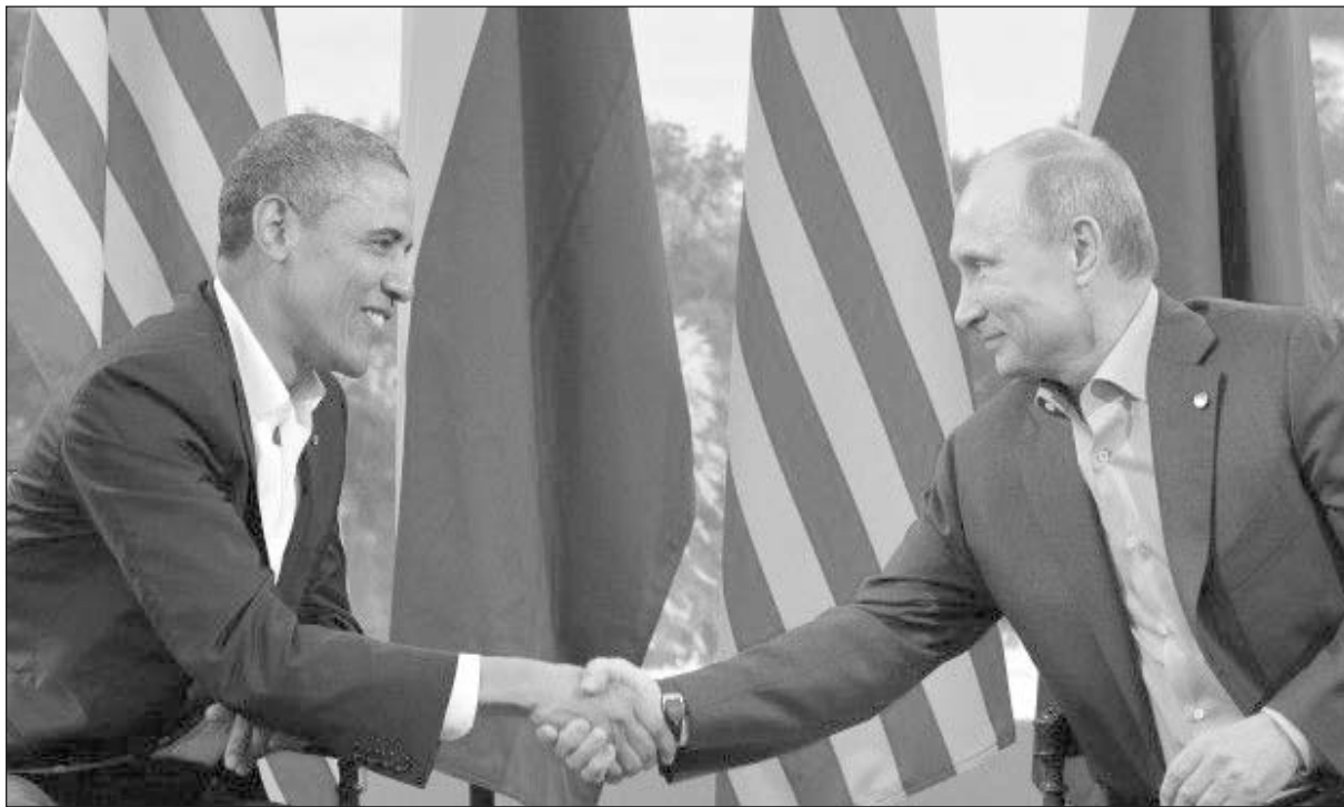
Obama y Putin

Todo socialista serio, se llenaría de vergüenza al leer las decenas y decenas de brutalidades antiobreras escritas en La Izquierda Diario por los dirigentes del PTS alrededor de la cuestión siria. A no ser por la necesidad de enfrentar el veneno que arrojan sobre miles de honestos trabajadores y luchadores, sólo se merecen silencio y el más absoluto desprecio.