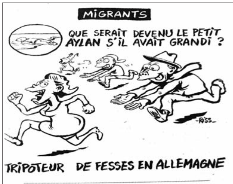
Tapa de la revista fascista francesa Charlie Hebdo: “¿En qué se hubiera convertido el pequeño Aylan si hubiera crecido? Manoseador de nalgas en Alemania”

Para justificar su encubrimiento a la masacre de Al Assad y el darles la espalda a los trabajadores y explotados que combaten contra el régimen genocida sirio y sus tropas mercenarias, la Nueva Izquierda mundial reproduce la propaganda imperialista hacia los pueblos musulmanes del Magreb y Medio Oriente con la que justifican el saqueo imperialista de la región y sus invasiones militares. Con su campaña islamofóbica antimusulmana y contra el jihadismo, el imperialismo ha cometido sus masacres más atroces contra las masas. Lo ha hecho ayer en las guerras de Irak y Afganistán, y hoy en Siria con la excusa perfecta de la “lucha contra el ISIS” masacra a las masas de la mano de Al Assad y Putin. Que estamos ante una descarada propaganda imperialista para justificar su accionar en la región lo demuestra que hasta los que ayer representaban al “eje del mal” como los ayatollahs iraníes y Hezbollah, hoy son soldados correctos de su causa y aliados en la masacre contra las masas sirias.