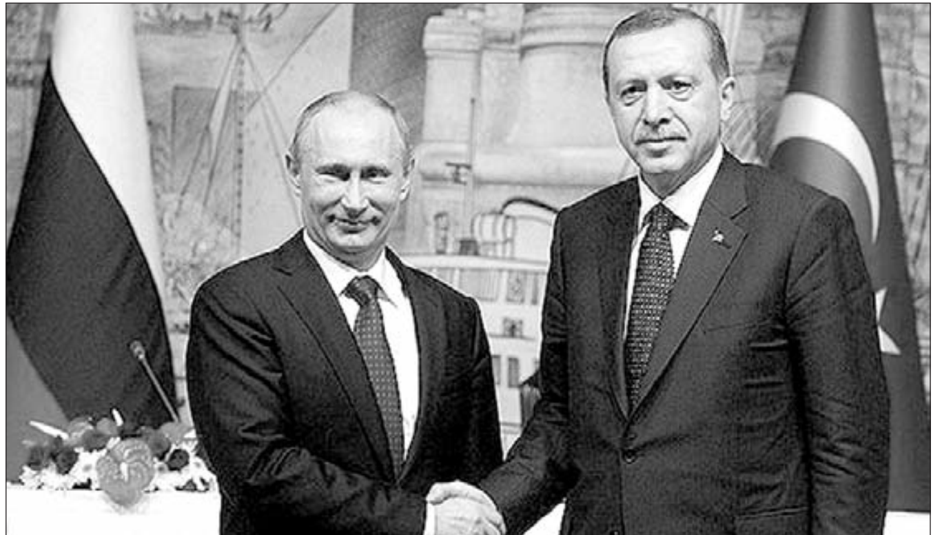
Putin y Erdogan

Ellos temen porque saben que si tenemos el fusil conquistamos el pan. Por eso coparon y disolvieron los comités de coordinación, los organismos de doble poder del pueblo y los