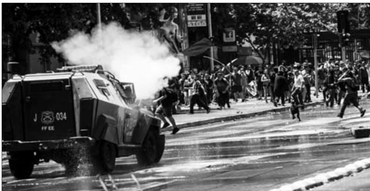
Represión en la jornada de Paro Nacional del 4 de noviembre de 2016

¿Y ahora qué dirán todas las corrientes que llamaron a incidir en las "reformas" del gobierno y sentarse en sus "mesas de diálogo" en el Parlamento corrupto? Izquierda Libertaria (ex FEL), el MIR en todas sus variantes, renegados del marxismo como el PTR, etc., afirman que el problema es que "la Bachelet giró a la Derecha", que "se negó a apoyarse en los movimientos sociales" y le "terminó cediendo a los empresarios": una verdadera lavada de cara por parte de corrientes que se dedicaron durante todos estos años a hacer pasar como "democrático" y "presionable" a este gobierno de la "Concertación ampliada", agente directo del imperialismo y enemigo declarado de los trabajadores. Un gobierno de colaboración de clases que surgió como el gobierno "más de izquierda" que podía dar el malo-