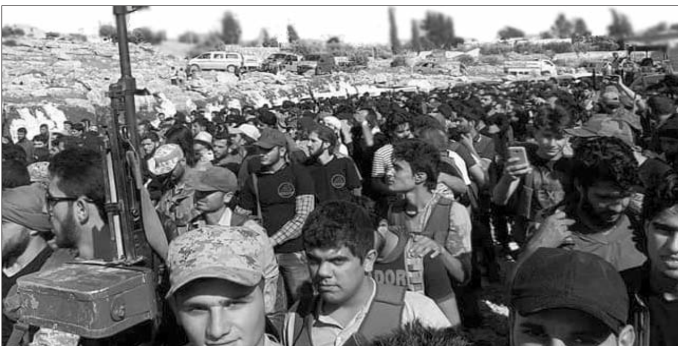
2016. Movilización a los cuarteles de los generales burgueses del ESL en busca de armamento

* Lucharemos por una Asamblea Nacional Revolucionaria que exprese la autoorganización y la democracia de los de abajo, es decir, de la amplia mayoría de nuestro pueblo para recuperar todas las fuerzas y capaci-