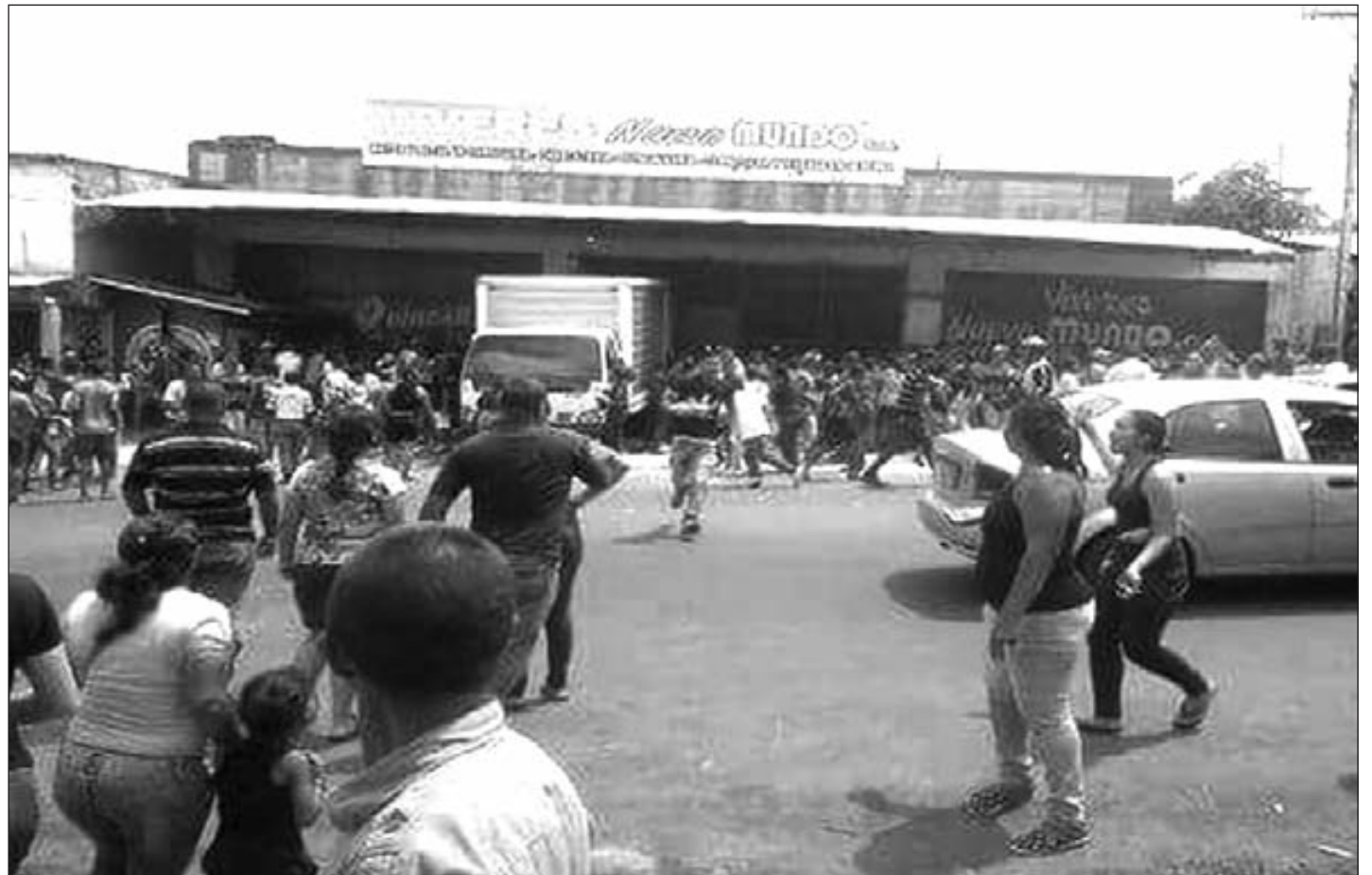
Saqueos en los barrios obreros de Caracas

¡ Comités de abastecimiento obreros y populares para garantizar que el alimento expropiado llegue a las familias trabajadoras!