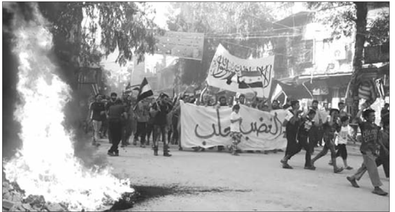
Agosto de 2016: las masas de Aleppo se levantan para romper el cerco

Incluso llegamos a donde ninguna dirección burguesa quería que lleguemos, a las puertas de uno de los barrios más ricos de Aleppo llamado Hamdaniya , donde tienen residencia todos los miembros de la alta burguesía siria tanto “basharista” como “opositora”. Sin embargo, al ver que los oprimidos comenzábamos a irrumpir en los lujosos edificios de los explotadores, Turquía y el alto mando del ESL comenzaron a amenazar a todos los que estábamos allí para que no avanzáramos. Hicimos caso omiso a ello y 1.000 de nosotros, provenientes de brigadas del ESL, de Al Nusra y otras brigadas independientes, entramos a ese barrio. Comenzamos a adentrarnos dividiéndonos en dos grupos de 500. Contra nosotros, el imperialismo yanqui mandó sus drones y atacaron al grupo que iba más adelante. De nada sirvió cubrirse en los edificios, pues era armamento de última tecnología. Este ataque dejó fuera de combate a casi 450, por lo que nos vimos obligados a retroceder. Nuevamente quedaba claro que todas las clases poseedoras de Siria, aún en el medio de