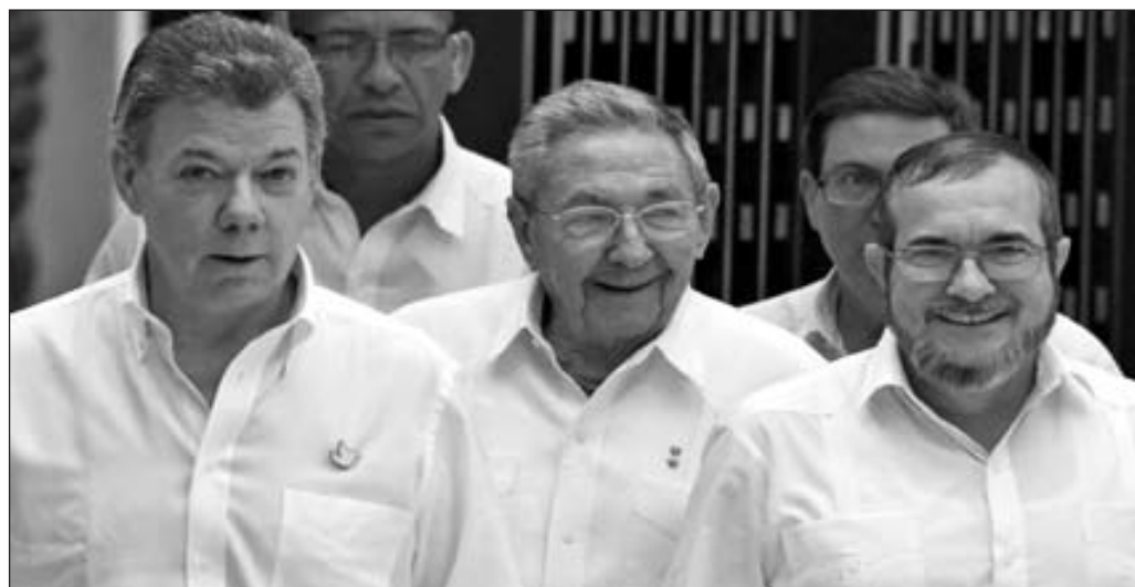
Santos, Raúl Castro y Timochenko de las FARC

¡Basta de tanta injusticia contra los explotados!