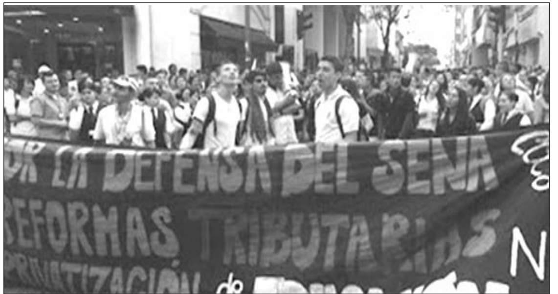
Movilizaciones contra la Reforma Tributaria

Luchar además por el desmantelamiento de los grupos paramilitares que se mantienen con la anuencia del ejército y policía genocidas al servicio de la patronal. Por tanto nuestra respuesta desde el punto de vista de la clase es enfrentar este gobierno de Unidad Nacional de la burguesía, que afianzará más la presencia