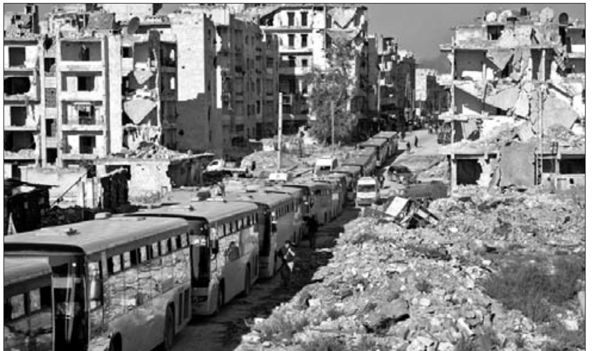
Los micros de la "evacuación" de Aleppo

Las fuerzas mercenarias basharistas y sus aliados Putin, Hezbollah y los ayatollahs iraníes demolieron nuestro Aleppo rebelde. Bombardearon todas las casas, hospitales, abastecimiento de agua y electricidad. Después de meses de cercarnos, arrojar sus bombas de barril, de racimo, gas clorhídrico y misiles, terminaron por destruir todos los edificios y las casas donde vivíamos. Masacraron mujeres, niños, a todo hombre que salía a su paso.