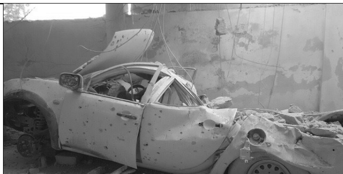
Cuartel de los milicianos rebeldes de la Brigada León Sedov bombardeado por Putin y Assad a cuenta de Obama

¡Hay que decir la verdad! Porque la izquierda vendehumo y agente del gran capital solo tira veneno en la cabeza de los obreros. Obama y Putin coordinan no chocar sus aviones en el espacio aéreo de Siria. EEUU, con la burguesía