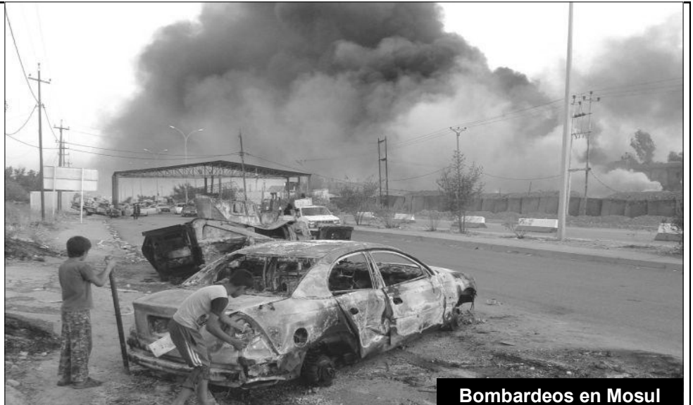
Bombardeos en Mosul

Está volviendo EEUU a retomar control pleno y directo en su protectorado. Y lo hace como en el 2003, con una coalición comandada por él, donde todos los siguen. Volvieron los yanquis de Bush a Irak, esta vez bajo el mando de Obama. Están todos juntos en una misma ofensiva, con EEUU a la cabeza. Él manda en su protectorado y él reparte.