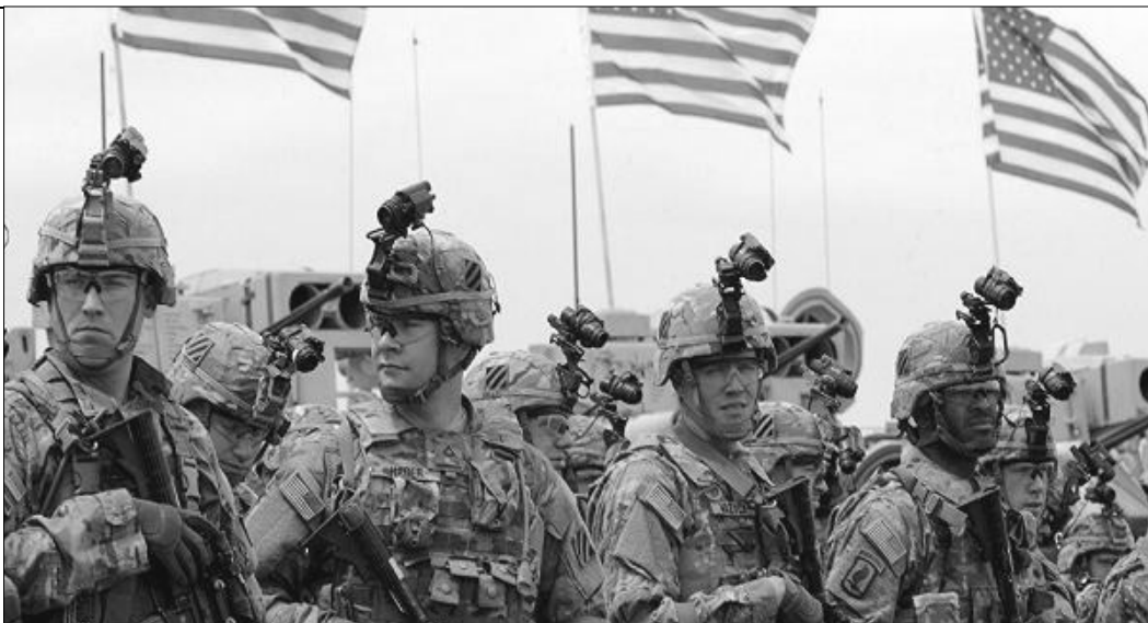
EE.UU. despliega fuerzas militares para el ataque a Mosul

Es que el ISIS no son más que hombres de negocios que, enviados por el imperialismo, se dejaron crecer la barba, adoptaron un discurso islámico radical y antiimperialista, y con demagogia de migajas otorgadas a las masas fueron con su guardia armada a las zonas donde éstas se habían insurreccionado en el 2014 (Mosul entre ellas), destruido al ejército iraquí y todo control del estado, para controlar a las masas. Una vez allí, montados por