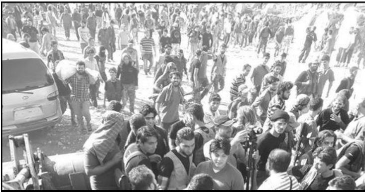
Cuarteles tomados por trabajadores y campesinos pobres en Aleppo

Desde la FLTI estamos en una dura lucha política contra la izquierda vende humo, la que sostiene como enfermeros al capitalismo en bancarrota, o bien gobierna directamente a cuenta de los banqueros como Syriza o Podemos. No tenemos nada que ver con los impostores del socialismo que aíslan y cercan a las revoluciones y a los revolucionarios; con reformistas y cínicos contrarrevolucionarios que hacen “brigadas” y “milicias” internacionales no para ir a combatir por la revolución sino para ir a matar por la espalda a revolucionarios, como lo han hecho partidos stalinistas de Europa, que han ido al Donbass a matar a cuanto miliciano no se haya sometido a los pactos contrarrevolucionarios de Minsk de Obama y Putin.