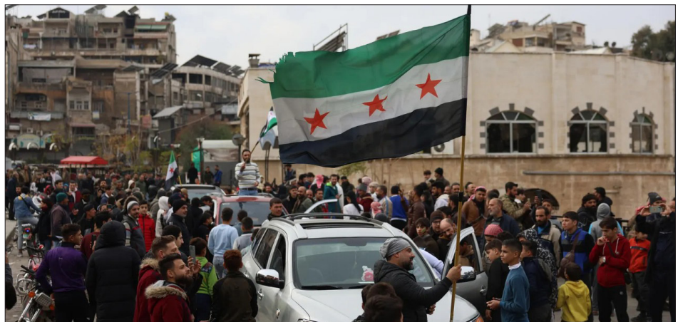
Las masas toman las calles de Hama

EEUU, que controla el norte de la Siria partida y saqueada, pone en alerta a sus guardias privados y a la YPG de