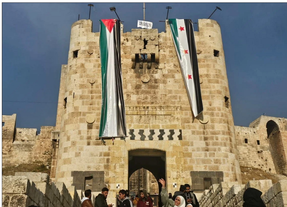
Castillo de Alepo con banderas de Palestina y de la revolución siria

La nación yemení en armas atacando los suministros al ejército sionista, y el canalla de Putin y la oligarquía rusa que tanto apoya la izquierda rastrea stalinista, silenciando que su jefe es uno de los