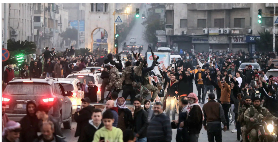
Hama. Las masas celebran en las calles la toma de la ciudad

Los socialistas sirios afirman que no lucha por el triunfo de la revolución siria quien no parte de reconocer el derecho inalienable a la sublevación de las masas contra todas las fuerzas ocupantes y su régimen colonial y gobierno fascista. Quien no reconoce este derecho elemental, democrático revolucionario y antiimperialista de las masas, es un vil traidor. Y son los mismos que ayer le daban condonaciones al sionismo cuando la resistencia palestina se defendía de los ataques de